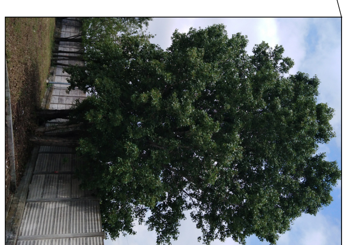
TIGLI - DIAM. MAX CM 25