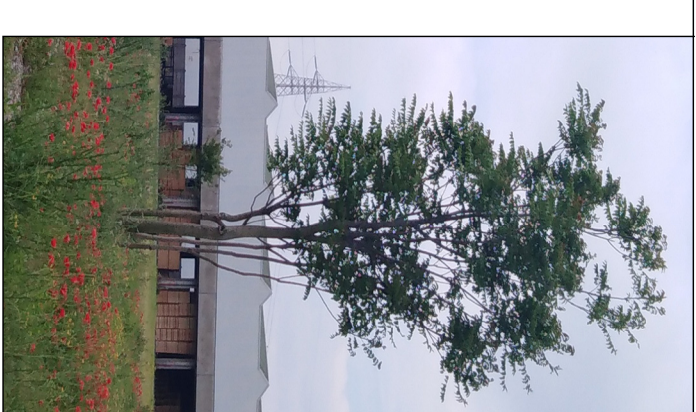
ROBINIA - DIAM. CM 15