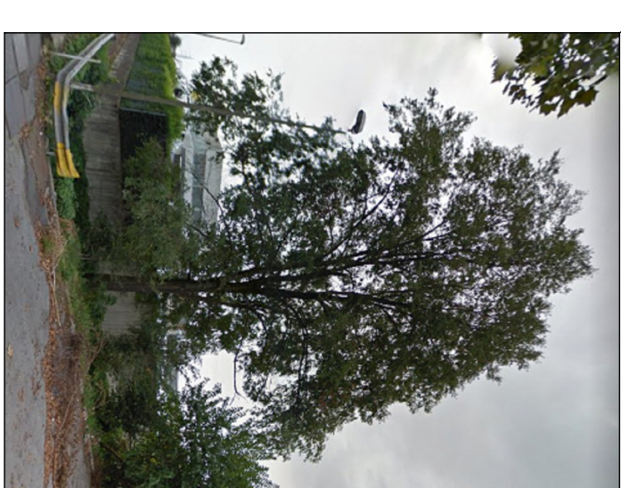
ROBINIA - DIAM. CM 25