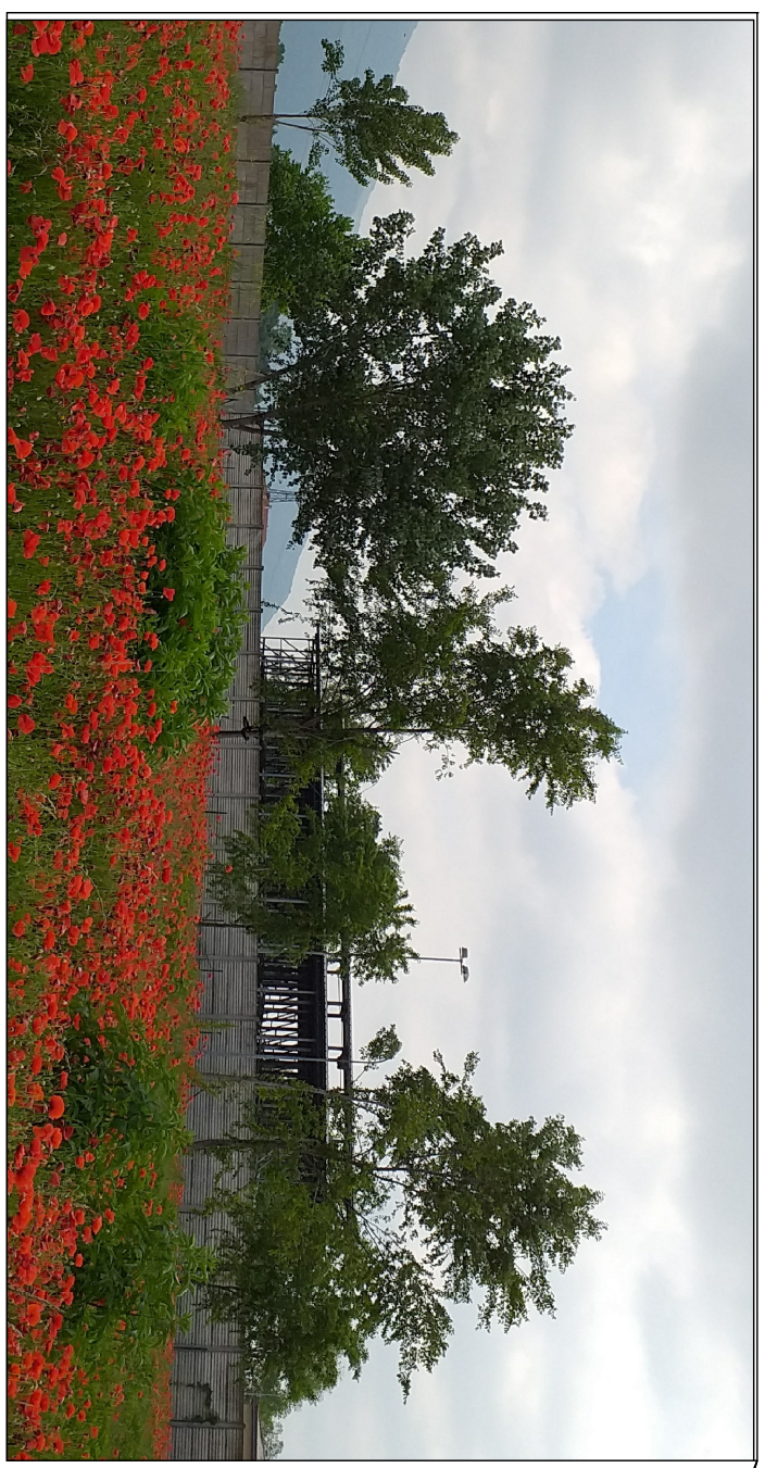
PIOPPI DIAM. MAX CM 15 - ROBINIE DIAM. MAX. 10 CM