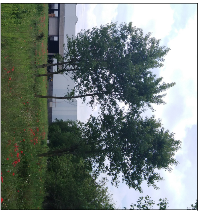
PIOPPI - DIAM. MAX CM 10