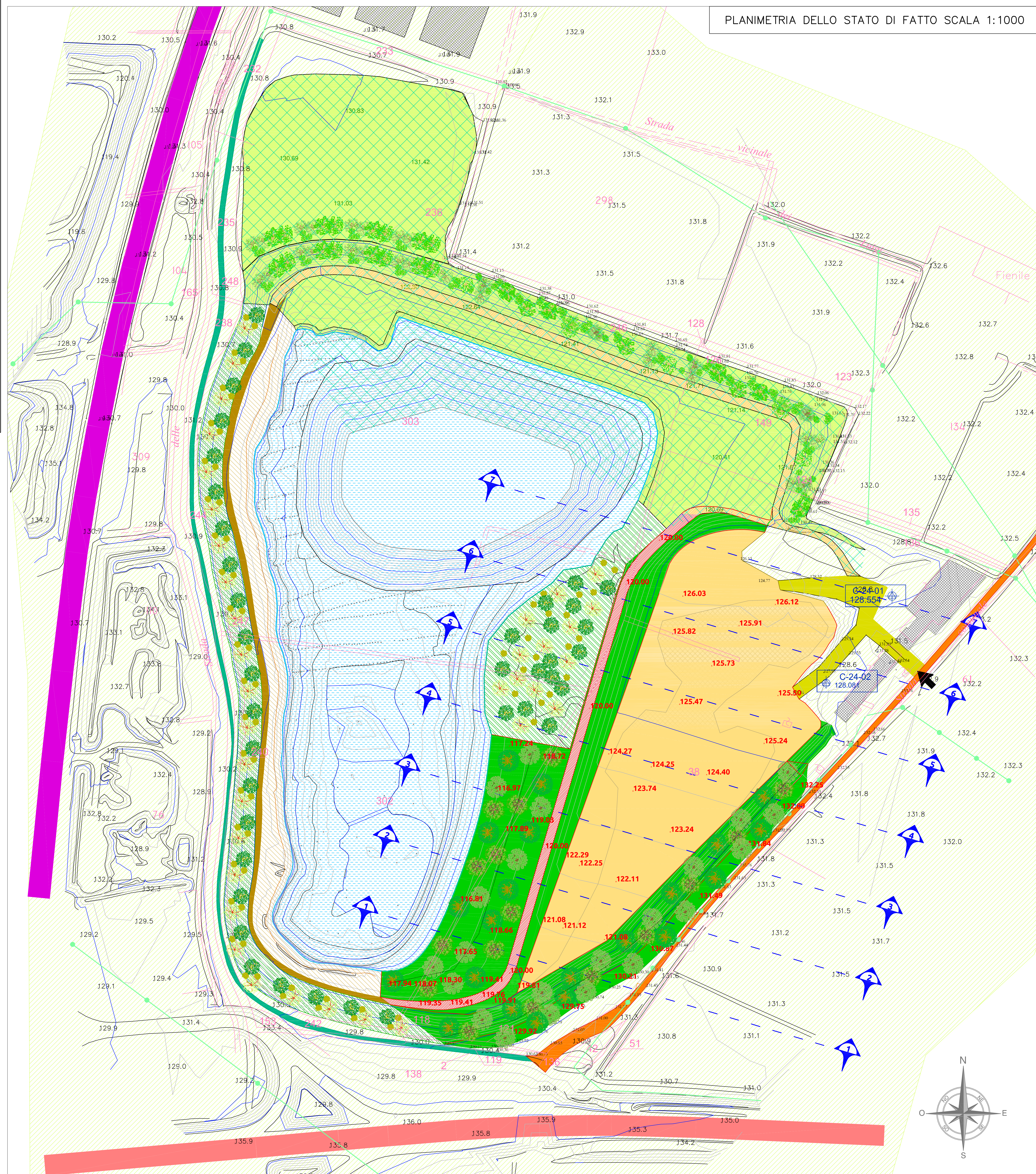
PLANIMETRIA DELLO STATO DI FATTO SCALA 1:1000