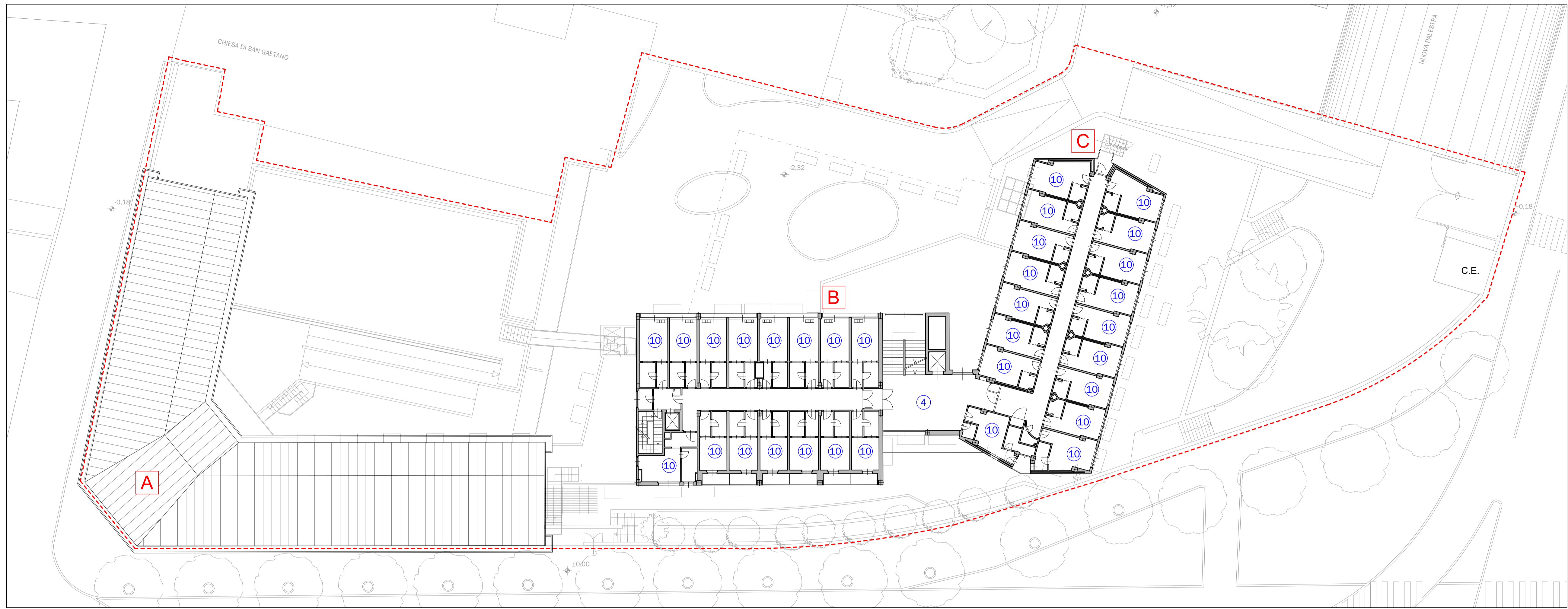
PIANTA PIANO TERZO