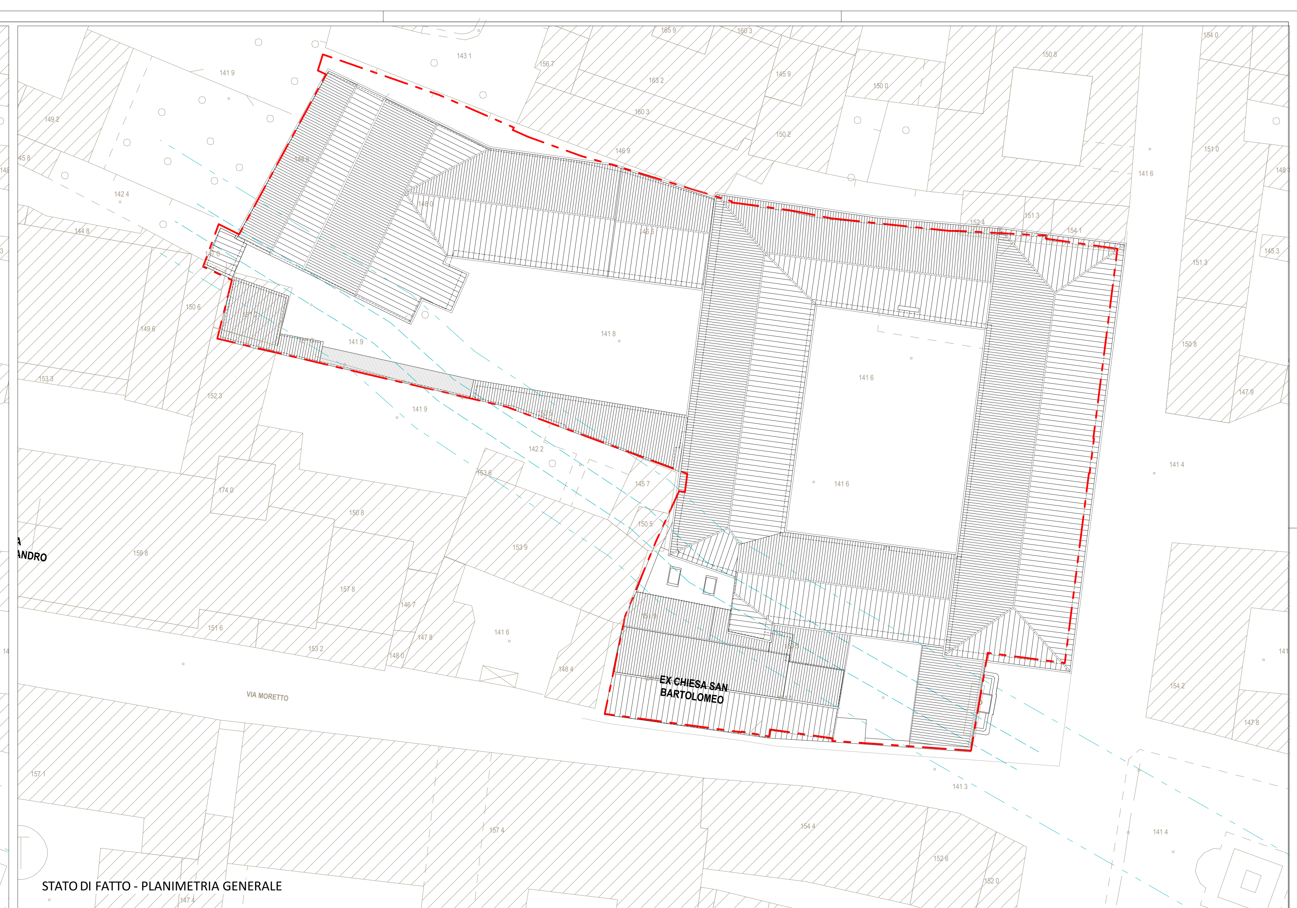
STATO DI FATTO - PLANIMETRIA GENERALE