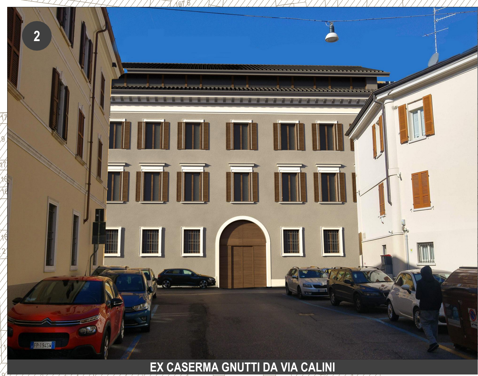
EX CASERMA GNUTTI DA VIA CALINI