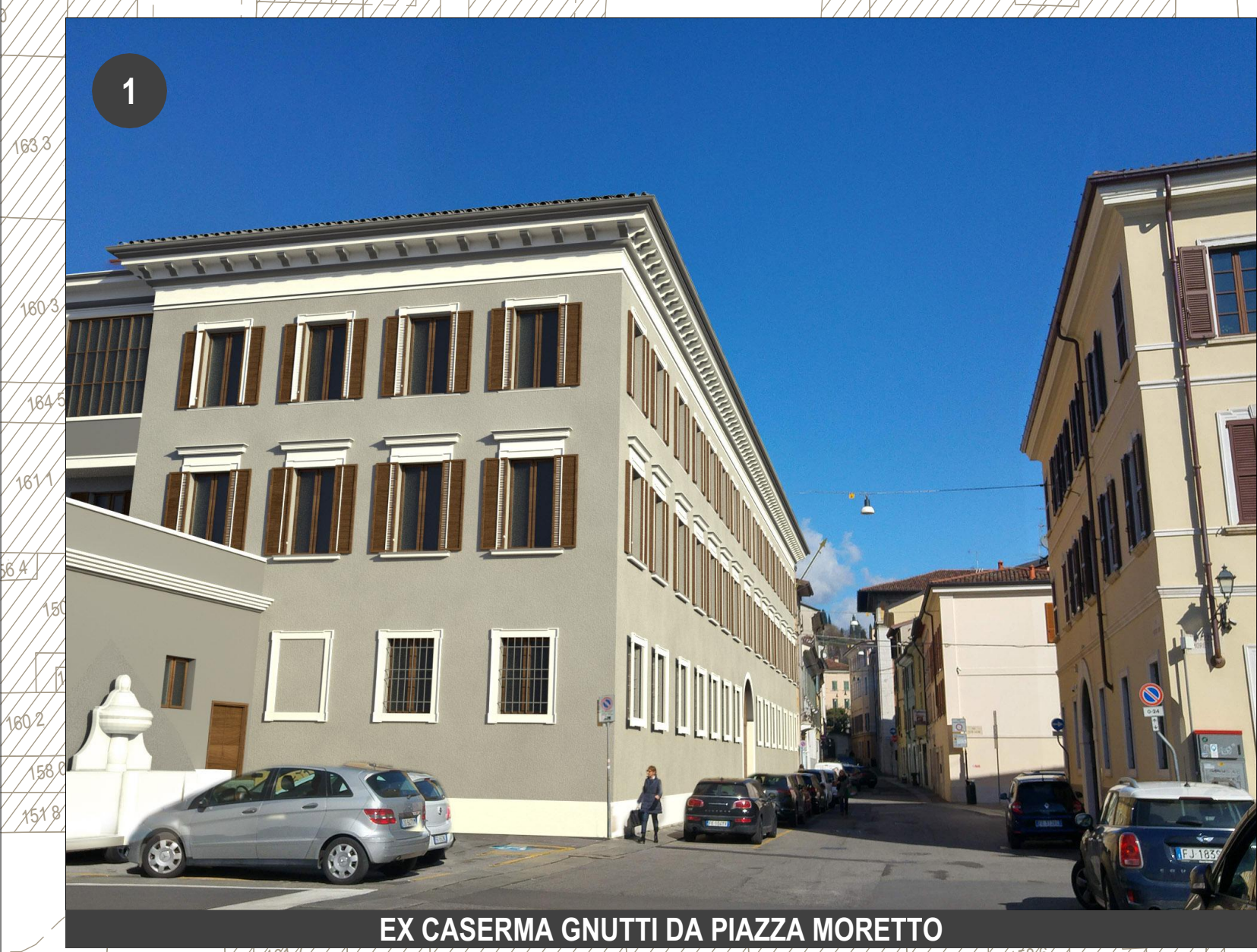
EX CASERMA GNUTTI DA PIAZZA MORETTO