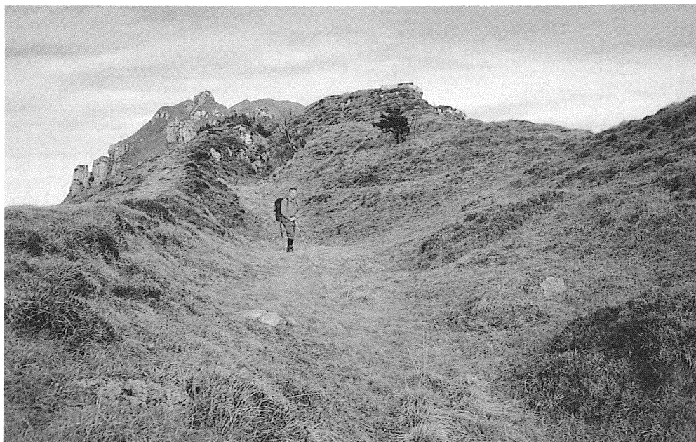
Fig. 5 - M. Campello: sdoppiamento del crinale.