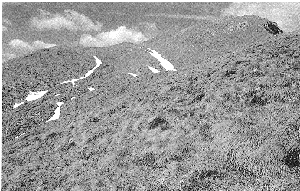
Fig. 7 - Dosso Alto: la scarpatina di collasso del versante ESE.