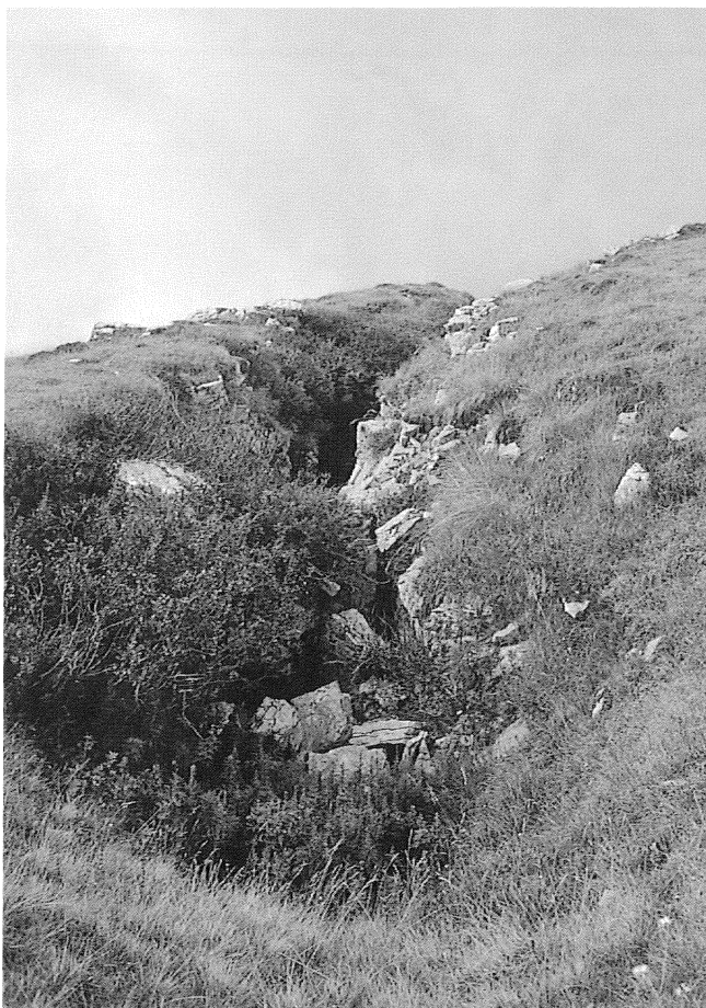
Fig. 3 - M. Stalletti: il trench maggiore.

Secondo CASSINIS (1981) le due Formazioni si sono scollate dal substrato costituito dall'Arenaria di Val Sabbia nel corso di un movimento da nord verso sud, ricollegabile agli