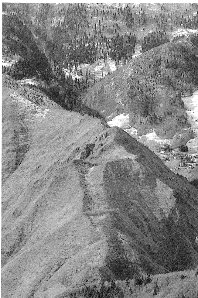
Fig. 4 - M. Pergua: sdoppiamento del crinale a E di q. 1060 m.

Lungo i versanti sud e sud est del M. Campello, poco a valle delle «trincee», si estendono due zone di frana di scoscendimento, attive, che interessano l'affioramento della Dolomia Principale sino al limite del contatto con l'Arenaria di Val Sabbia; la maggiore di esse interessa il versante meridionale per circa 120 m di lunghezza, con una larghezza del