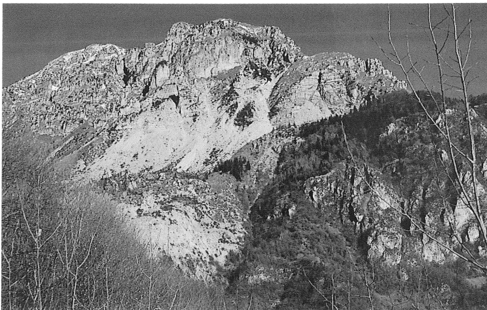
Fig. 6 - M. Tigaldine: la zona di frana.