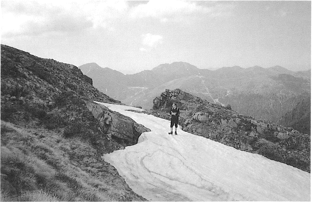
Fig. 9 - M. Bagoligolo: il trench superiore.

trincee superiori presentano uno sviluppo lineare di poco inferiore e una profondità leggermente superiore. L'acclività media del versante in esame è di 55^\circ .