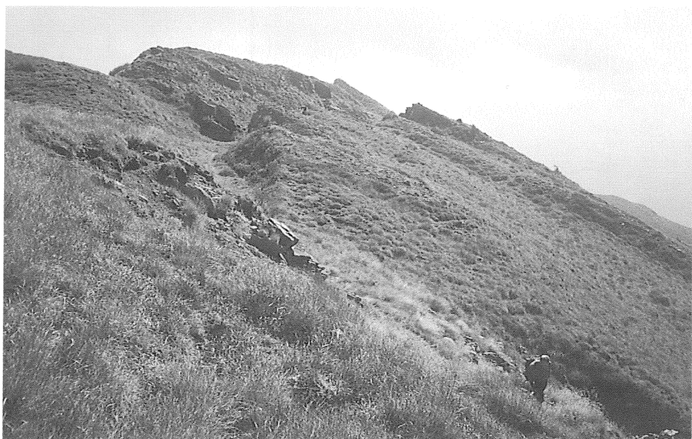
Fig. 8 - M. Bagoligolo: il profilo SE a «dente di sega».