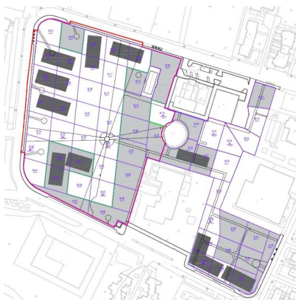
Intervento area ovest