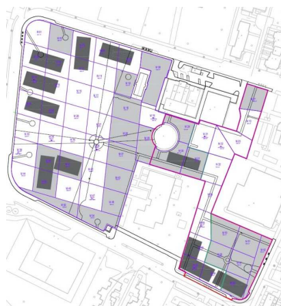
Intervento area est

Il criterio di bonifica dei parchi, adottato dai Progetti Operativi di Bonifica approvati dal Responsabile del Settore Protezione Ambientale e Protezione Civile, è “l’asportazione di terreno con reinterro di terreno idoneo alla destinazione d’uso” .