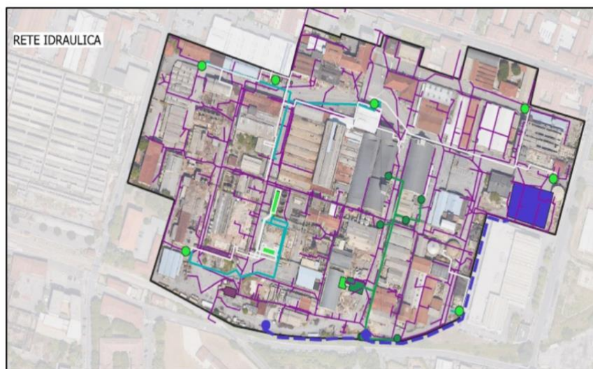
Figura 3: Rete idraulica