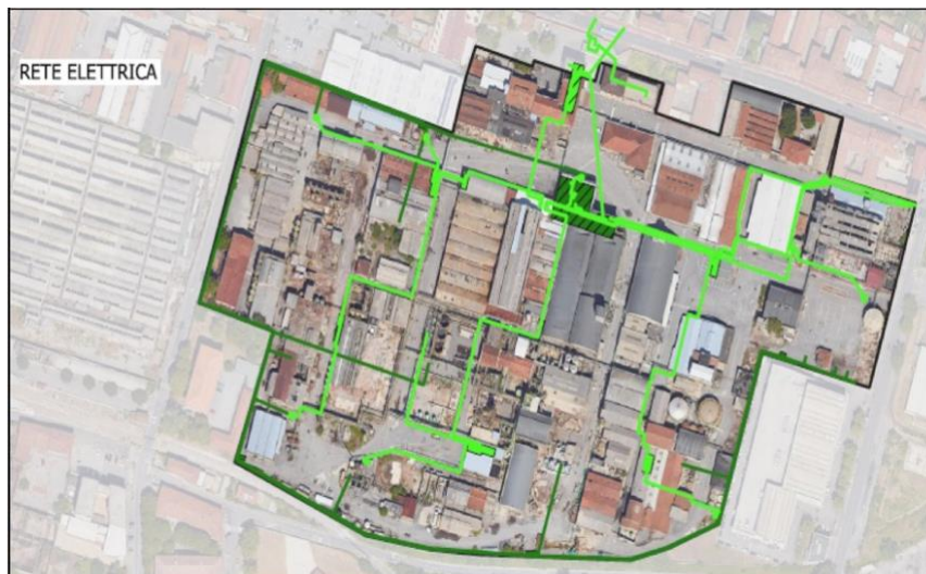
Figura 2: Rete elettrica