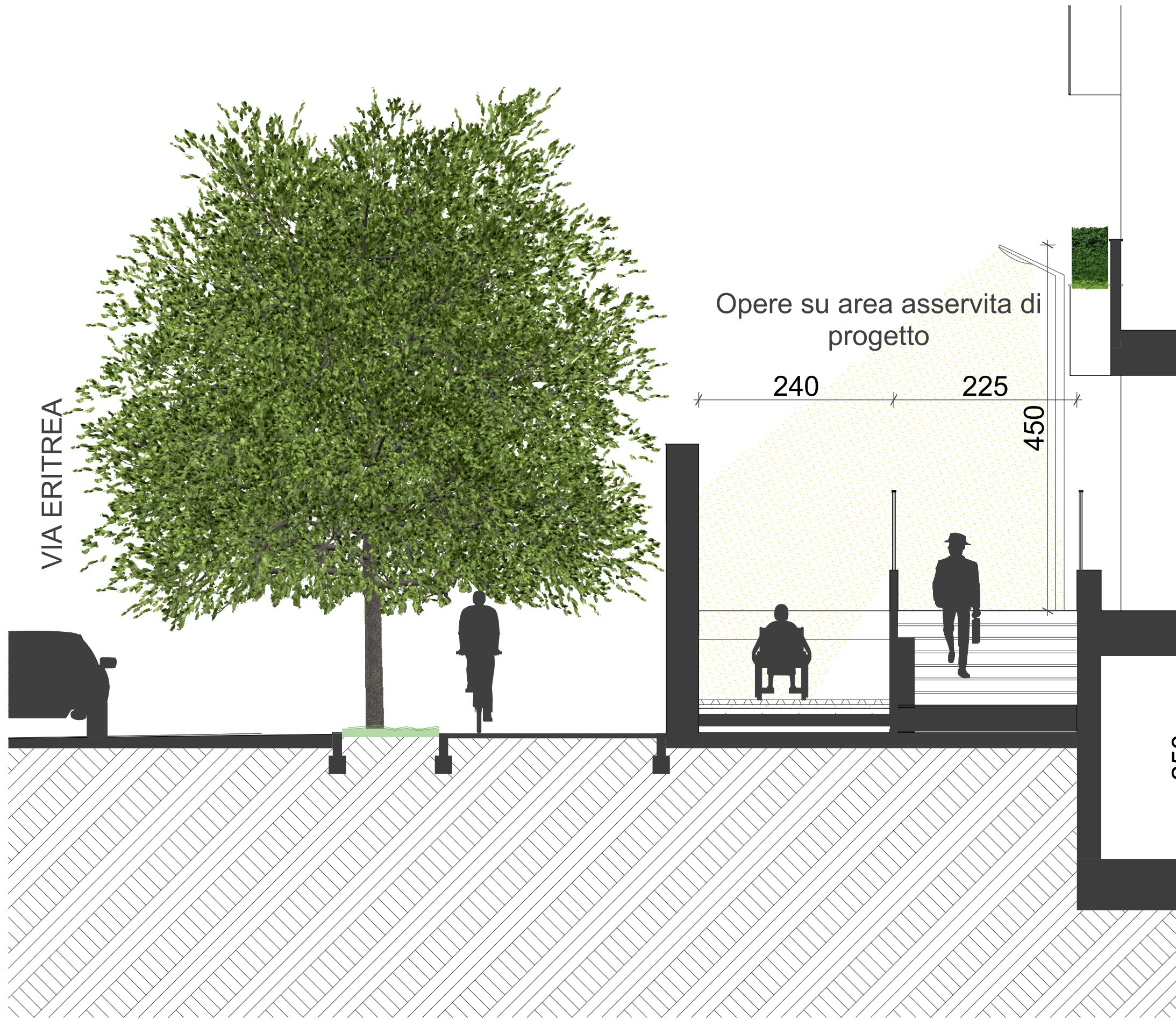
B-B Sezione tipo su scale e rampa ciclopedonale - lotto 9 e 10 Scala 1:50