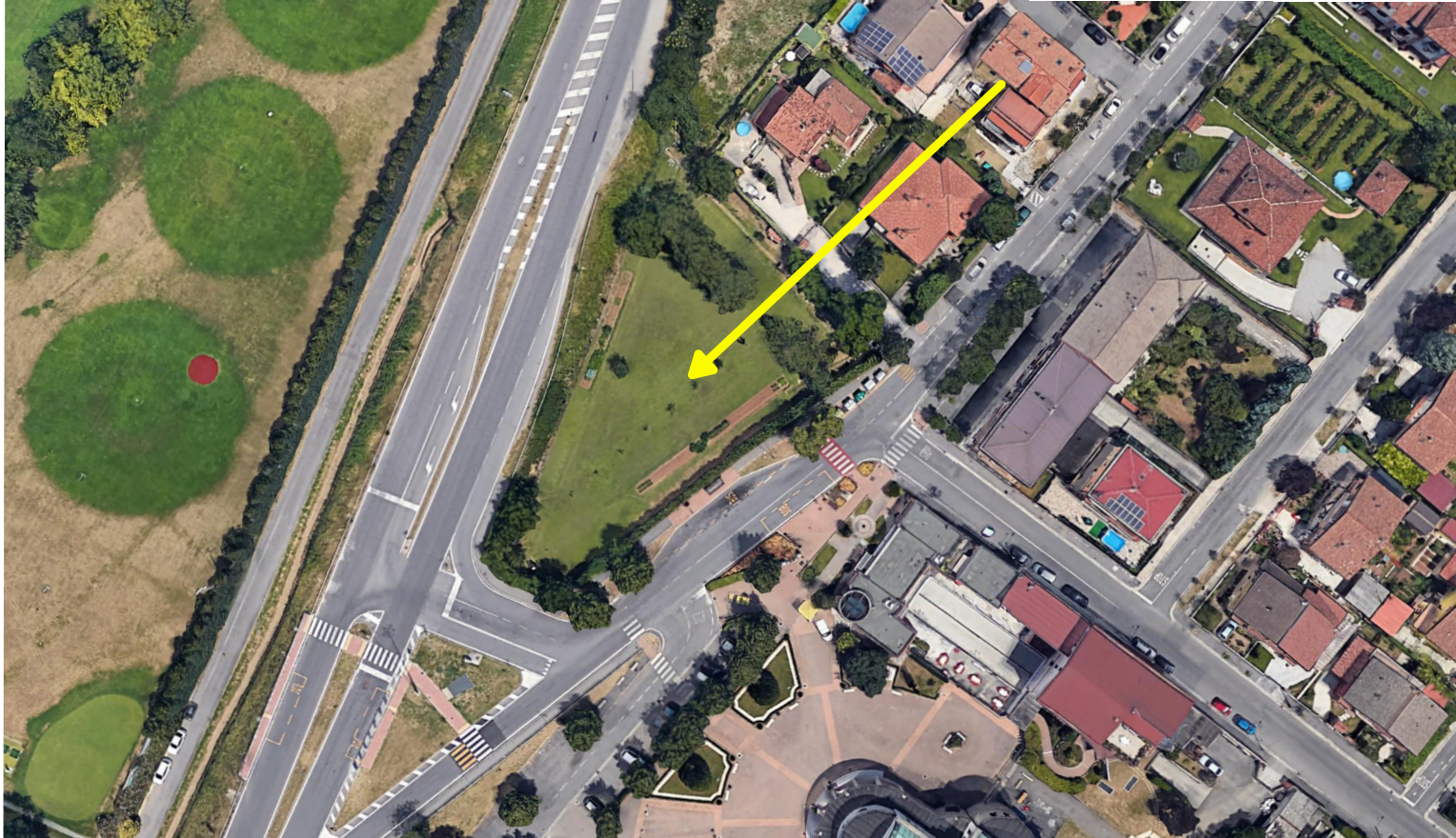
N° 7 - 8 PARCHEGGIO E AREE VERDI VIA BUFFALORA