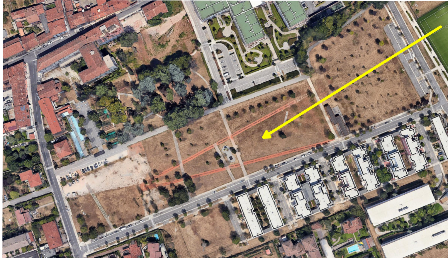
N° 9 - PARCO PEPPINO IMPASTATO