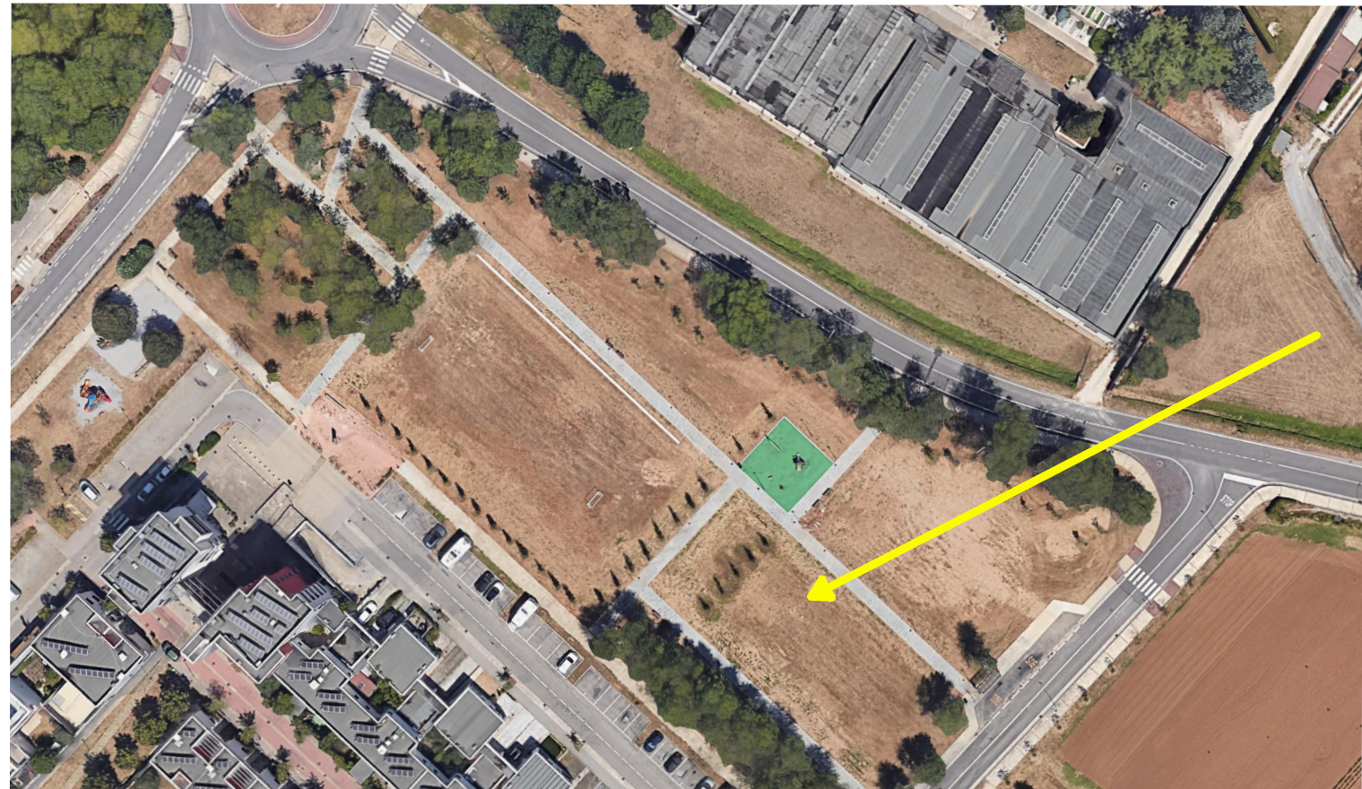
N° 10 - PARCO VIA ALBERTI