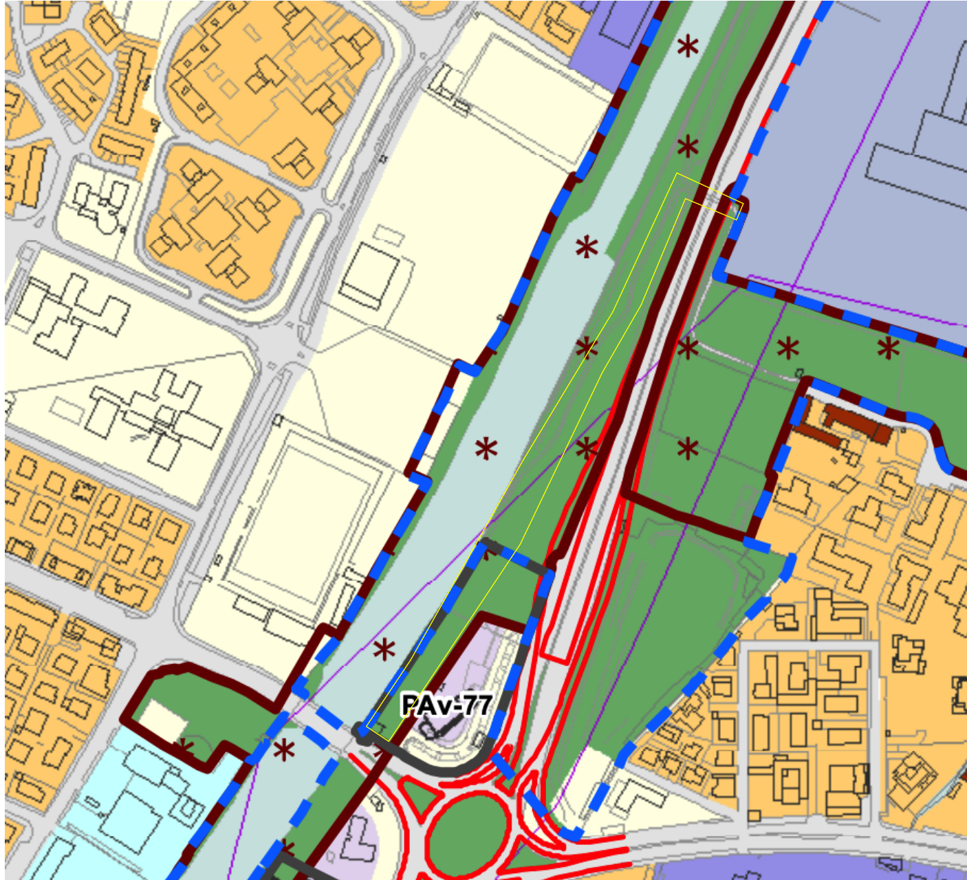
STRALCIO P.D.R. - TRATTO DI INTERVENTO 1

Ampliamento PLIS delle Colline all'ambito agricolo periurbano (NTA art.86)