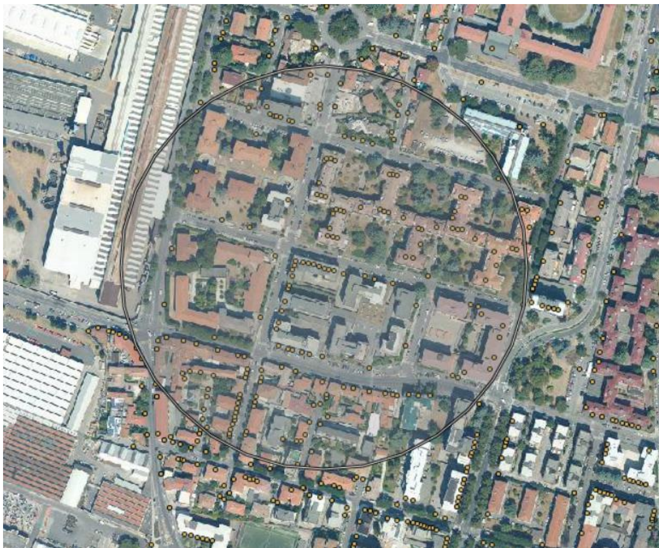
VIA DELLE TOFANE