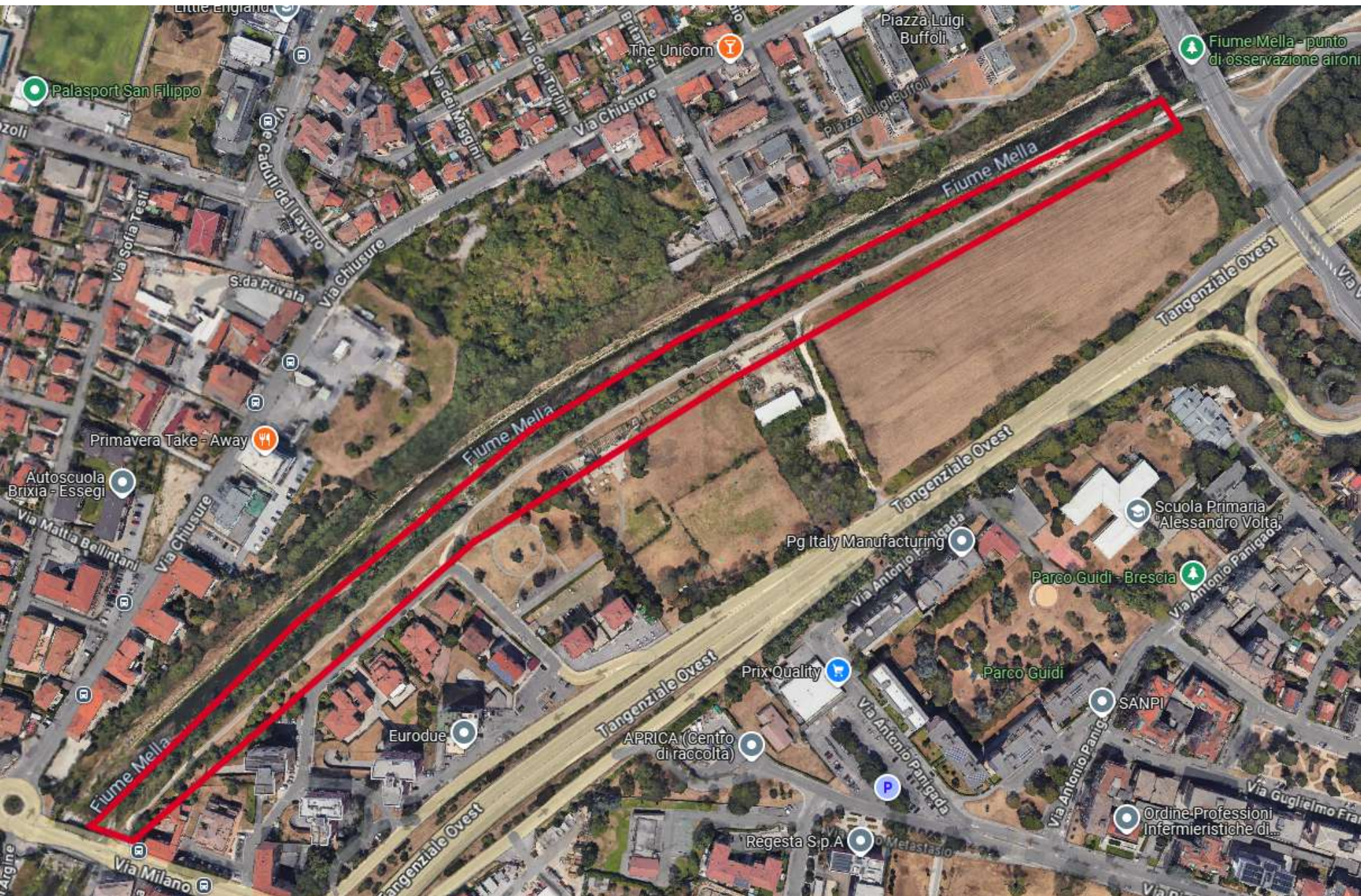
CICLOVIA DEL MELLA - TRATTO DI INTERVENTO 2

Tratto tra via Risorgimento e sottopasso Ori di lunghezza 0,470 Km (adeguamento, pavimentazione e illuminazione)