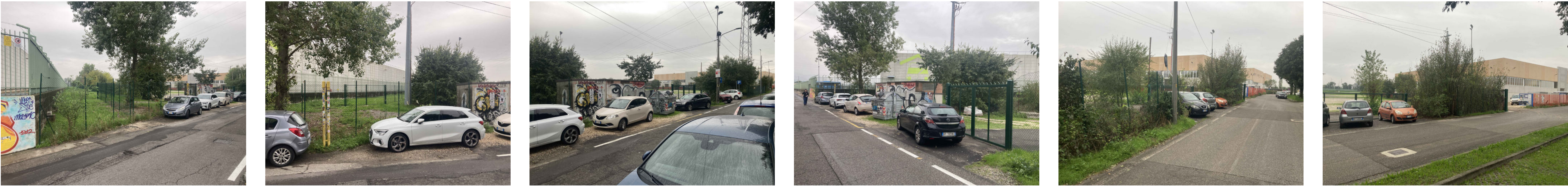
RIPRESE FOTOGRAFICHE DA VIA MAGNOLINI - RECINZIONE E ACCESSI CARRAI