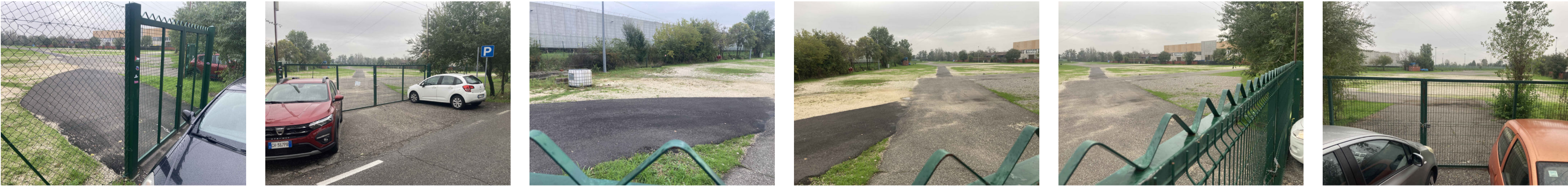
RIPRESE FOTOGRAFICHE DA VIA MAGNOLINI - PAVIMENTAZIONI INTERNE ESISTENTI