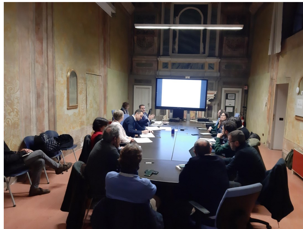
Parco delle Cave