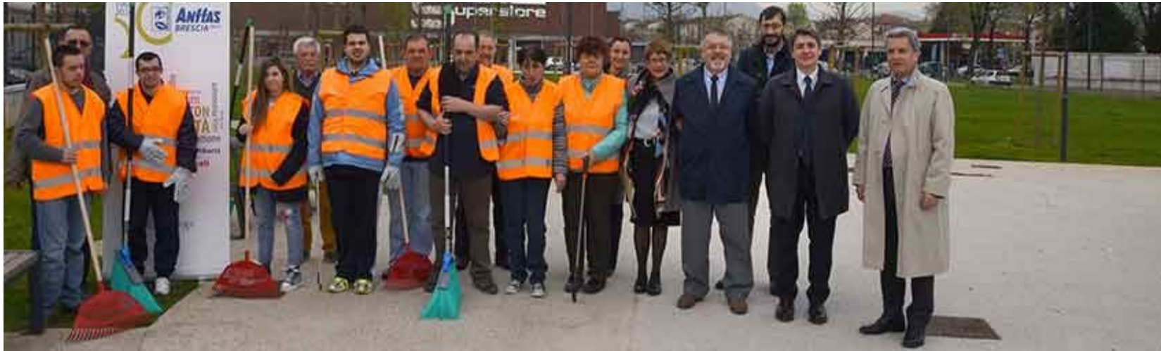
Progetto Manutenzione del parco “La Rosa Blu” di via Nullo Siglato il 18 maggio 2017