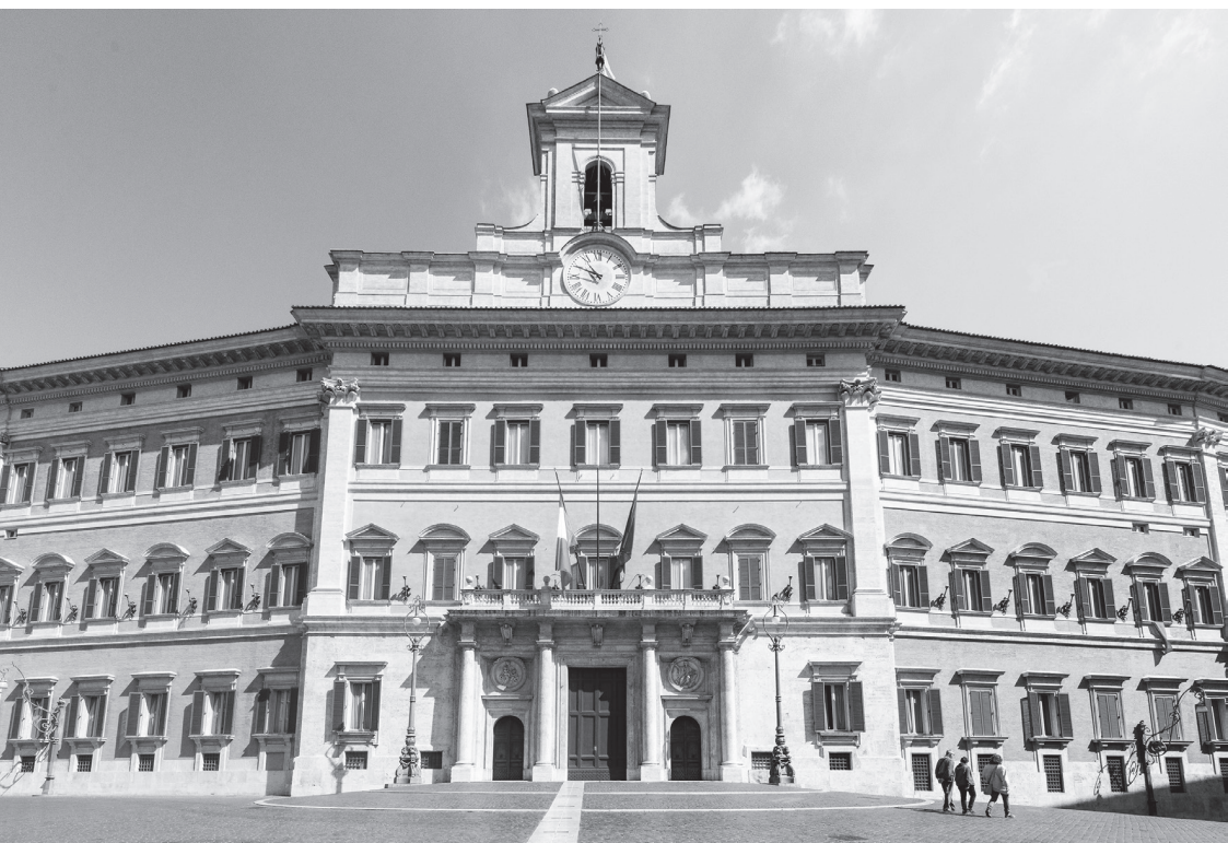
Palazzo Montecitorio, sede della Camera dei Deputati

Nel citato decreto n. 151 del 1944 fu stabilito che l'Assemblea fosse sciolta di diritto il giorno dell'entrata in vigore della nuova Costituzione e comunque non oltre l'ottavo mese dalla sua prima riunione. Detto termine fu prorogato prima al 24 giugno 1947 (L. cost. 21 febbraio 1947, n. 1) e successivamente non oltre il 31 dicembre 1947 (L. cost. 17 giugno 1947, n. 2).