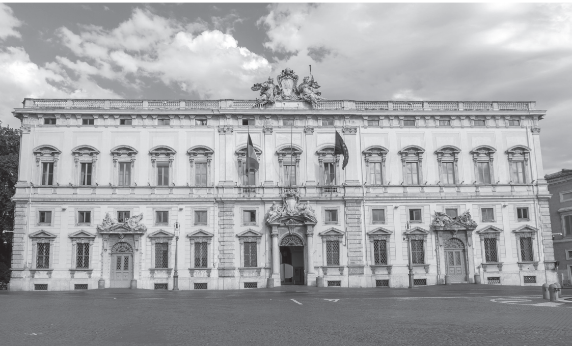
Palazzo della Consulta dal 1955, sede della Corte Costituzionale