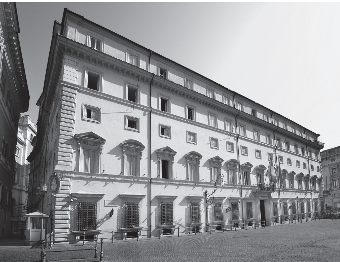
Palazzo Chigi, sede del Governo in carica

La bandiera della Repubblica è il tricolore italiano: verde, bianco e rosso, a tre bande verticali di eguali dimensioni.