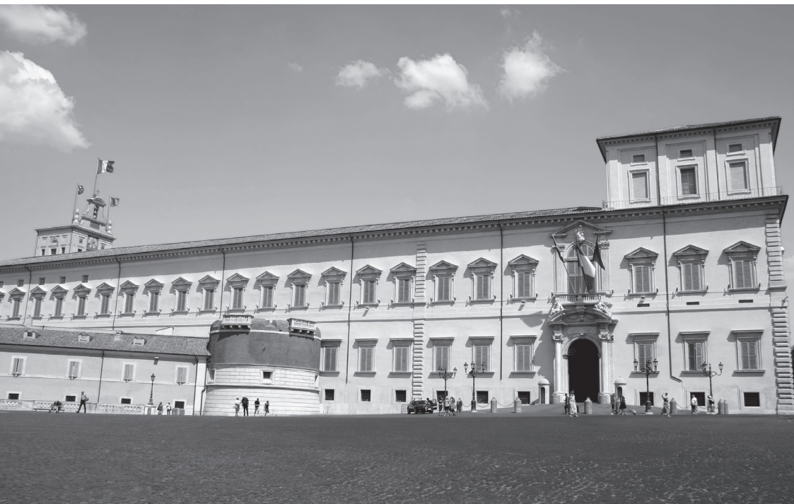
Palazzo Quirinale sede del Presidente della Repubblica

Può concedere grazia e commutare le pene. Conferisce le onorificenze della Repubblica.