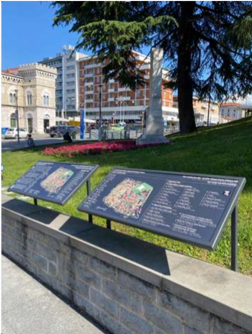
I pannelli P1 e P2 all'inizio di via del Castello