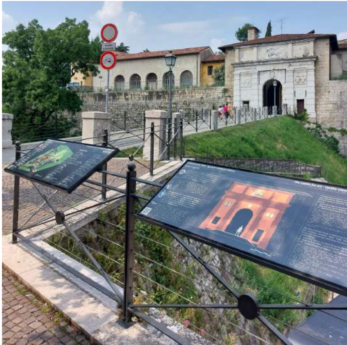
I pannelli P3 e P4 davanti all'ingresso del Castello