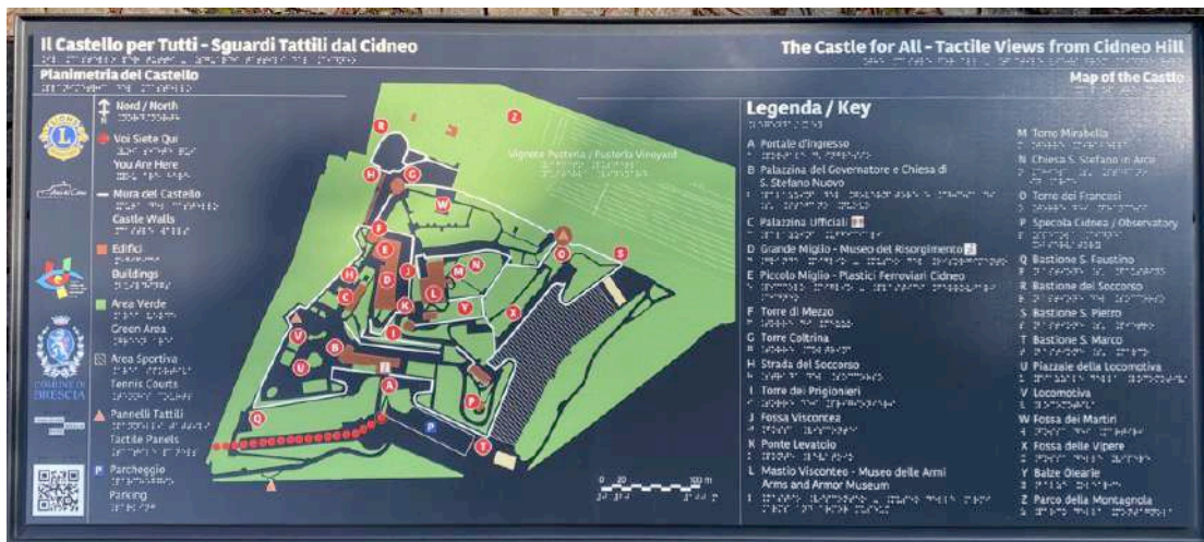
Pannello P3: Planimetria del Castello