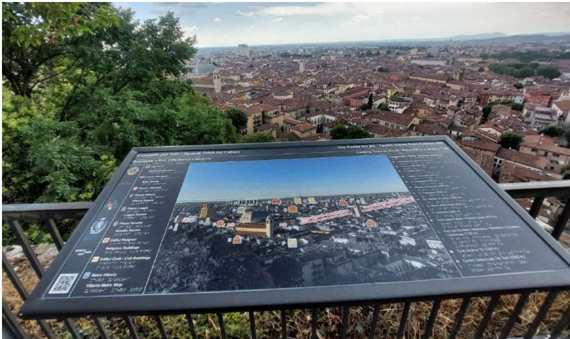
Pannello P5: Guardando a sud: città storica e moderna Collocazione: piazzale della Locomotiva