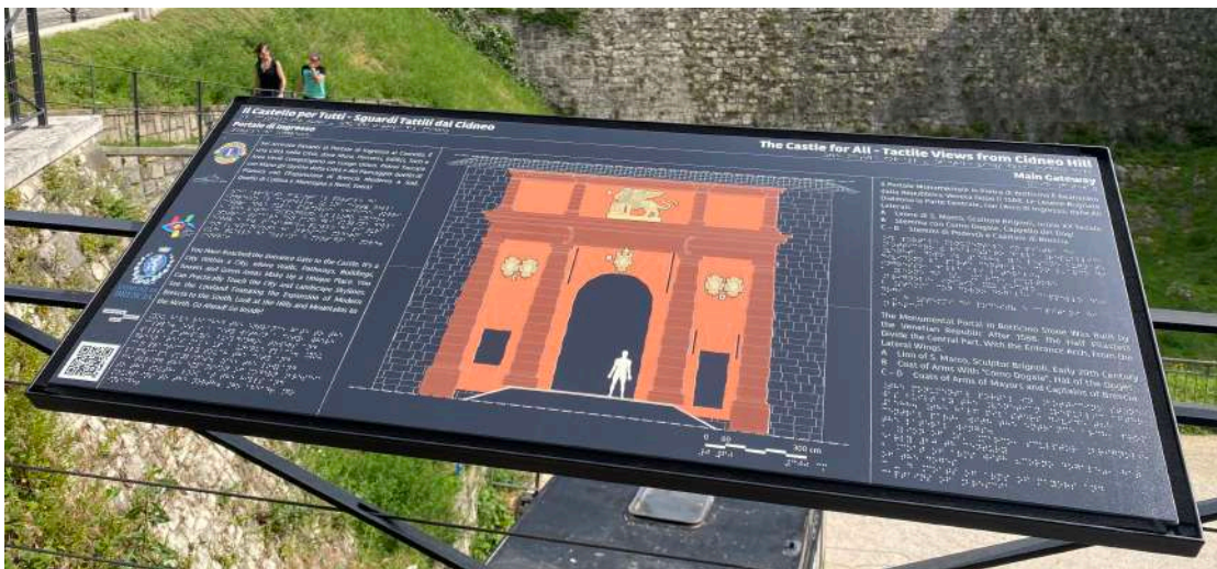
Pannello P4: Portale di ingresso