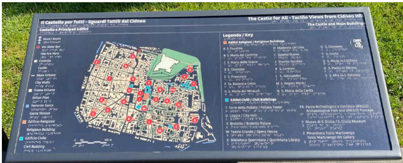
Pannello P2: Castello e principali edifici