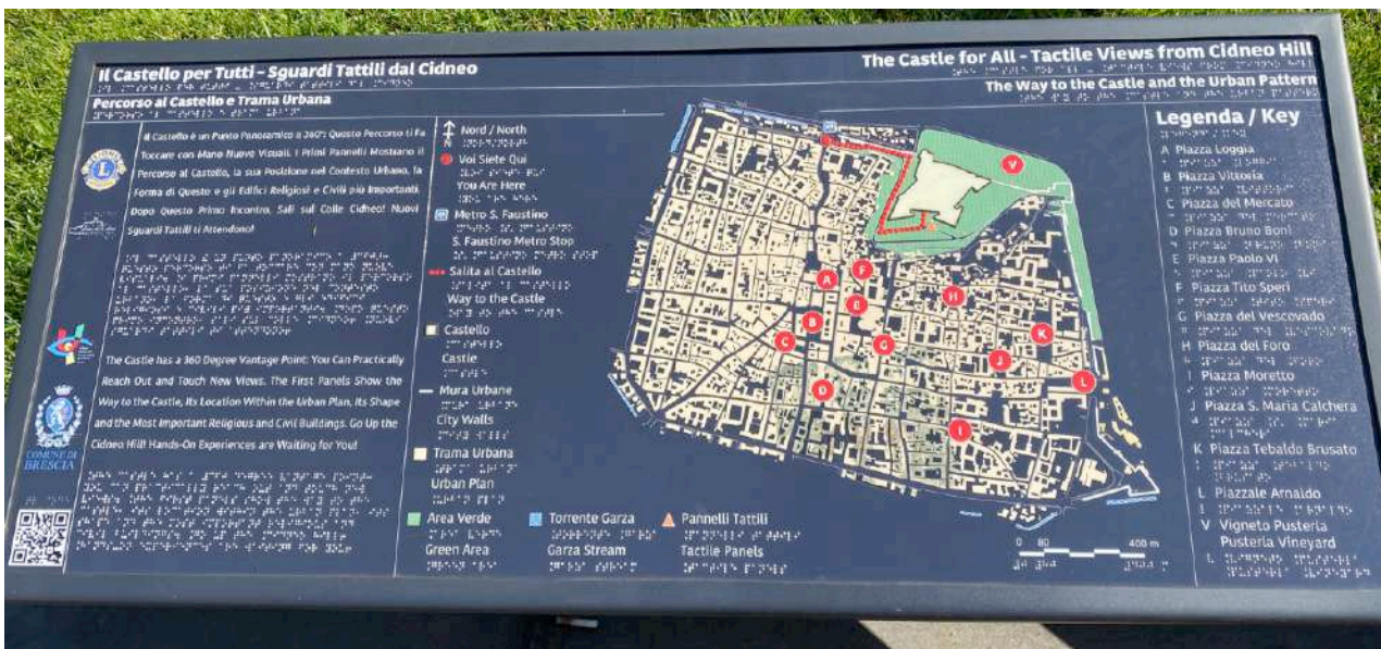
Pannello P1: Percorso al castello e trama urbana