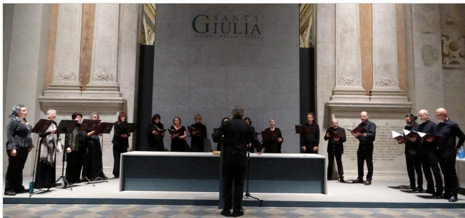
I Cantores nell' Auditorium del Museo di Santa Giulia

Visto il potenziale evocativo che le precedenti edizioni hanno avuto nel dare maestosità con il canto alla Basilica di San Salvatore e al Coro delle Monache , Fondazione Brescia Musei e il Gruppo Vocale "Cantores Silentii" hanno intrapreso un nuovo percorso rinnovando il format e invadere altri spazi museali cittadini. La Rassegna di quest'anno si terrà nell' Auditorium di Santa Giulia (la chiesa cinquecentesca che ha ospitato il Museo dell'Età cristiana), ora Sala monumentale adibita agli eventi.