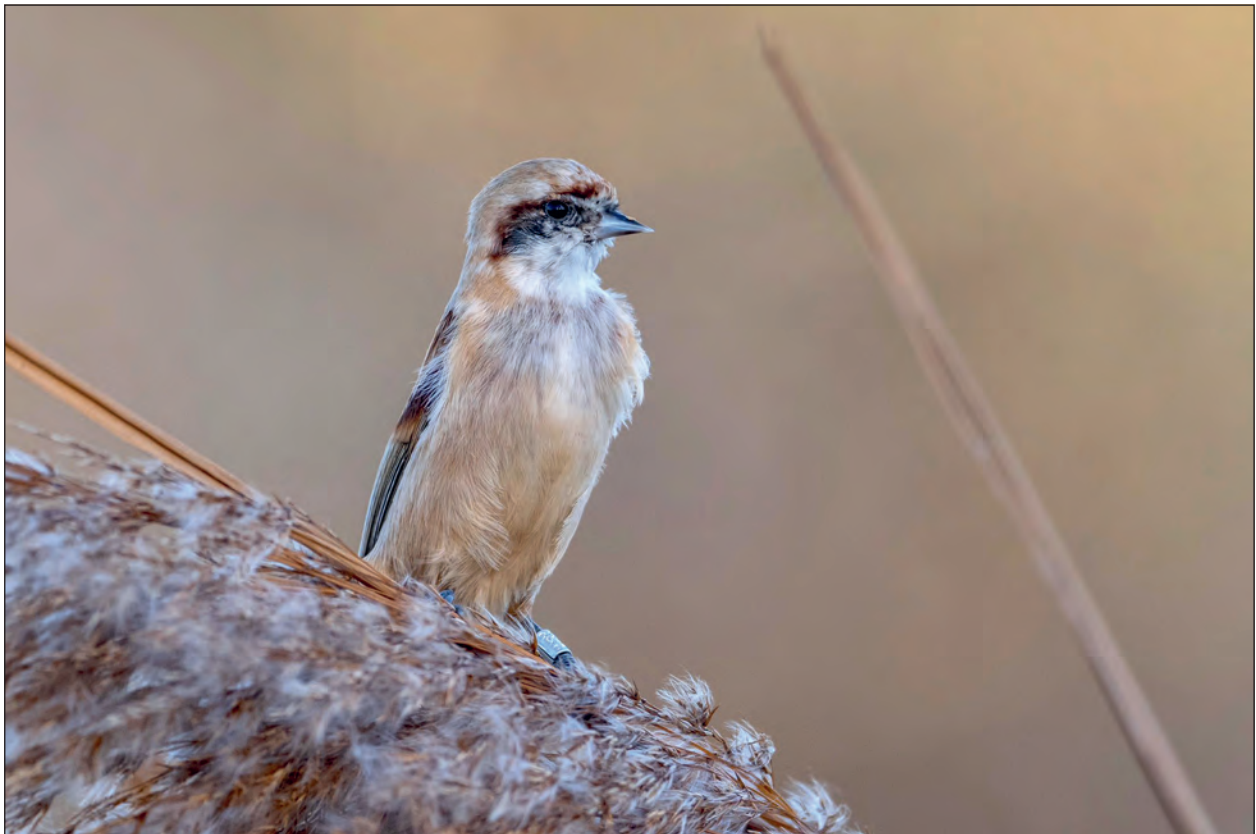
Fig. 5 – Pendolino Remiz pendulinus . Giovane inanellato in Polonia, ripreso a Sirmione a settembre.

Un individuo presente dal 24 al 27 febbraio presso il biotopo Palude di Luna, Borgo San Giacomo. Appurato il contatto in loco anche nel periodo aprile - ottobre 2021 (P. Zucca). Sempre più regolare la presenza di questa specie nei settori di pianura.