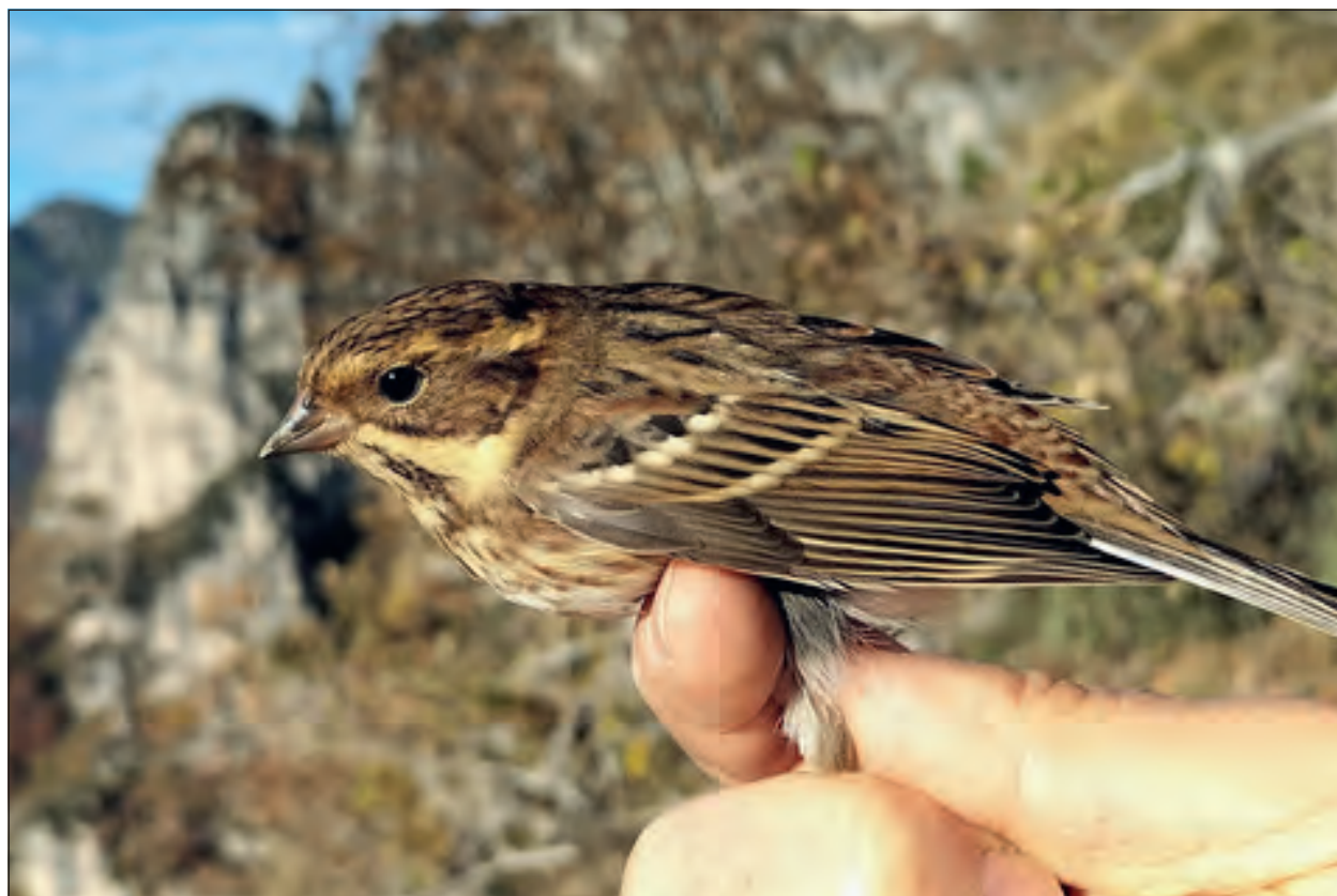
Fig. 7 – Zigolo boschereccio Emberiza rustica . Individuo inanellato il 12 ottobre nella stazione di inanellamento del Passo della Berga, Bagolino.

Un individuo di origine aufuga osservato il 21 agosto nelle "lamette" della R. N. Torbiere del Sebino (G. Simonini, R. Picozzi).