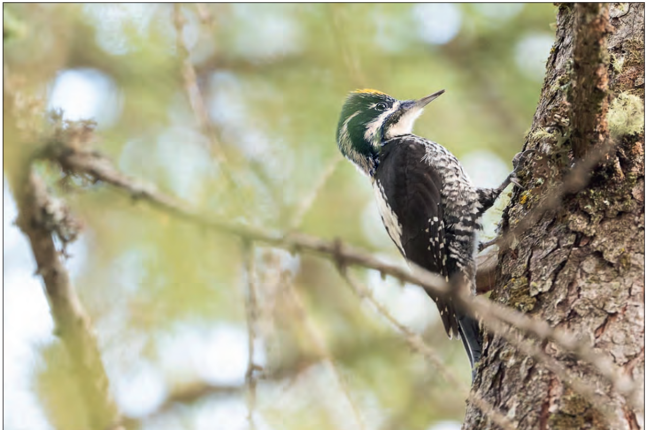
Fig. 3 - Picchio tridattilo Picoides tridactylus . Maschio fotografato il 29 settembre 2022 a Pezzo di Ponte di Legno.