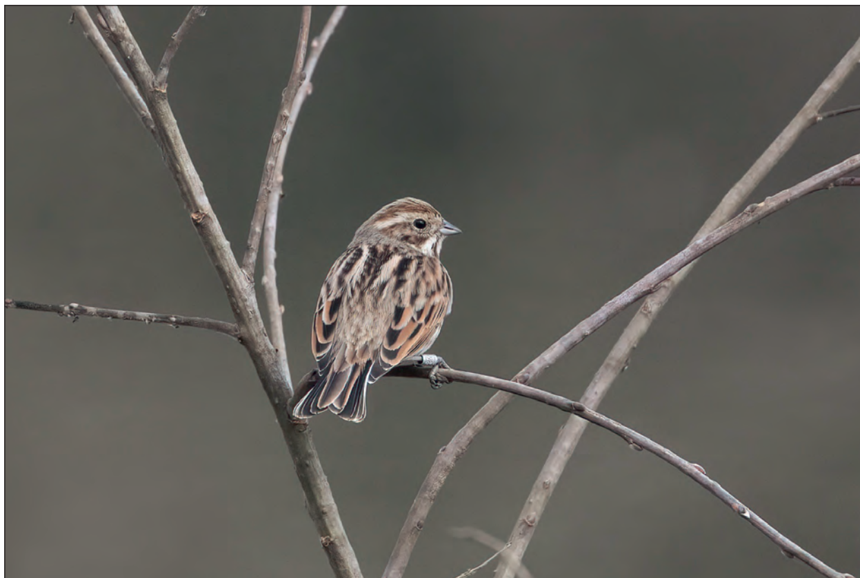
Fig. 8 – Migliarino di palude Emberiza schoeniclus . Individuo norvegese con anello metallico osservato dal 6 al 23 marzo nel biotopo Palude di Luna.