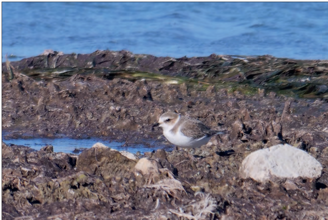
Fig. 1 – Frattino Charadrius alexandrinus . Fotografato il 1° ottobre a Punta Grò, Lugana di Sirmione.