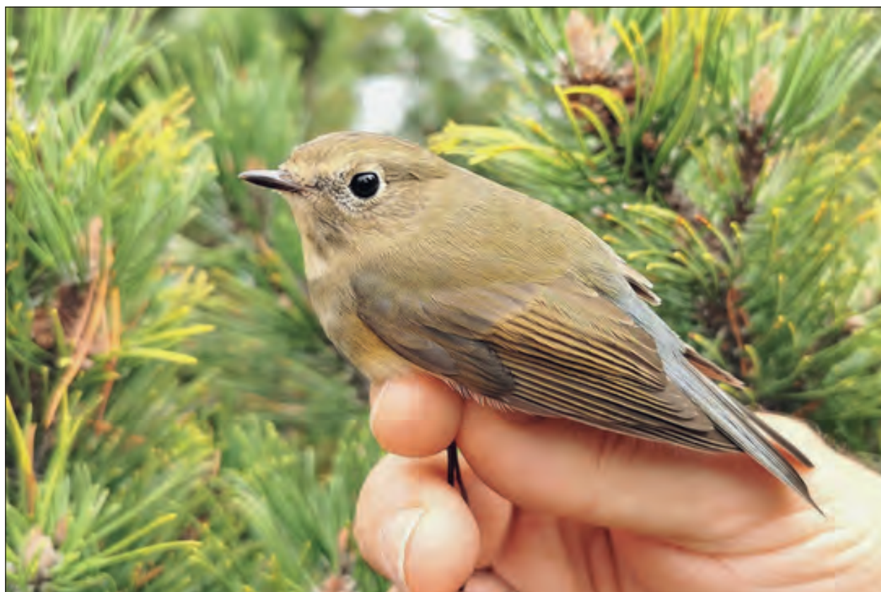
Fig. 6 – Codazzurro Tarsiger cyanurus . Individuo inanellato il 1° ottobre nella stazione di inanellamento del Passo della Berga, Bagolino.

Due individui osservati il 10 giugno e 4 (di cui un