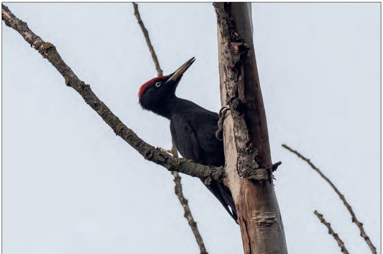
Fig. 4 – Picchio nero Dryocopus martius . Maschio adulto presente nel Parco Oglio Nord da febbraio a dicembre.