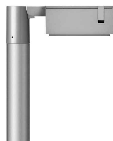
Dettaglio lampione Modello uguale a quello già utilizzato per il percorso pedonale esistente