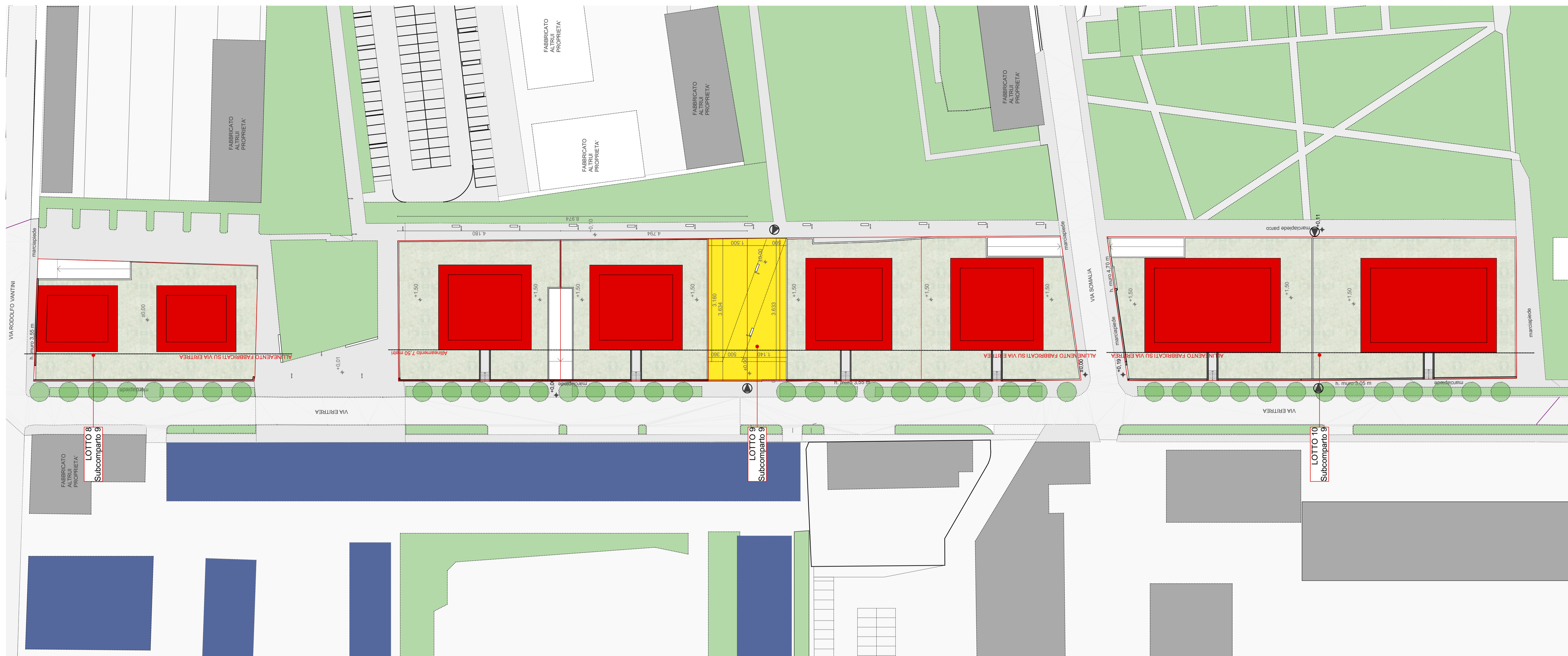
Planimetria progetto Scala 1:500