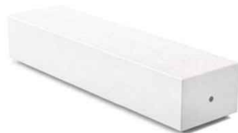
Dettaglio panca Modello uguale a quello già utilizzato per il percorso pedonale esistente