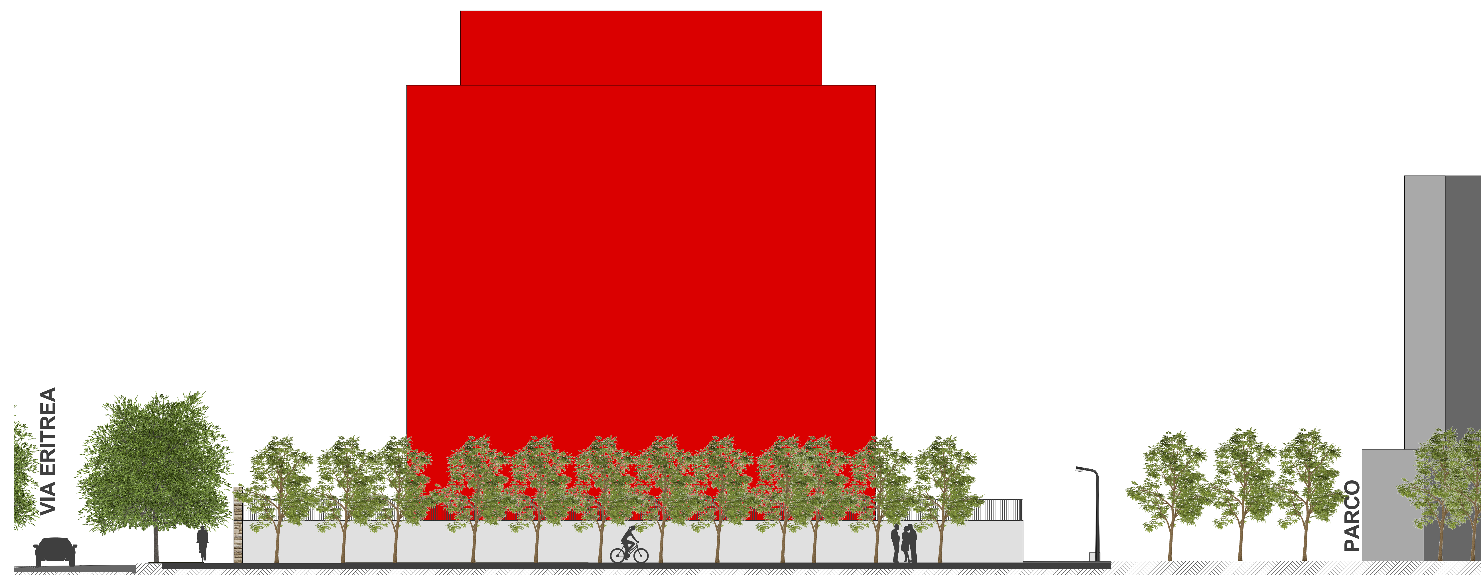
Dettaglio PIAZZA - Lotto 9 - Sezione A-A Scala 1:100