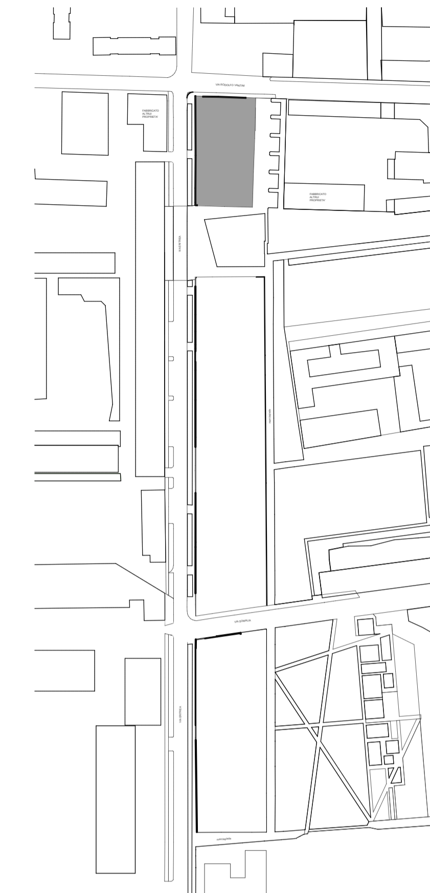
Key map: Individuazione lotti Scala 1:2000