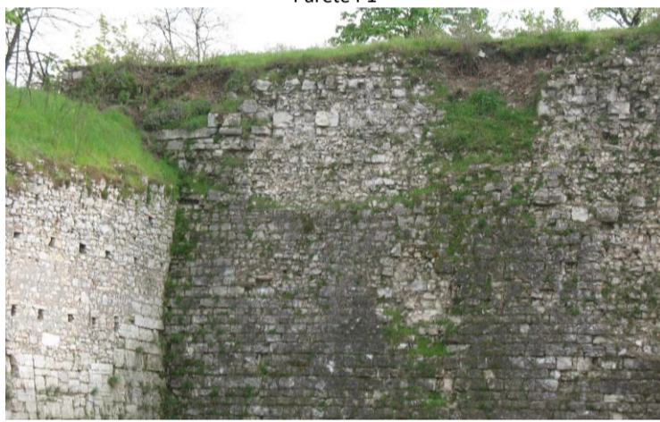
Parete P1 a destra e parete P2 a sinistra