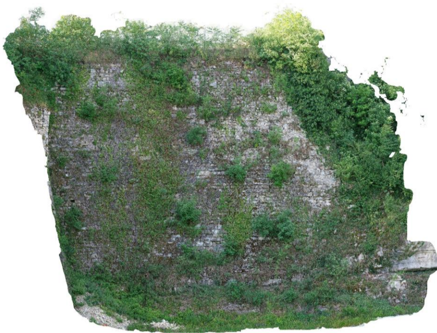
Ortofotopiano P1 - anno 2022