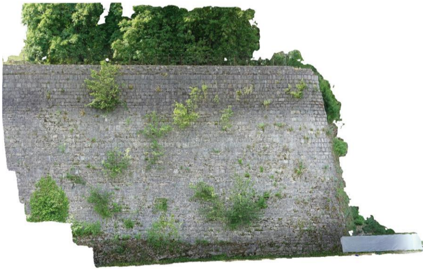
Ortofotopiano P3 - anno 2022