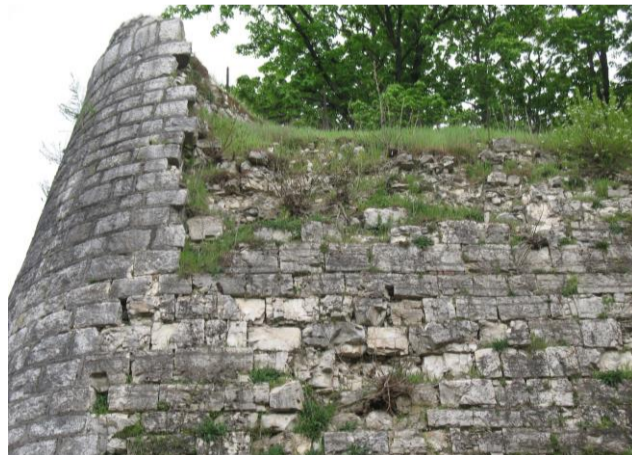
Parete P2 all'angolo con parete P3