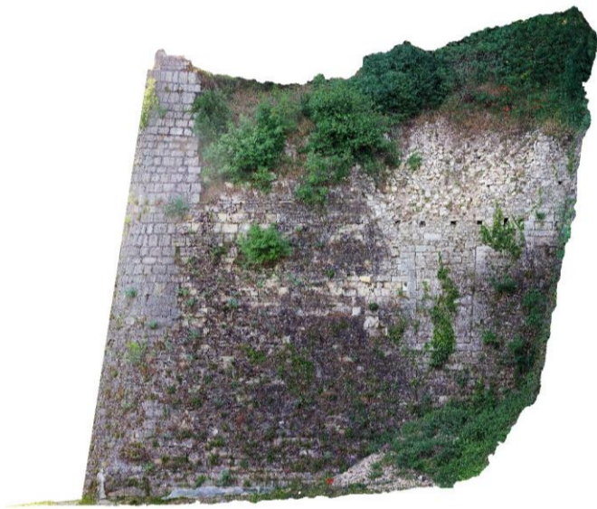
Ortofotopiano P2 - anno 2022