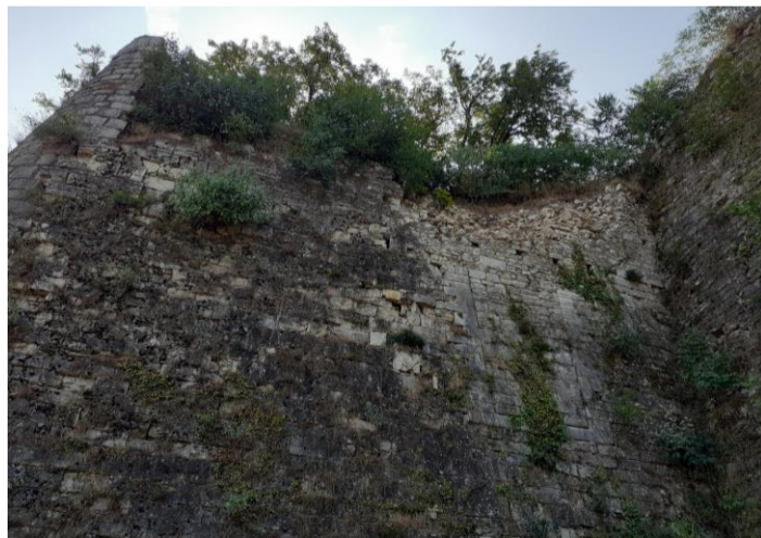
Anno 2022 - P2