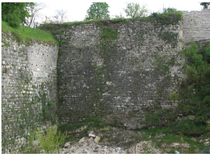
Parete P1 a destra e parete P2 a sinistra