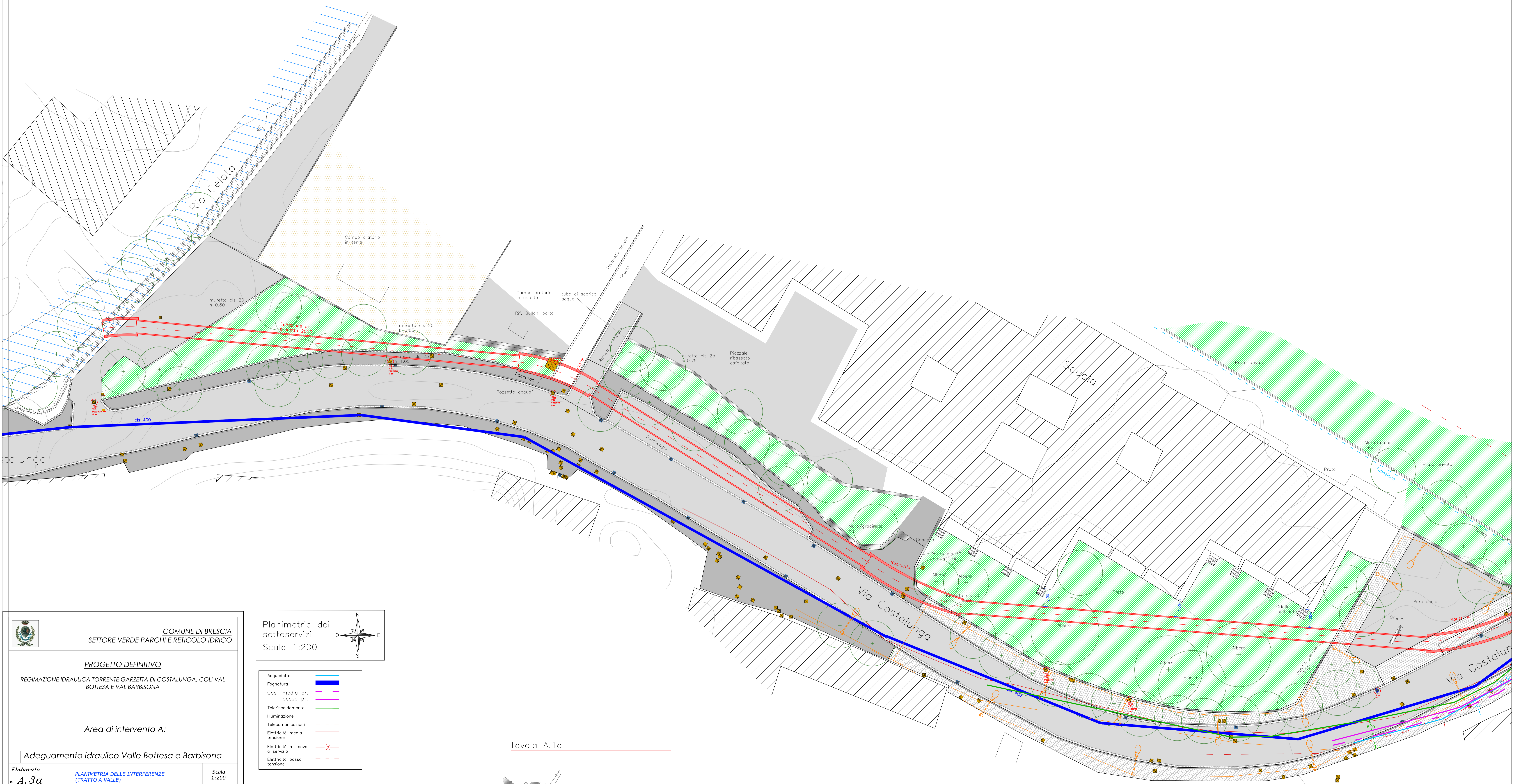
Planimetria dei sottoservizi Scala 1:200