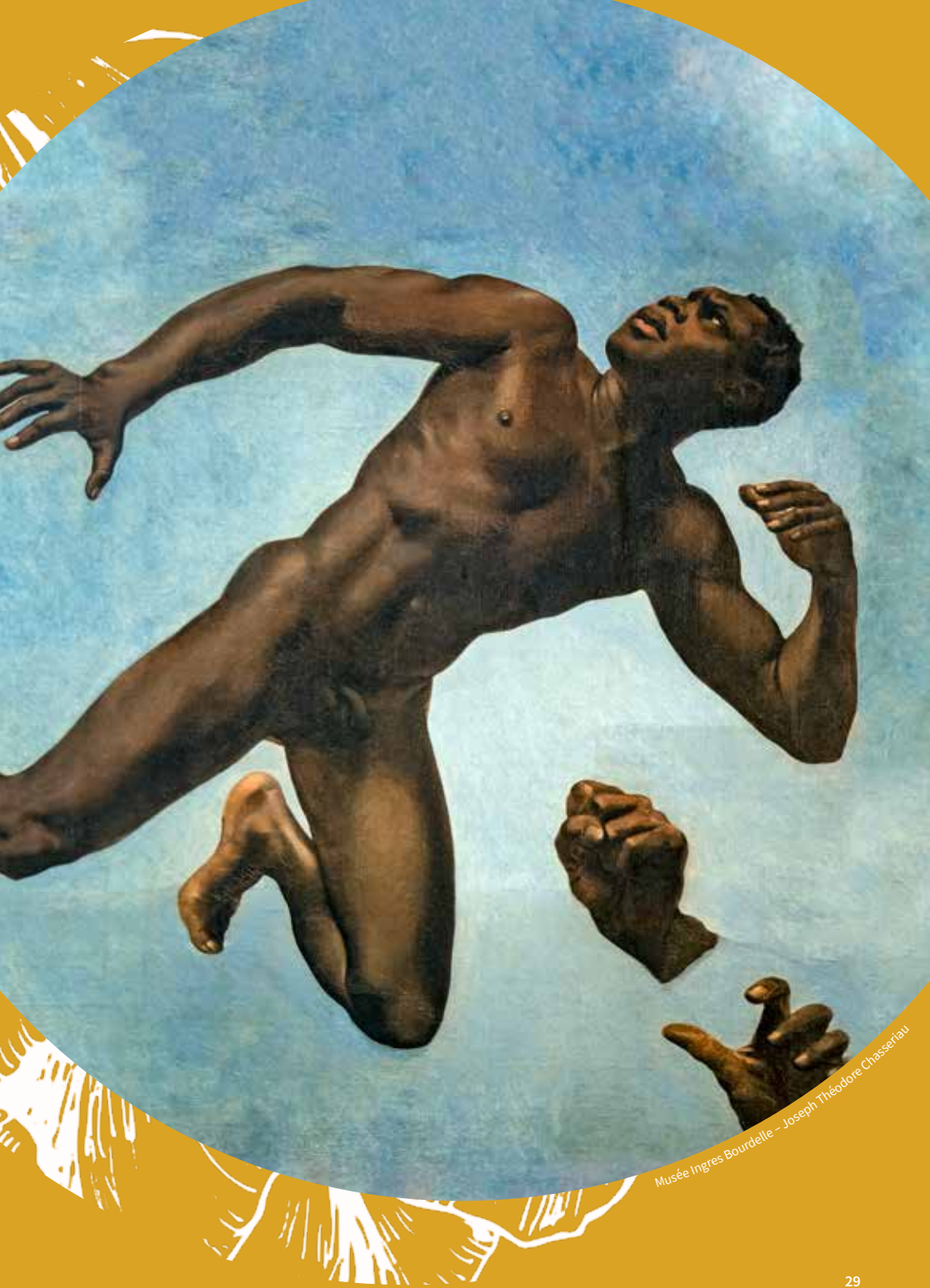
Musée Ingres Bourdelle – Joseph Théodore Chasseriau