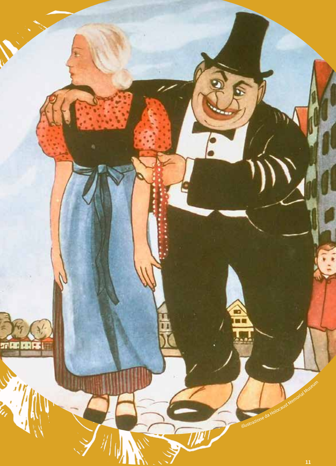
Illustrazione da Holocaust Memorial Museum