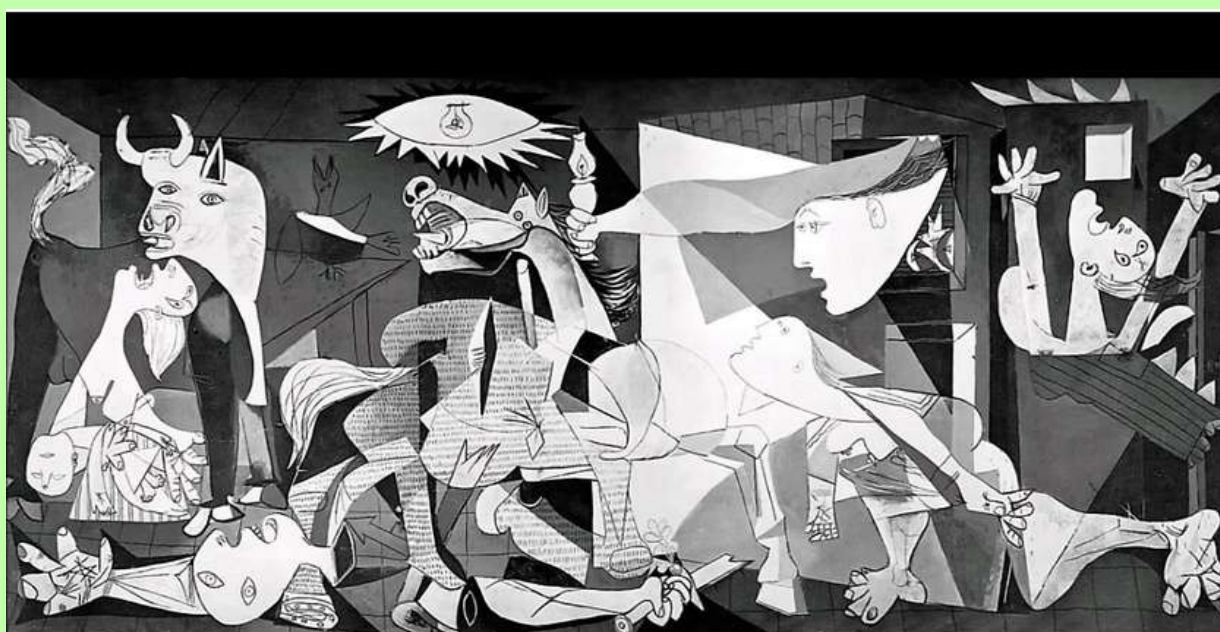
Pablo Picasso, Guernica, 1937. Olio su tela, Museo nacional centro de arte reina Sofia.

Abbiamo associato l'articolo a Guernica di Picasso, ricordandoci l'eccessivo e insensato dolore che i conflitti armati portano a coloro che si ritrovano in mezzo.