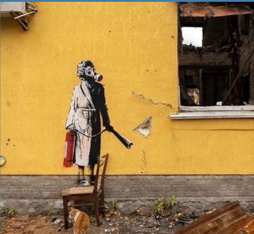
Banksy, Donna in maschera antigas, 2022. Stencil, Horenska (UKR).

"LA REPUBBLICA RICONOSCE E GARANTISCE I DIRITTI INVIOLABILI DELL'UOMO SIA COME SINGOLO SIA NELLE FORMAZIONI SOCIALI OVE SI SVOLGE LA SUA PERSONALITÀ, E RICHIEDE L'ADEMPIMENTO DEI DOVERI INDEROGABILI SOLIDARIETÀ POLITICA, ECONOMICA E SOCIALE."