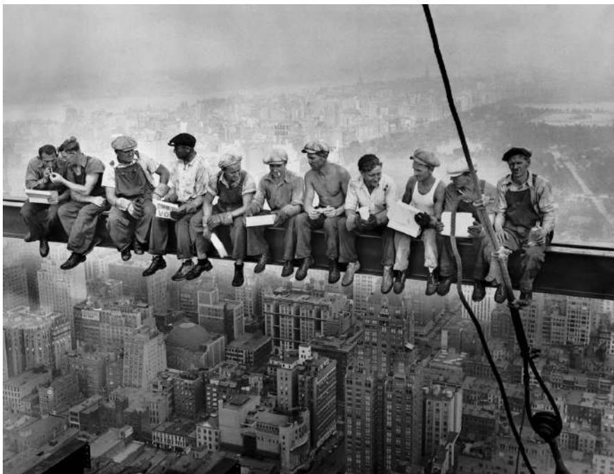
Charles C. Ebbets, Lunch atop a skyscraper, 1932.

"LA REPUBBLICA RICONOSCE A TUTTI I CITTADINI IL DIRITTO AL LAVORO E PROMUOVE LE CONDIZIONI CHE RENDANO EFFETTIVO QUESTO DIRITTO. OGNI CITTADINO HA IL DOVERE DI SVOLGERE, SECONDO LE PROPRIE POSSIBILITÀ E LA PROPRIA SCELTA, UN'ATTIVITÀ O UNA FUNZIONE CHE CONCORRA AL PROGRESSO MATERIALE O SPIRITUALE DELLA SOCIETÀ."