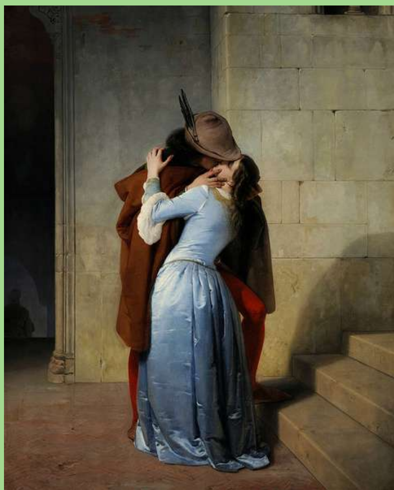
Francesco Hayez, Il bacio, 1859. Olio su tela, Pinacoteca di Brera.

"LA BANDIERA DELLA REPUBBLICA È IL TRICOLORE ITALIANO: VERDE, BIANCO E ROSSO A BANDE VERTICALI DI EGUALI DIMENSIONI."