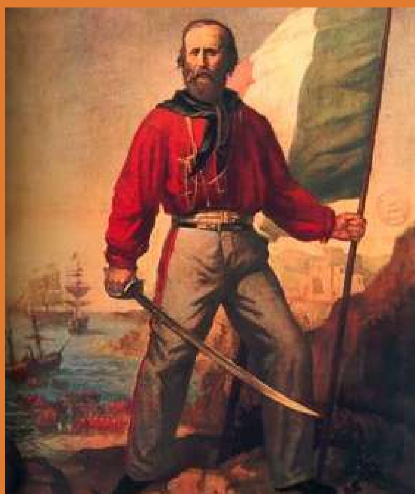
Gerolamo Induno, Garibaldi a Marsala, 1861. Museo del risorgimento di Torino.

Leggendo questo articolo abbiamo pensato subito all'unità d'Italia e ad uno dei volti più importanti: Giuseppe Garibaldi, che nel 1860 sbarcò a Marsala, in Sicilia, a capo di mille uomini e riuscì ad unire il Nord Italia con il Sud Italia.