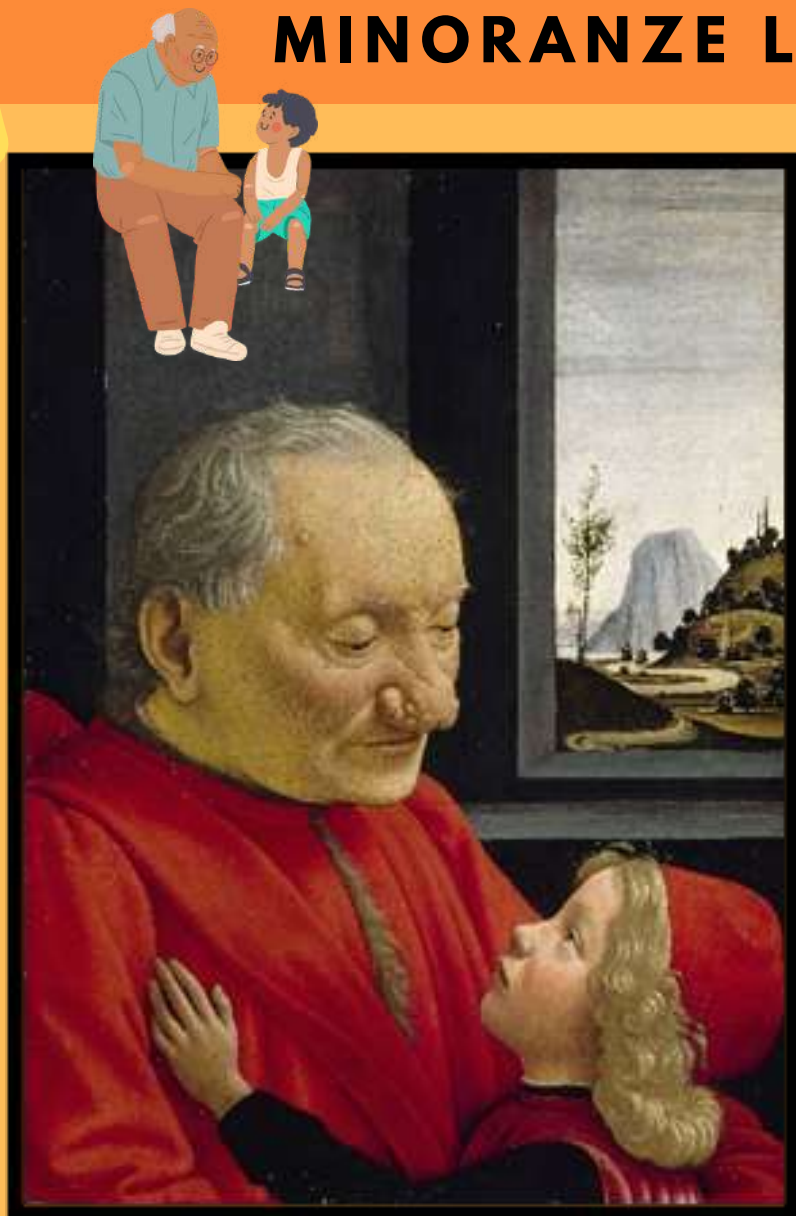
Ghirlandaio, Ritratto di vecchio con nipote, 1490. Tempera su tavola, Museo del Louvre.

"LA REPUBBLICA TUTELA CON APPOSITE NORME LE MINORANZE LINGUISTICHE."