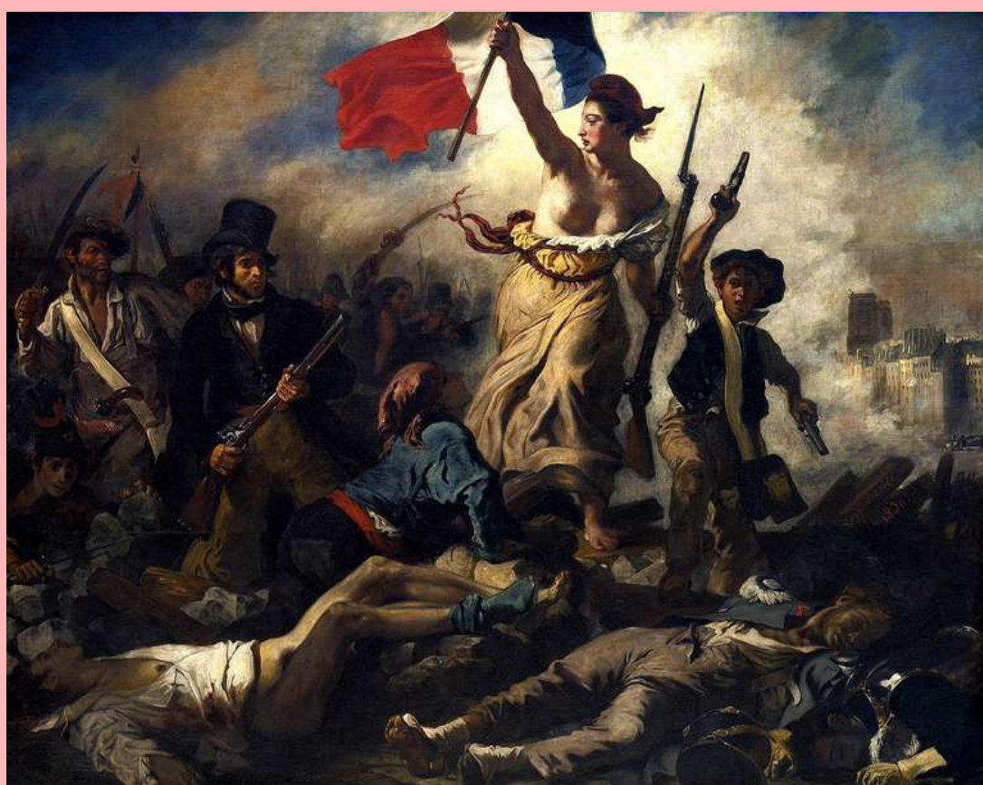
Eugène Delacroix, La Liberté guidant le peuple, 1830. Olio su tela, Museo del Louvre.

Abbiamo collegato l'articolo all'opera "La libertà che guida il popolo" perchè nessun diritto in quanto tale deve essere dato per scontato, ricollegandoci anche agli ideali di libertà e uguaglianza presenti nell'articolo 1 della dichiarazione dei diritti dell'uomo e del cittadino col famoso motto: "Liberté, Égalité, Fraternité"