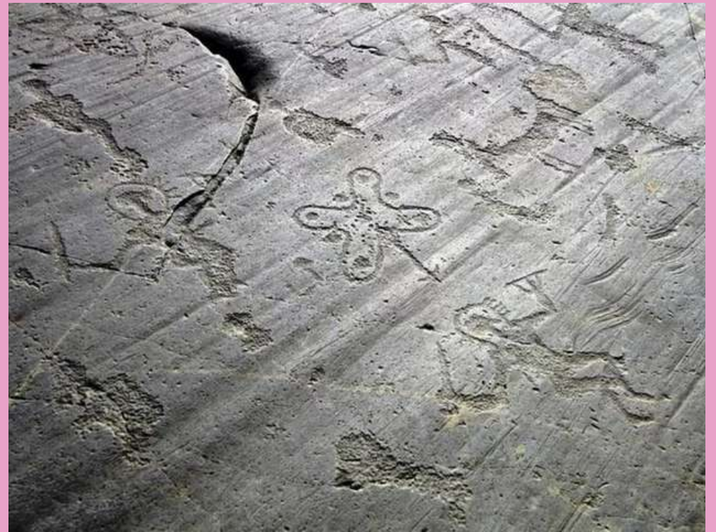
Parco nazionale delle incisioni rupestri di Nacquane.

Queste parole ci fanno pensare in primis all'arte nel nostro territorio. In Val Camonica ci sono vari esempi di arte che ci portano a ripercorrere la storia delle nostre origini.