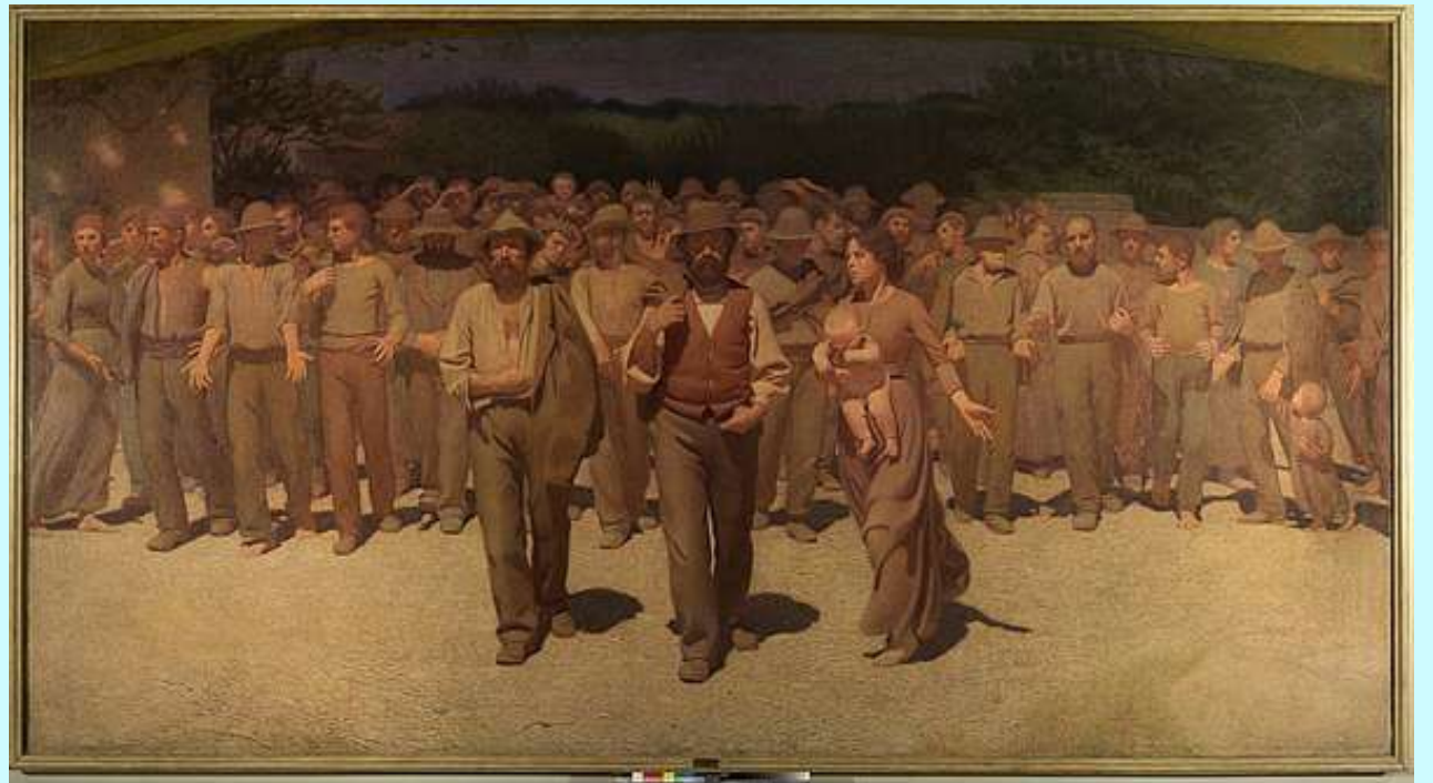
Giuseppe Pellizza da Volpedo, Quarto stato, 1901. Olio su tela, Galleria d'arte moderna di Milano.

Abbiamo collegato questo articolo al Quarto Stato, un dipinto in cui dei lavoratori scioperano per ottenere i loro diritti. Questo dipinto rappresenta la sovranità del popolo legata al lavoro.