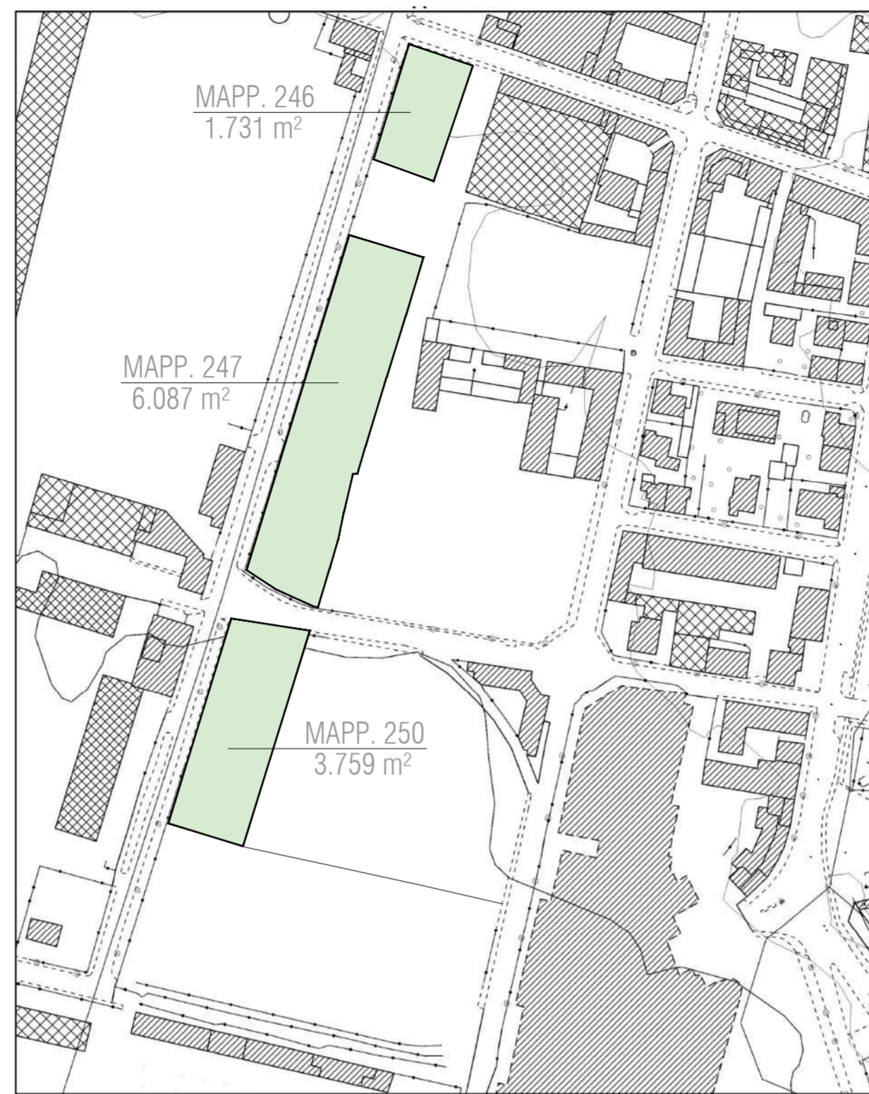
Aerofotogrammetrico 60m 1:2.000