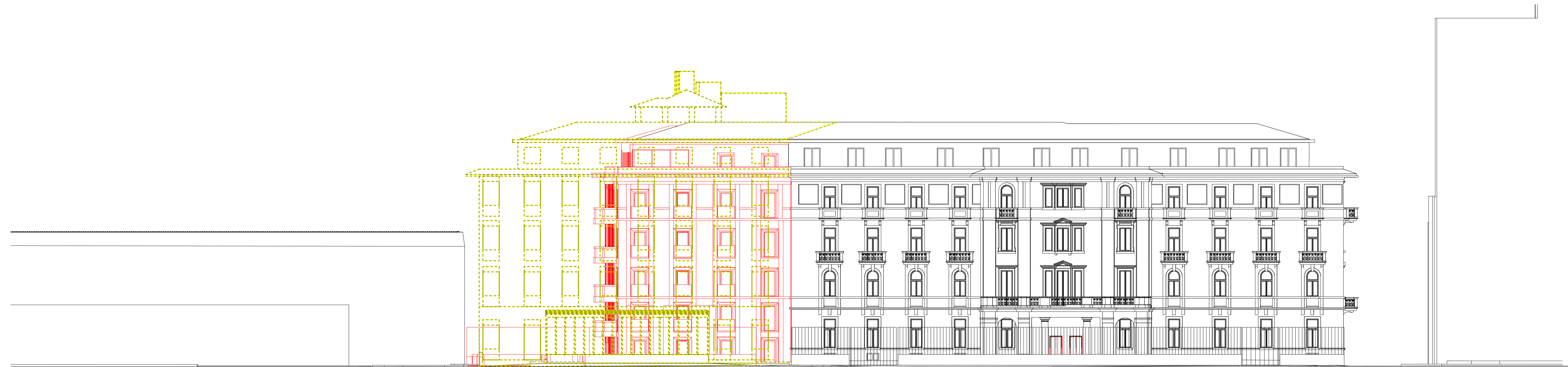
PROSPETTO EST - CONTRADA CAVALLETTO