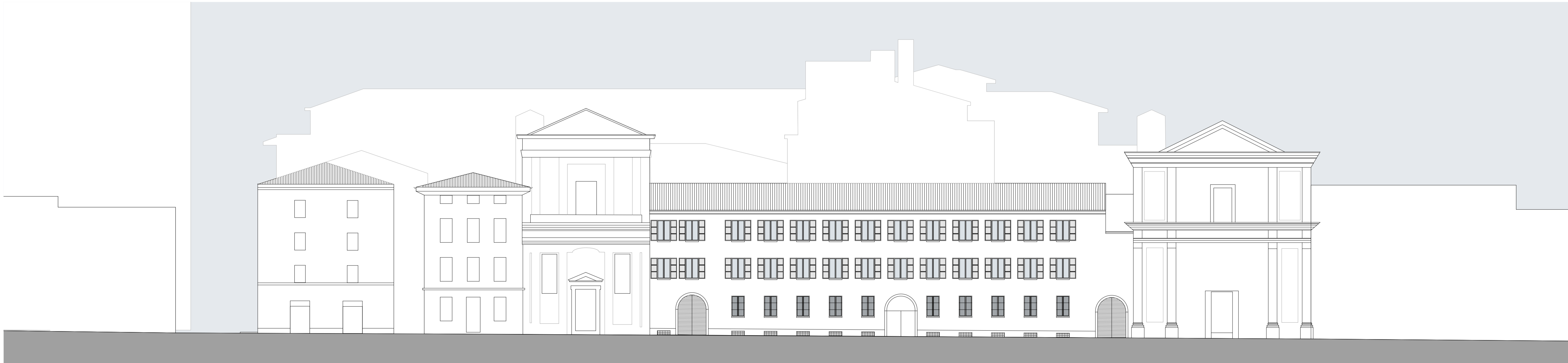
PROSPETTO NORD - VIA MORETTO

COMMITTENTE ORDINE OSPEDALIERO DI S. GIOVANNI DI DIO - FATEBENEFRATELLI CERNUSCO SUL NAVIGLIO (MI)