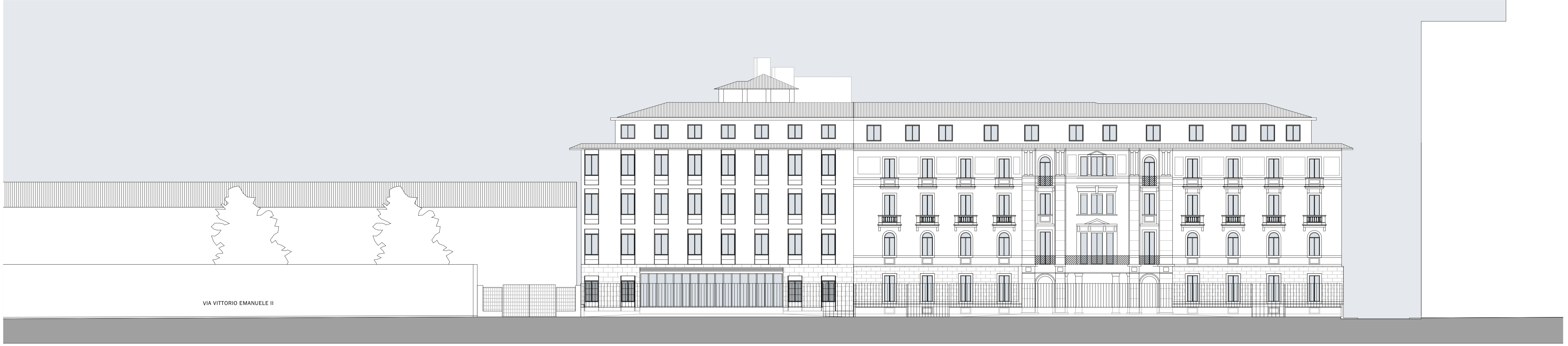
PROSPETTO SUD - VIA VITTORIO EMANUELE II