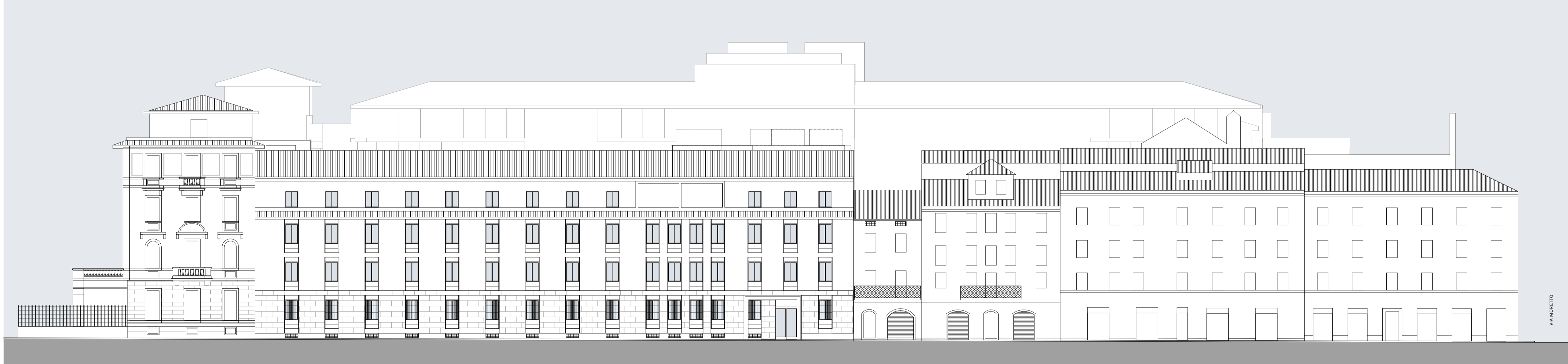
PROSPETTO EST - CONTRADA CAVALLETTO