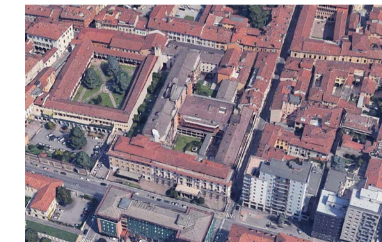
FOTO 5 - Vista aerea da sud - Via V. Emanuele II