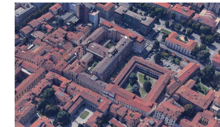
FOTO 6 - Vista aerea da nord - Via Moretto

COMMITTENTE ORDINE OSPEDALIERO DI S. GIOVANNI DI DIO - FATEBENEFRATELLI CERNUSCO SUL NAVIGLIO (MI)