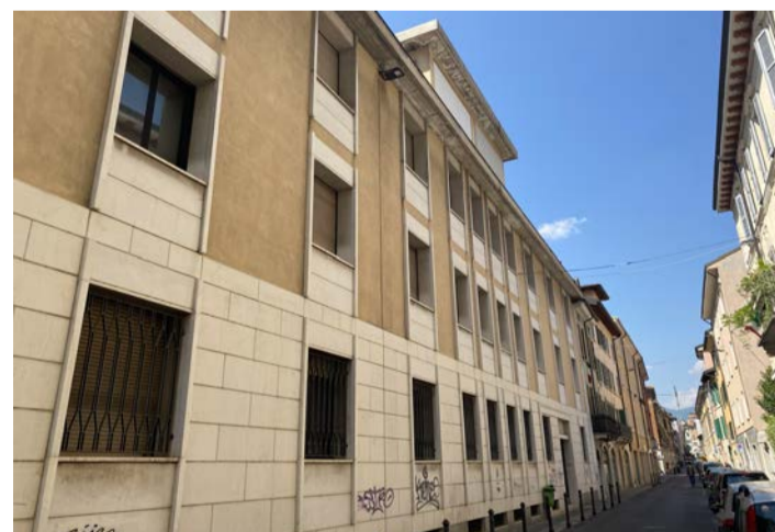
FOTO 2 - Contrada del Cavalletto