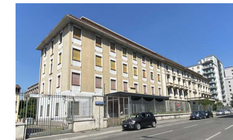
FOTO 4 - Via V. Emanuele II