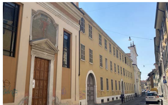
FOTO 3 - Via Moretto