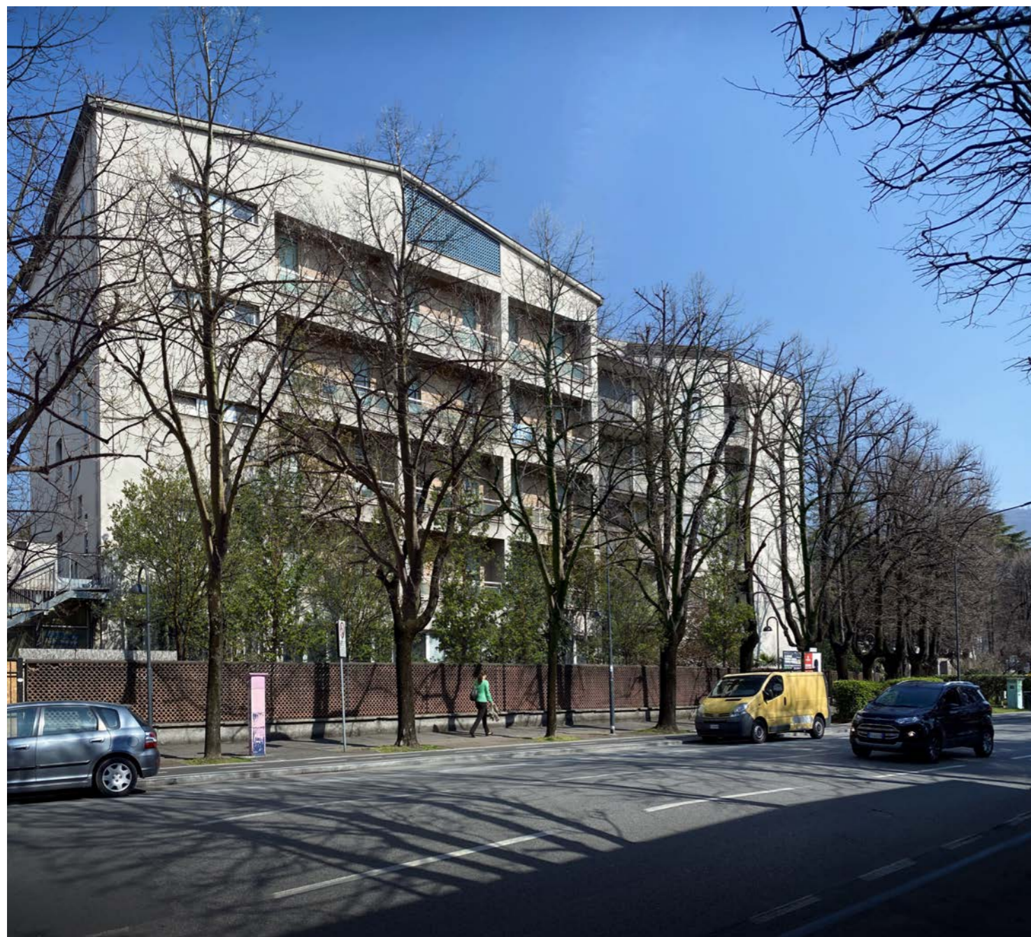
Immagine 3 – stato di fatto