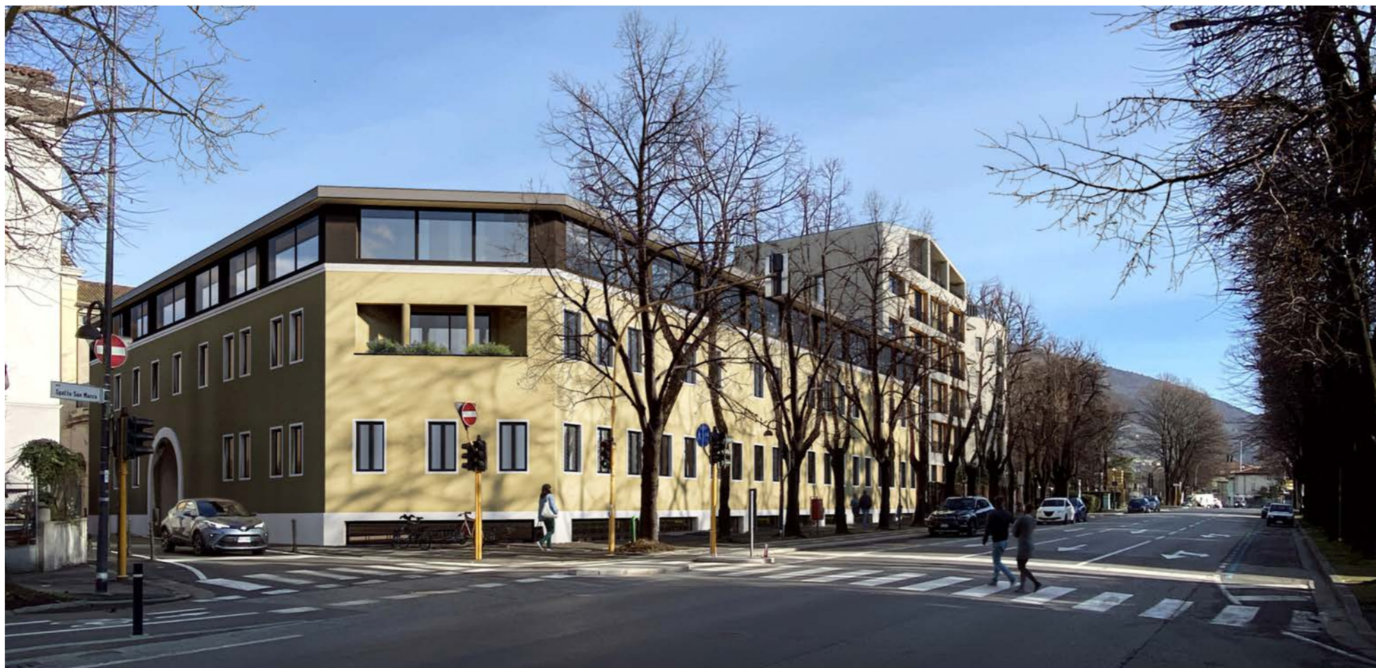
Immagine 2 – stato di progetto