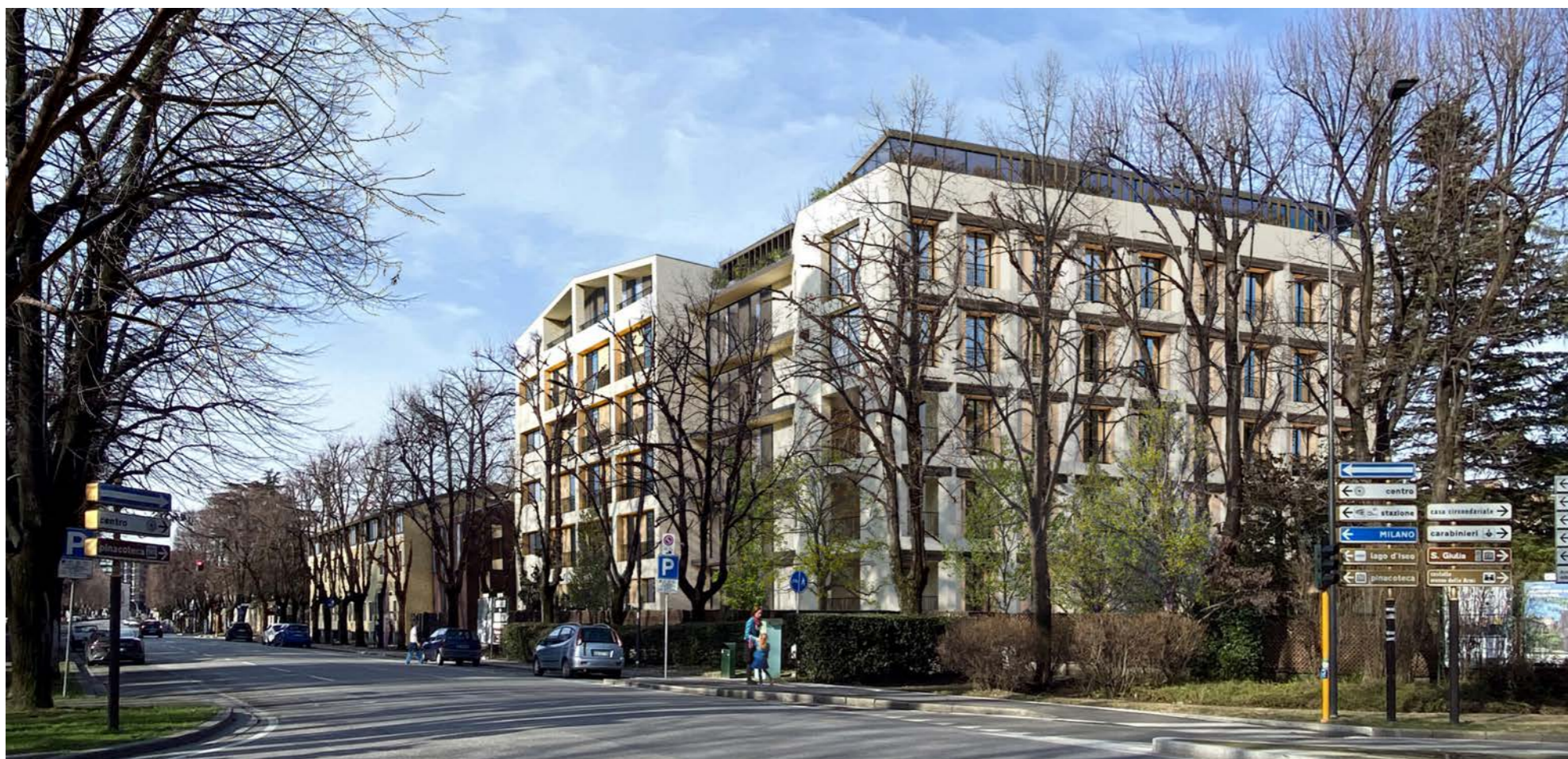
Immagine 1 – stato di progetto