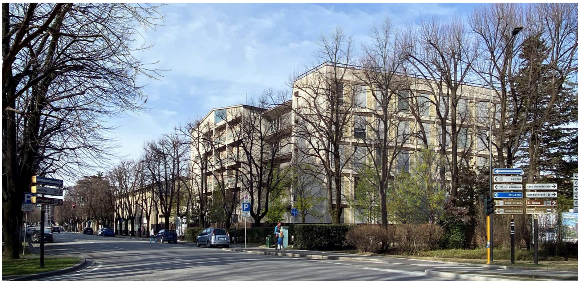
Immagine 1 – stato di fatto