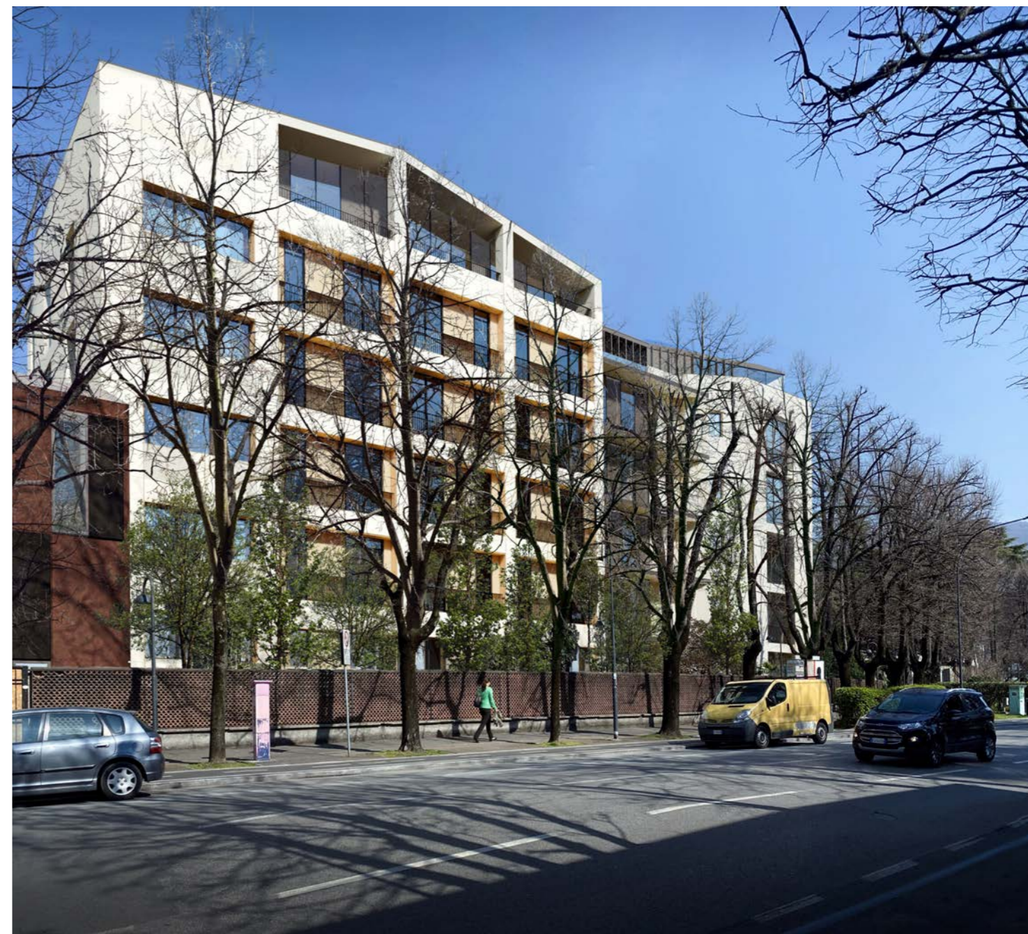
Immagine 3 – stato di progetto