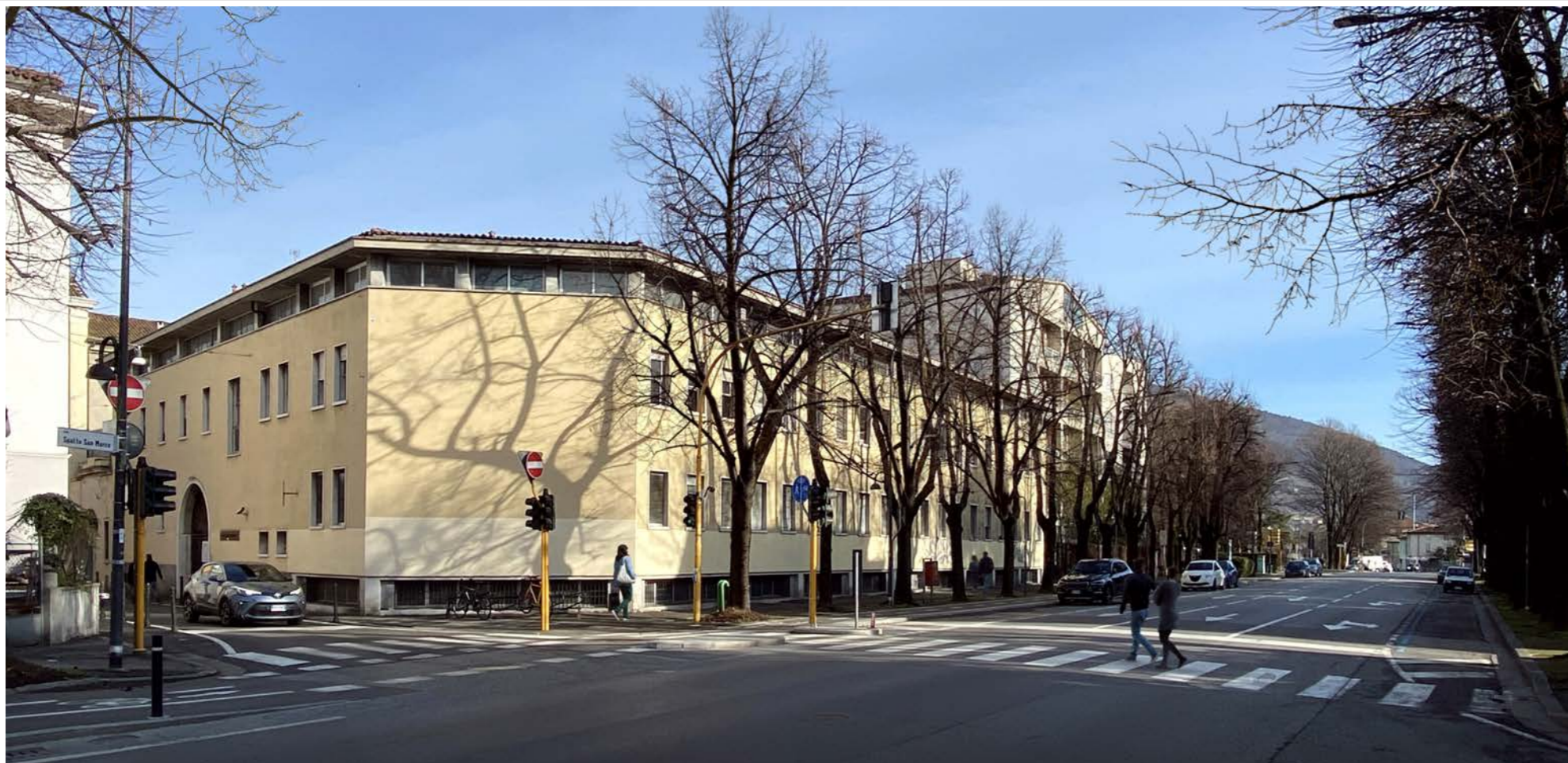
Immagine 2 – stato di fatto