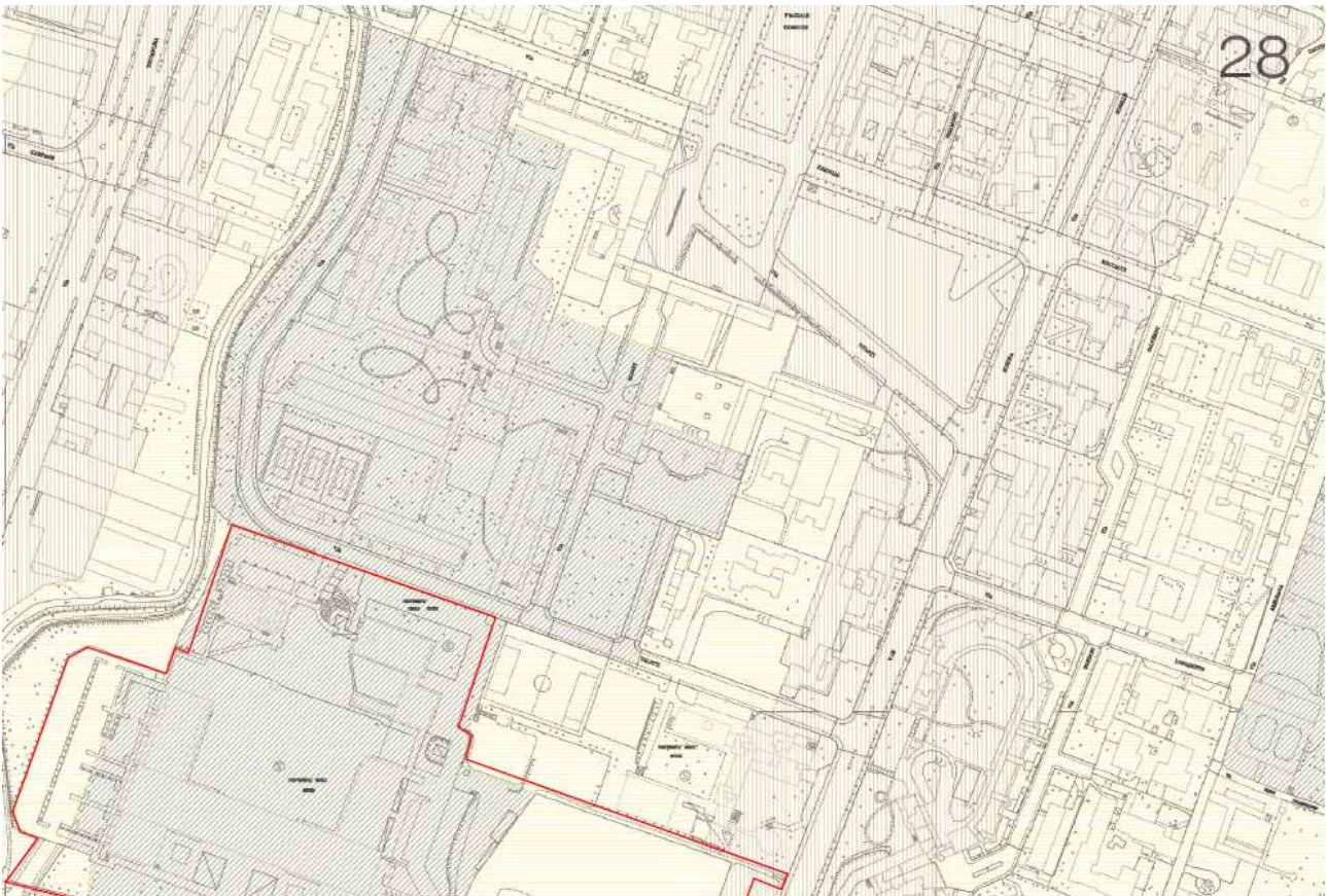
Figura 1 - PGT del Comune di Brescia - zonizzazione acustica Nord-Est - inquadramento area intervento

In Figura 1 e Figura 2 è rappresentata la zonizzazione acustica dell'area ricadente nel perimetro del PSn2; in Figura 3 è riportata la relativa legenda.