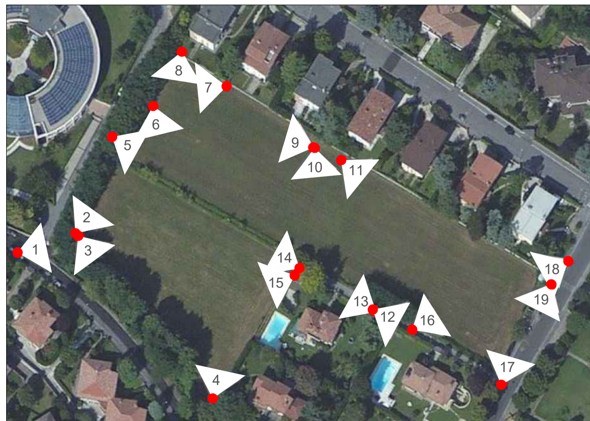
POSIZIONE RIPRESE FOTOGRAFICHE