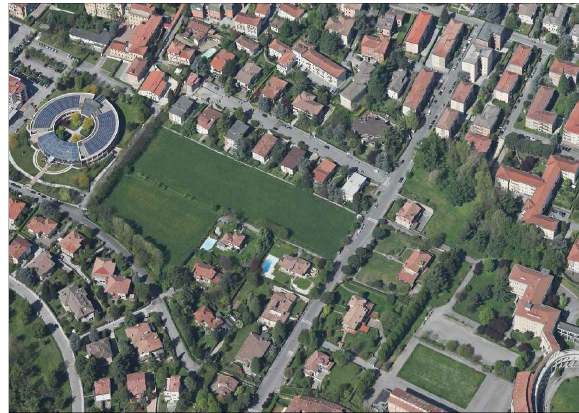
VISTA AREA DA NORD-EST