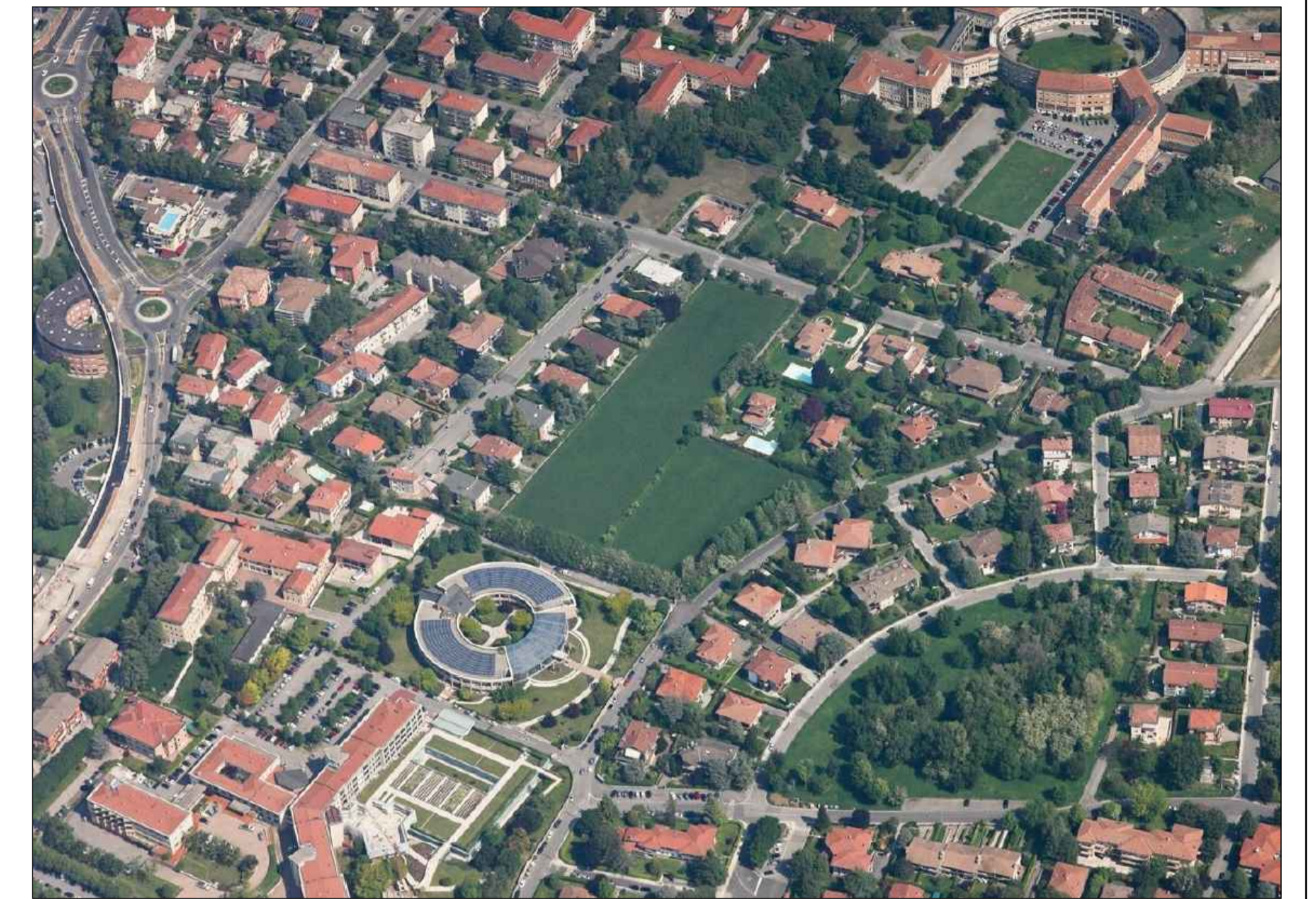
VISTA AREA DA SUD-EST