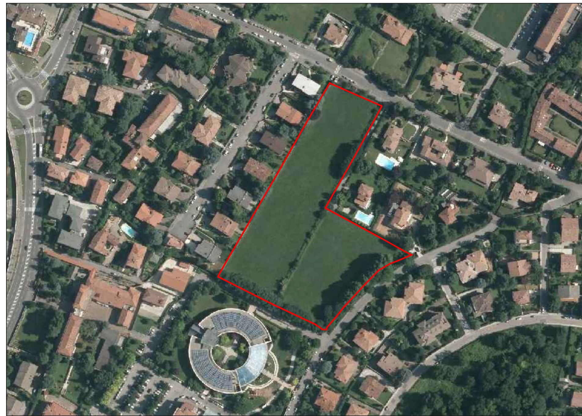
ESTRATTO ORTOFOTO (da Geoportale Provincia di Brescia) - scala 1:2000