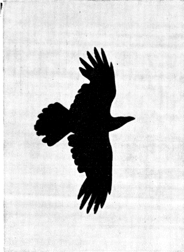
Fig. 4 - Corvo imperiale in volo; si noti la caratteristica forma cuneata della coda.

Abbastanza frequente come stazionaria e nidificante, dal fondovalle fino alle medio-alte quote; localmente erratica durante la cattiva stagione e di doppio passo regolare. Si ibridizza frequentemente con la conspecifica Cornacchia nera, che vive generalmente alle stesse quote ed ad altitudini maggiori. La ritengo specie abbastanza diffusa e numericamente costante.