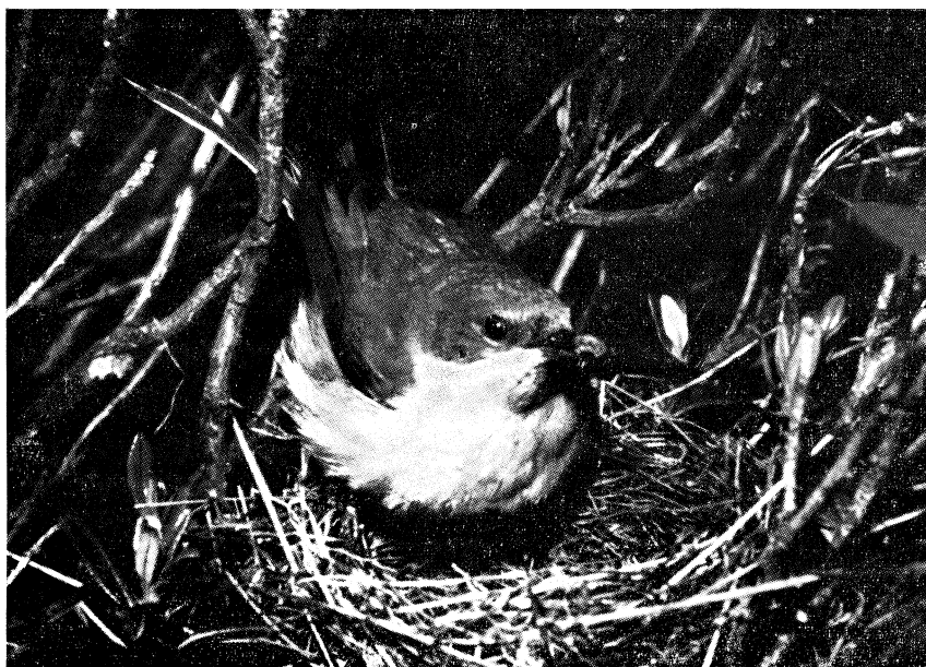
Fig. 5 - Bigiarella con l'imbeccata al nido, costruito in un cespuglio di Rododendro (Foto P. Bricchetti).