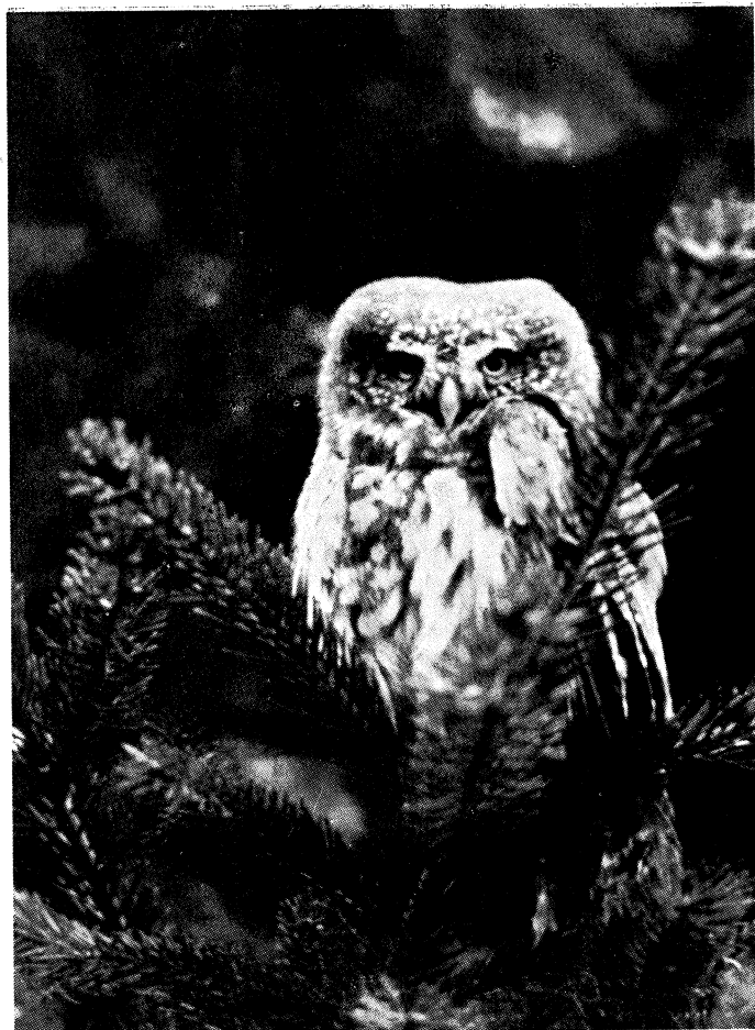
Fig. 2 - Una rarissima Civetta nana sorpresa nel bosco.