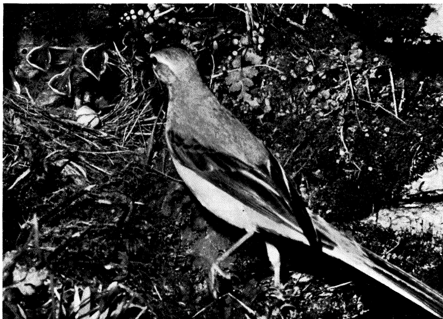
Fig. 3 - Ballerina gialla al nido.