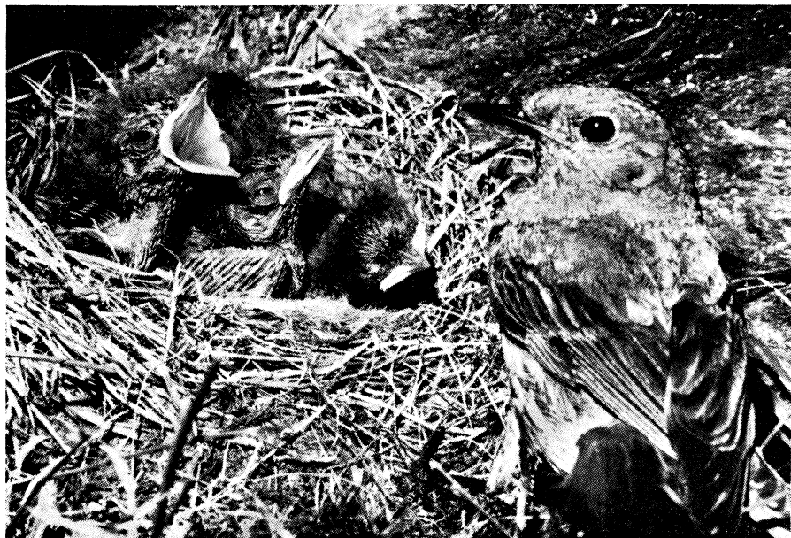
Fig. 6 - Femmina di Codirosso spazzacamino al nido.

le rocce, ma anche nelle cavità delle muraglie e delle baite. Ne incontro ogni anno alcune coppie nell'«alta Valle di Viso», lungo la strada per il «Passo Gavia», nei dintorni del paese, etc. La ritengo specie relativamente diffusa e pare in diminuzione.