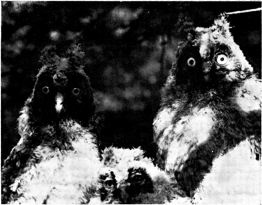
Fig. 1 - Tre nidiacei di Gufo comune sorpresi nei pressi del nido.

metri, osservai un giovane Cuculo mentre veniva imbeccato contemporaneamente da individui di tre specie diverse (Stiaccino, Spioncello, Culbianco); tale fatto risulta veramente interessante e non usuale.