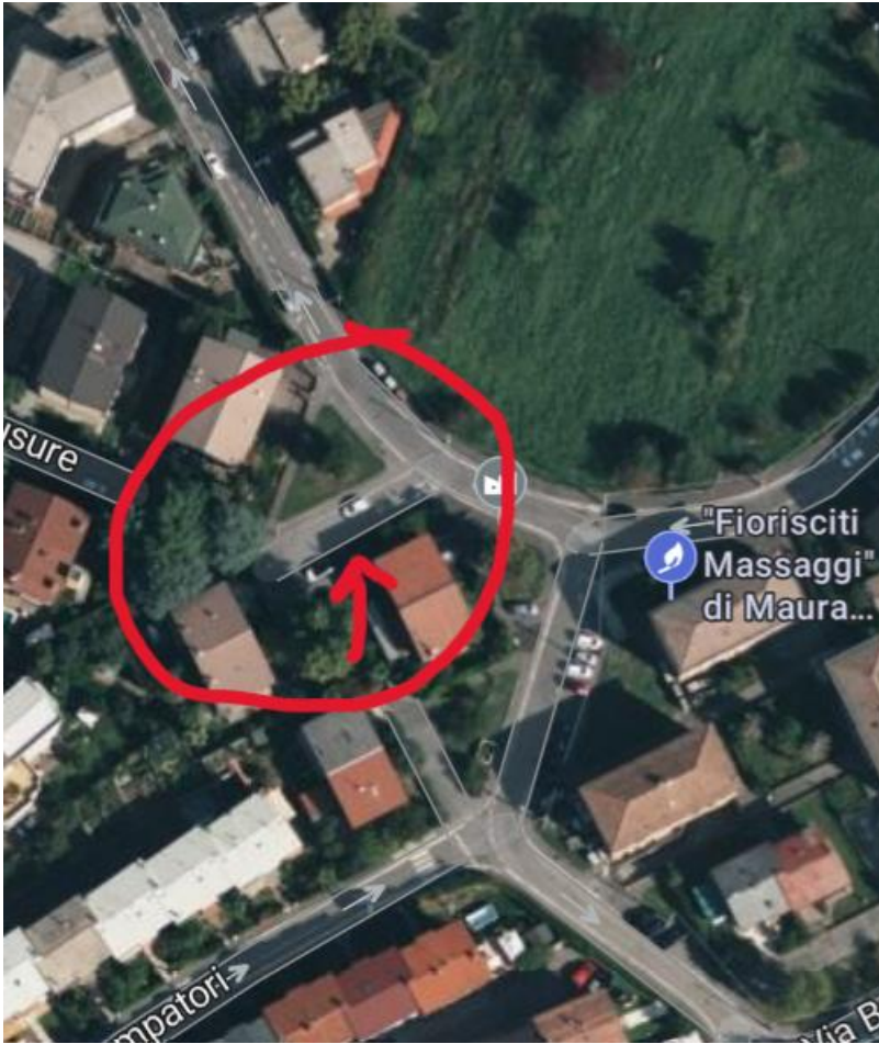
VIA EGLI ARTIGIANI 27