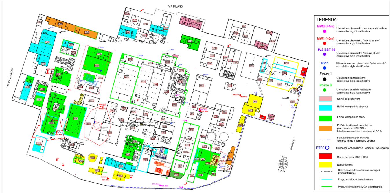
Figura 1: Planimetria demolizioni