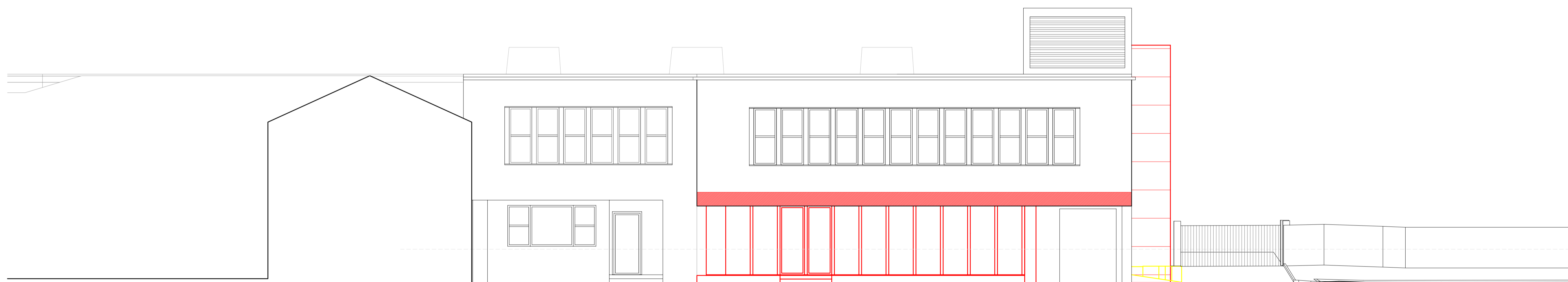
Prospetto Sud scala 1:100