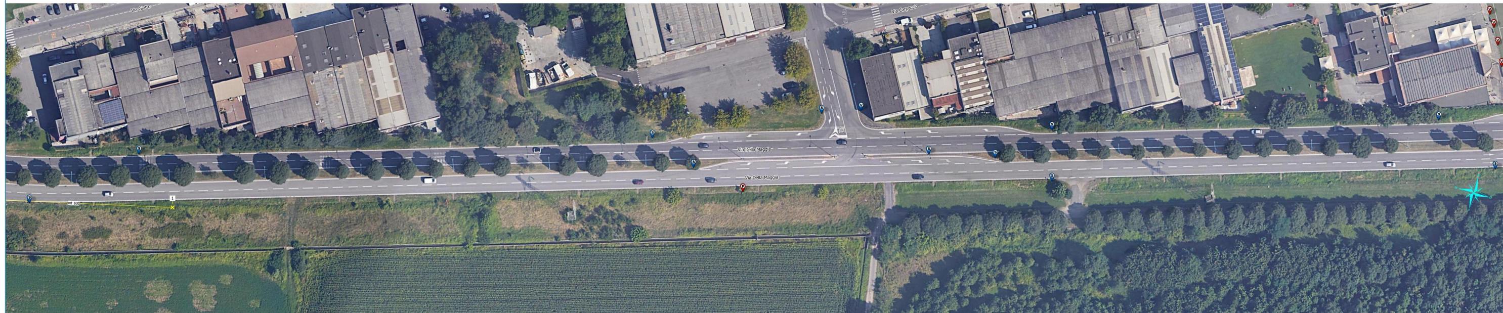
Via della Maggia - tratto n.2