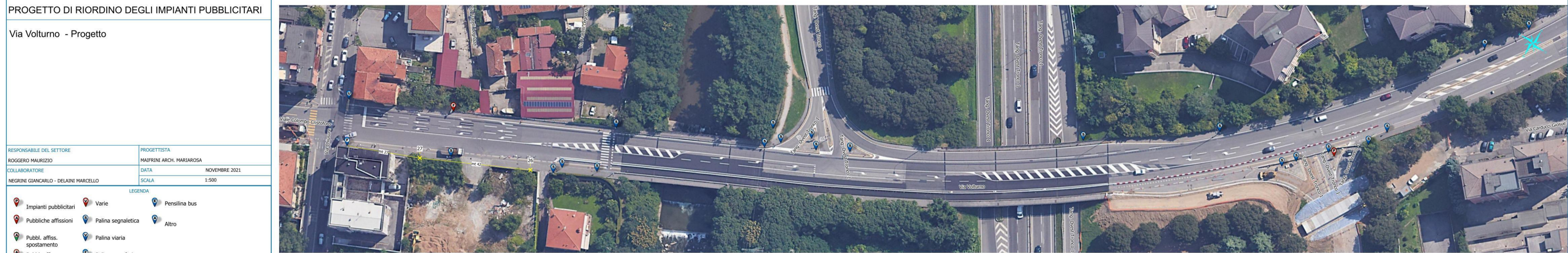
Via Voltorno - tratto d'insieme