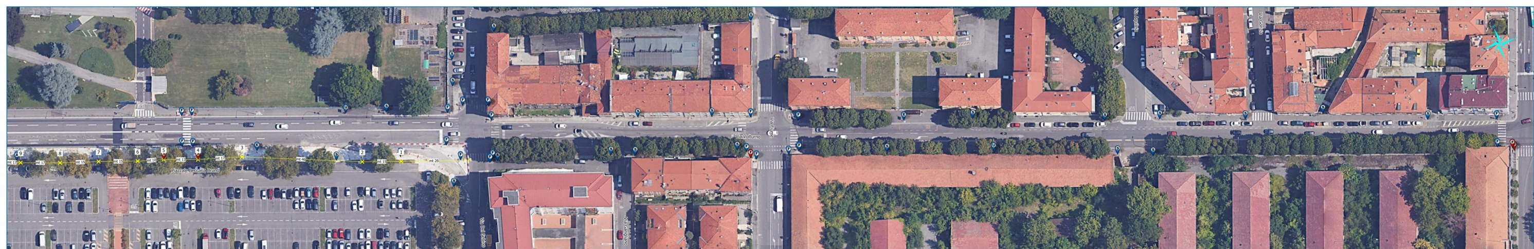
Via Voltorno - tratto n.1