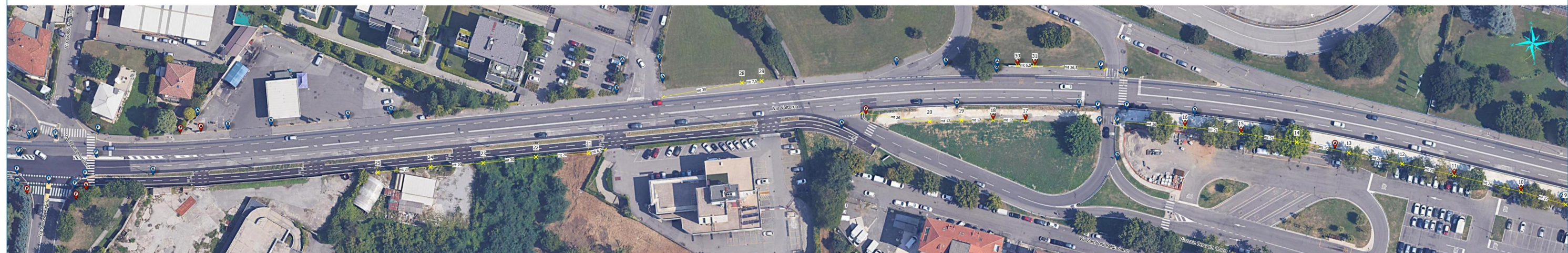
Via Voltorno - tratto n.2