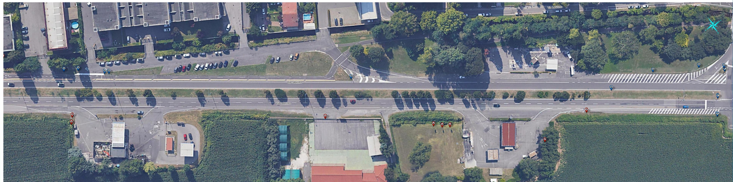
Via Labirinto tav.1 - tratto n.3