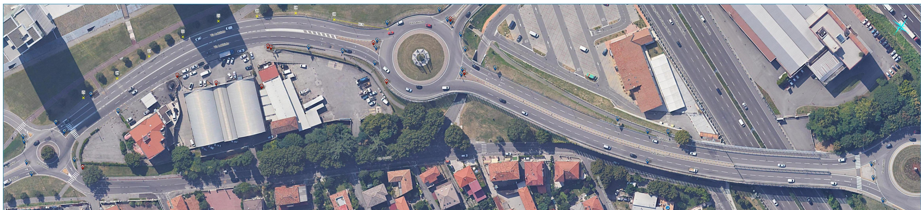
Via Labirinto tav.1 - tratto n.1