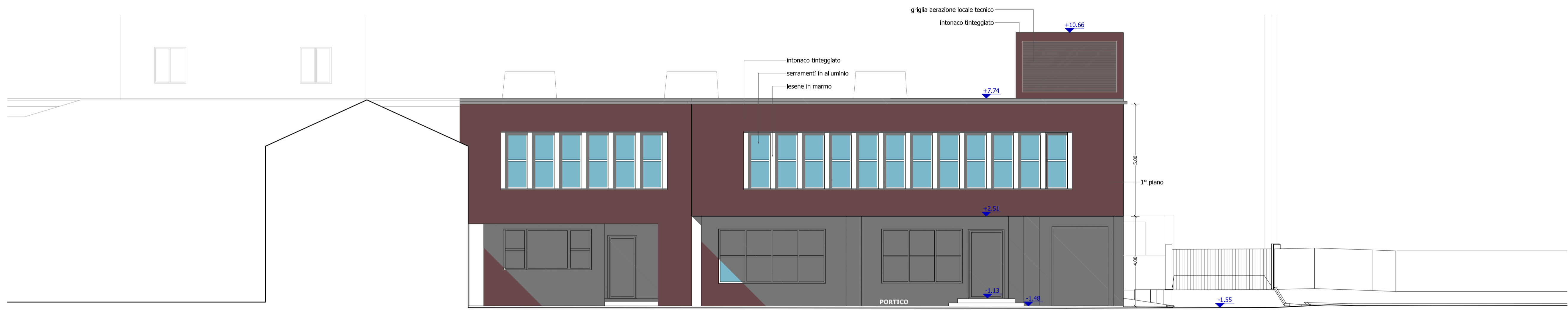
Prospetto Sud scala 1:100