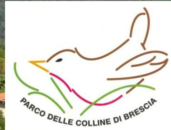
La Valle di Mompiano