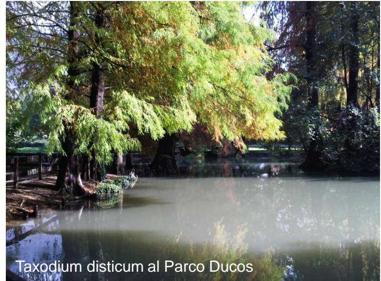
Taxodium disticum al Parco Ducos

E' in corso in collaborazione con il Museo di Scienze Naturali un aggiornamento di tale censimento finalizzato ad individuare anche al di fuori delle proprietà pubbliche, altri alberi degni di essere iscritti nell'elenco degli alberi monumentali d'Italia.