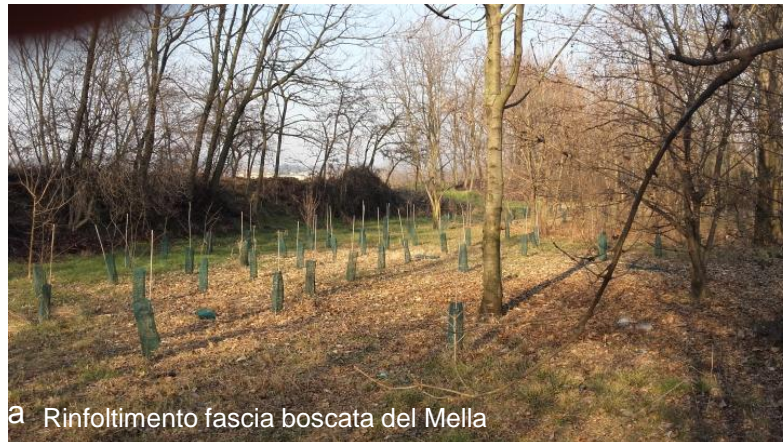
a Rinfoltimento fascia boscata del Mella