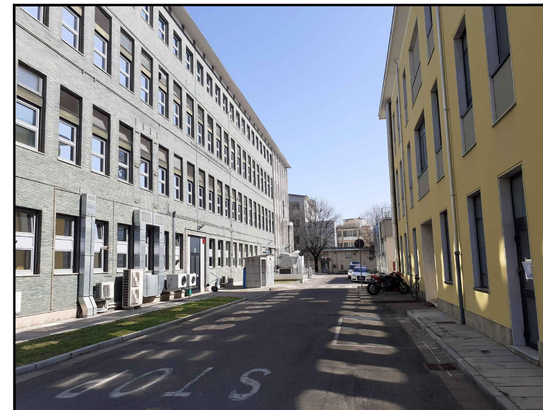
Viabilità interna tra edificio 12 e edificio 11