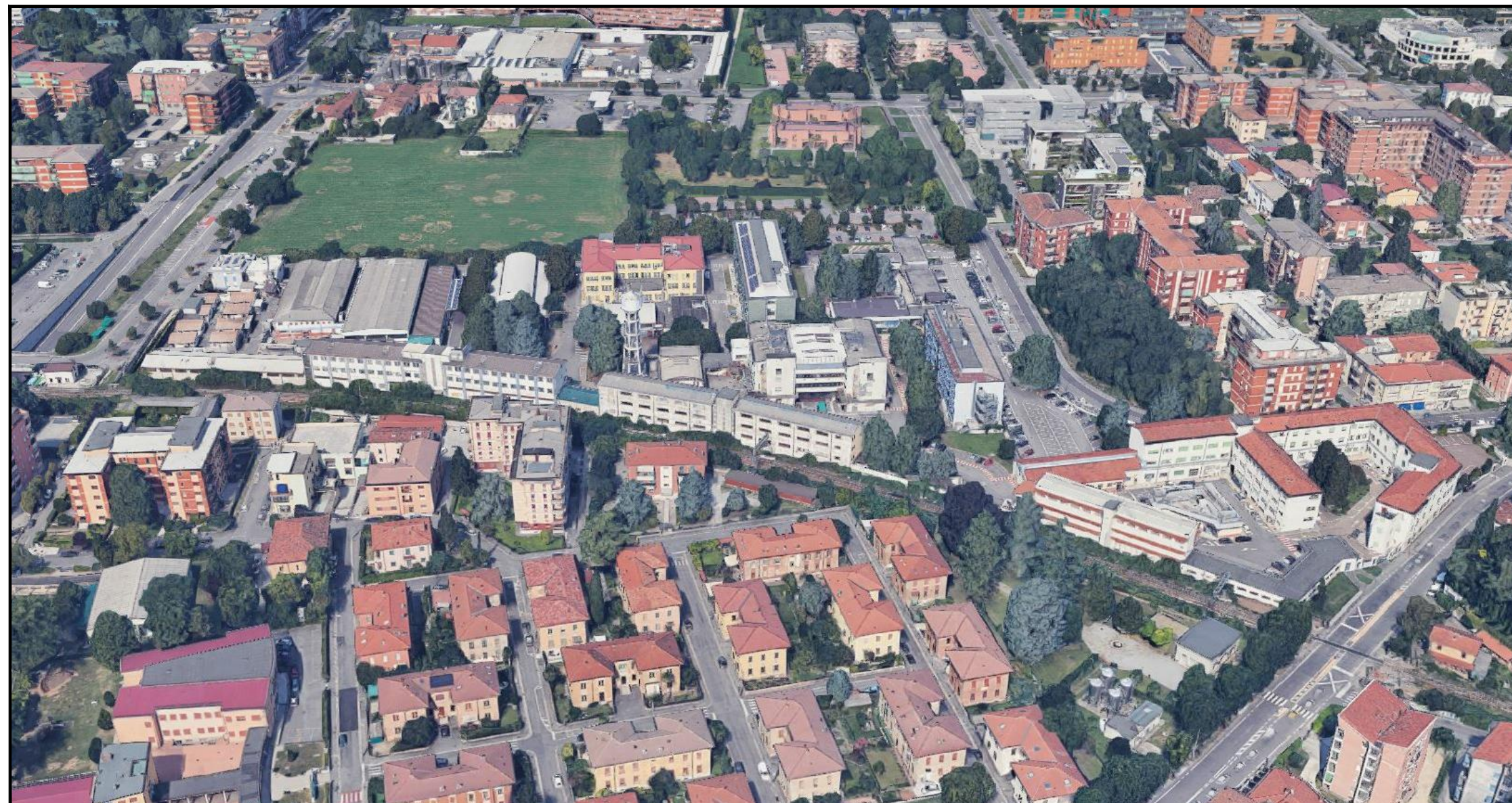
Vista dall'alto dell'Istituto da Google Earth: Vista da Est