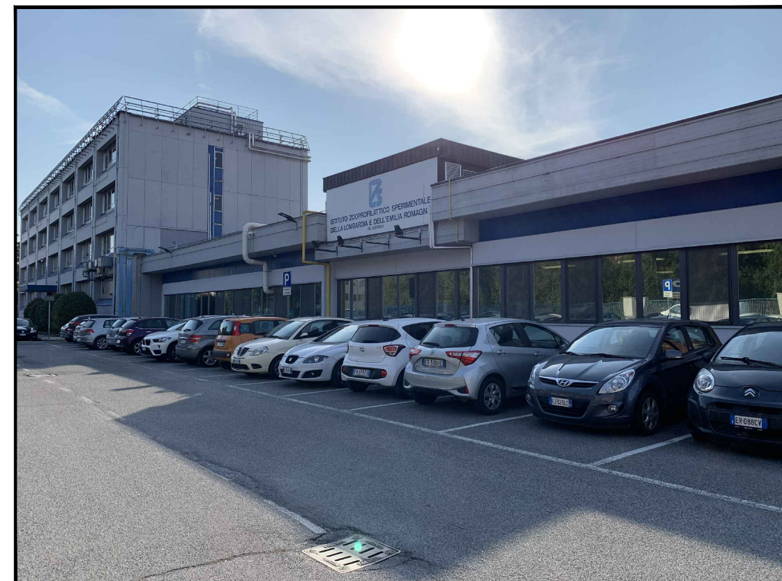
Vista dal parcheggio su Via Bianchi