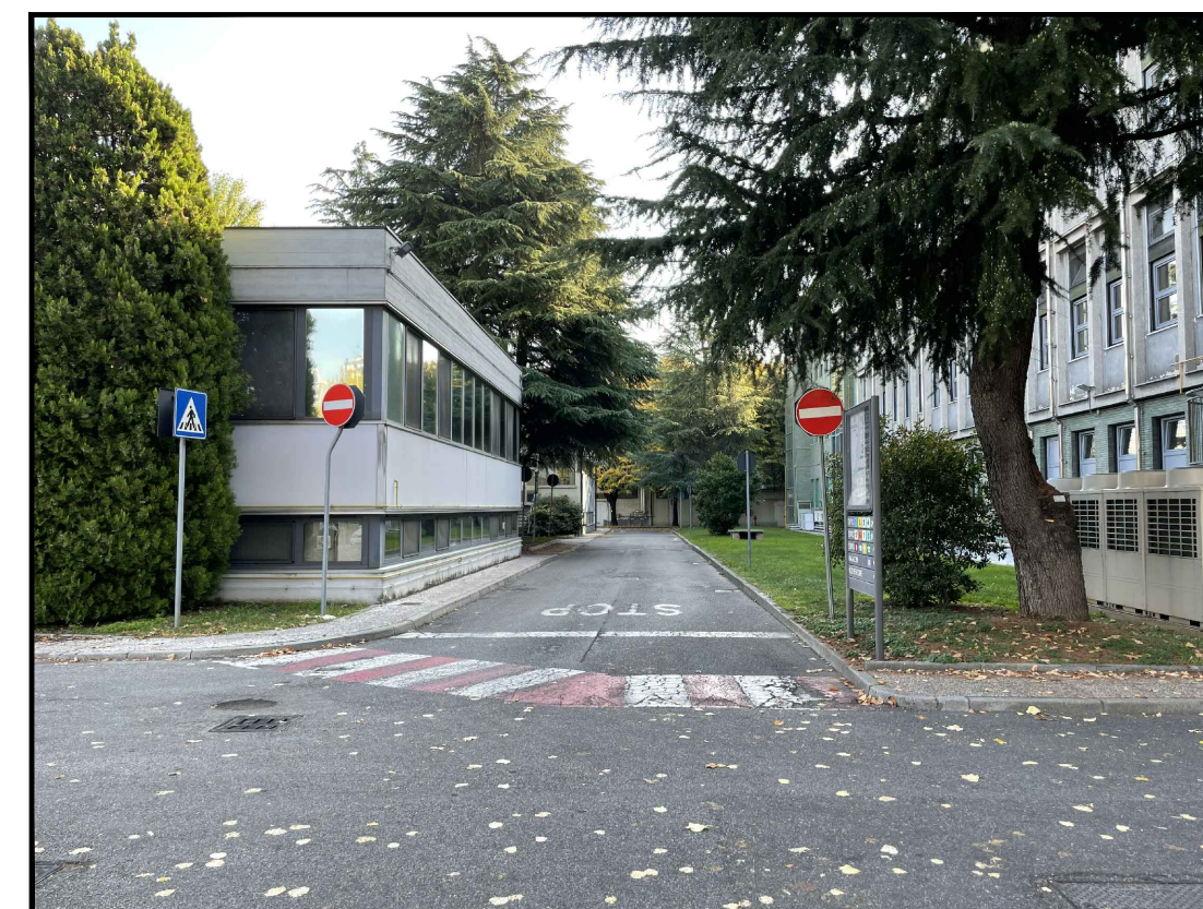
Viabilità interna tra edificio 12 e edificio 13A