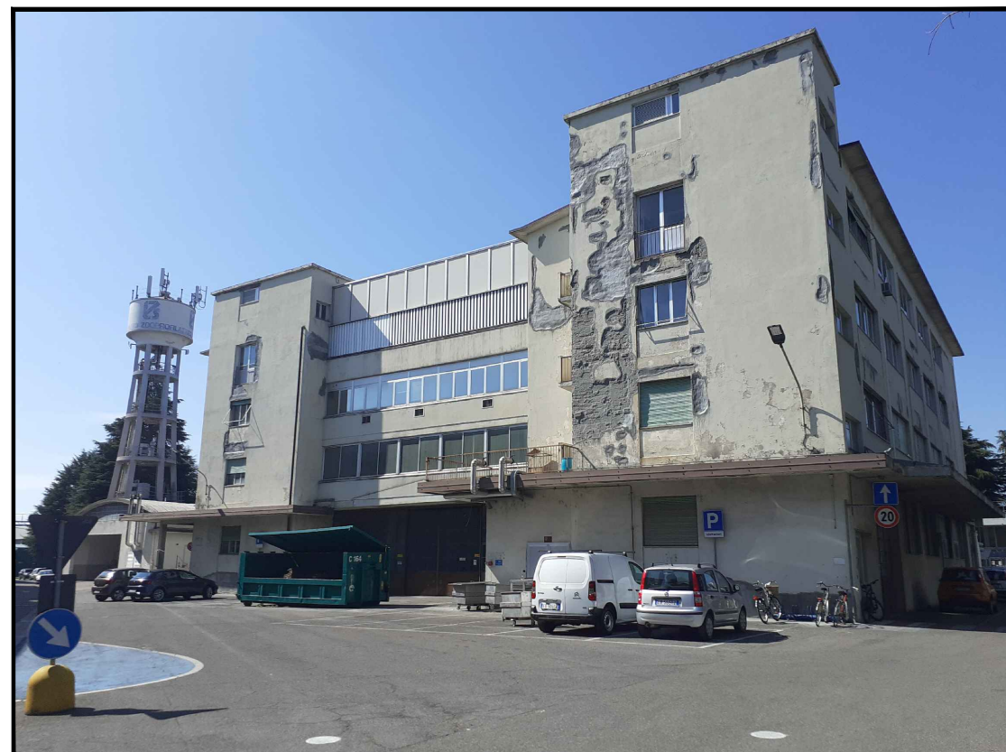
Vista dell'edificio 18 (EX-IZO) oggetto di intervento