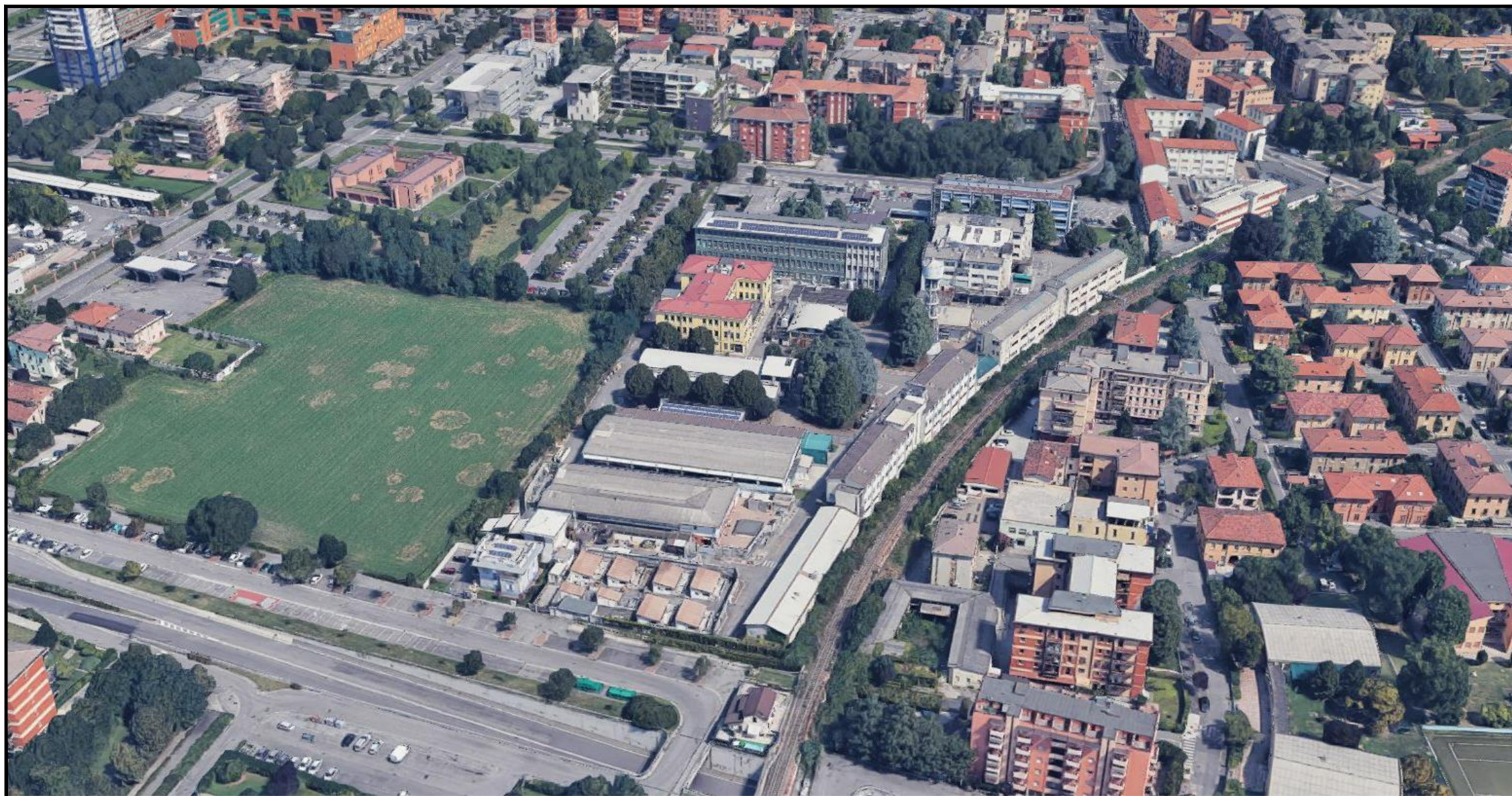
Vista dall'alto dell'Istituto da Google Earth: Vista da Sud