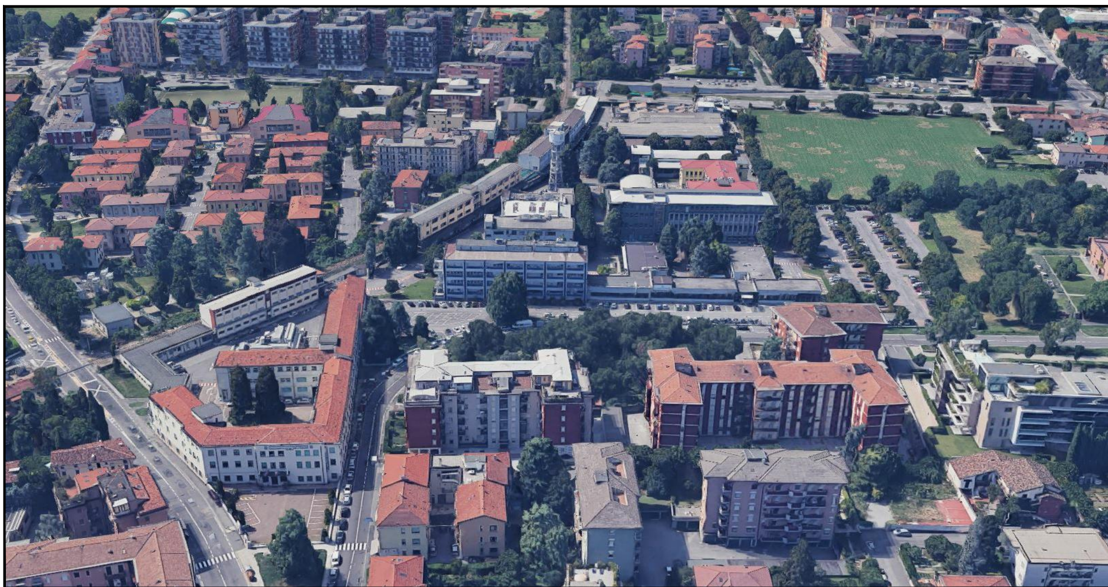
Vista dall'alto dell'Istituto da Google Earth: Vista da Nord