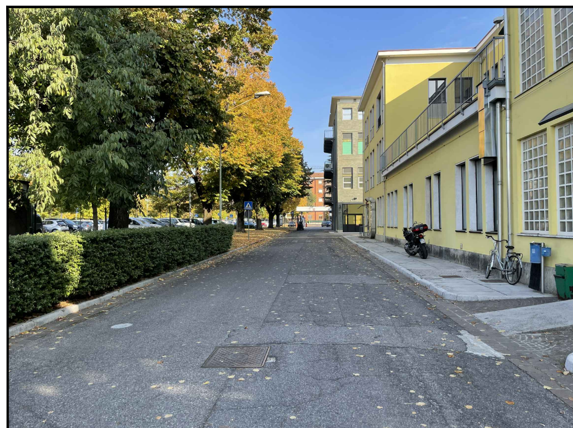
Viabilità interna tra edificio 11 e parcheggio interno