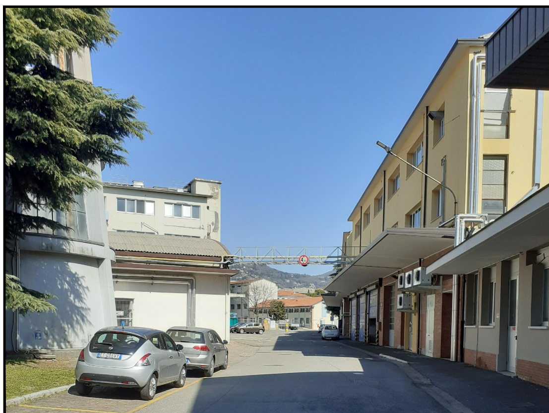
Viabilità interna tra edificio 9 e edificio 17