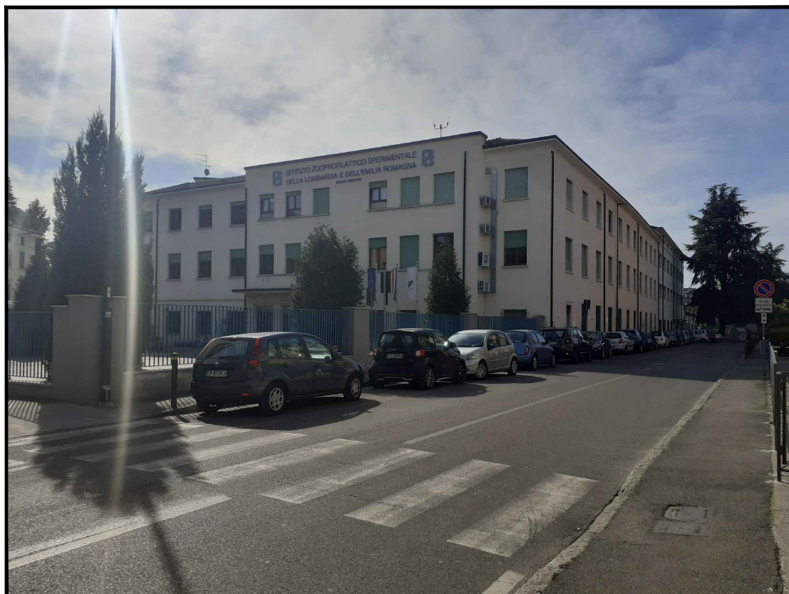
Vista dell'edificio storico principale