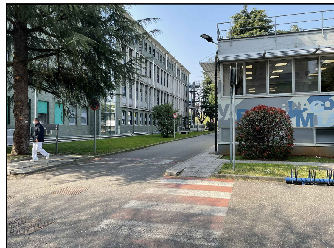
Viabilità interna tra edificio 12 e edificio 15