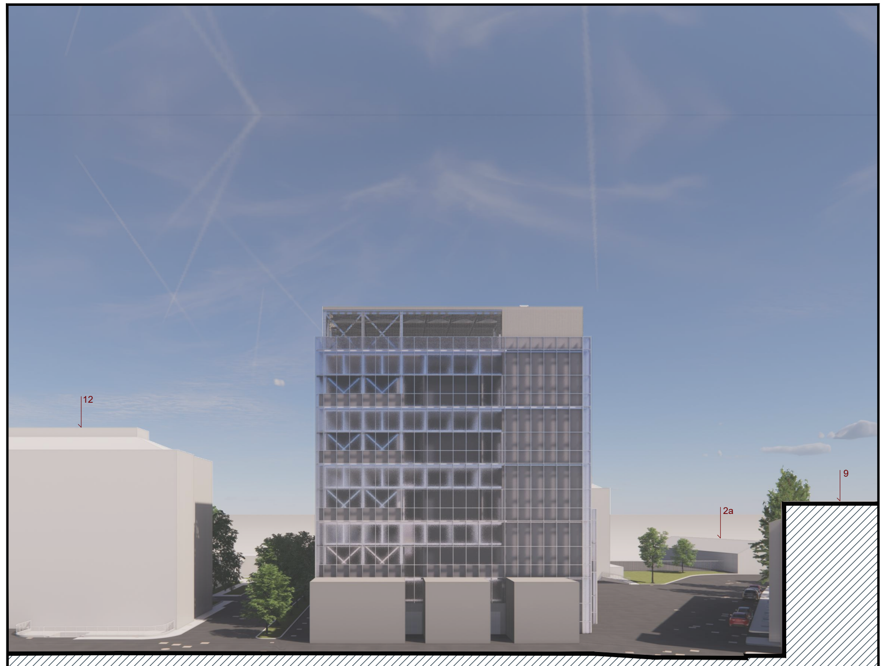
BB - Rappresentazione prospettica da Sud