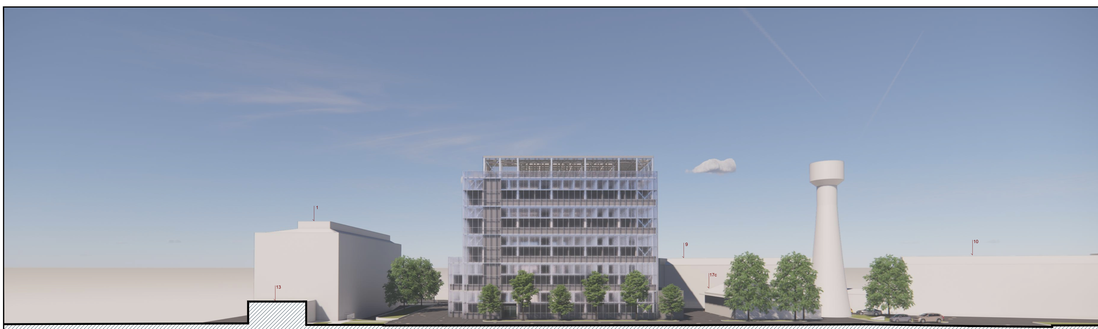
DD - Rappresentazione prospettica da Ovest