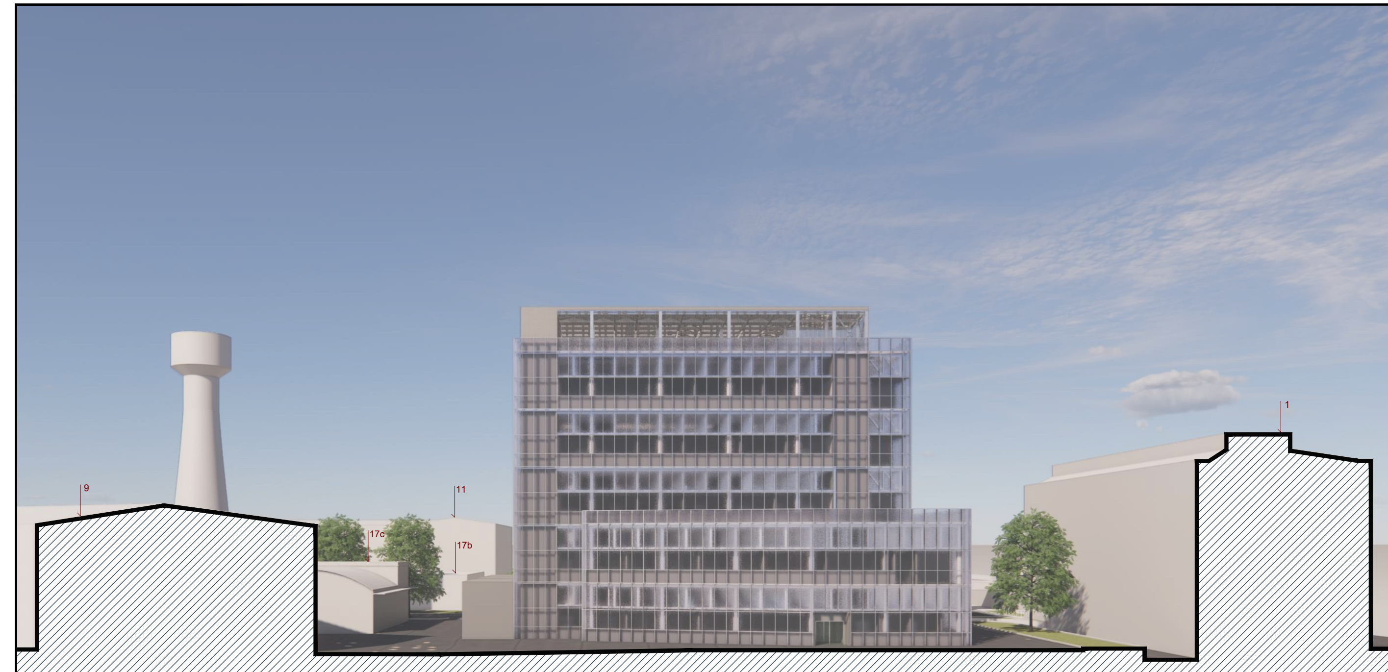
CC - Rappresentazione prospettica da Est