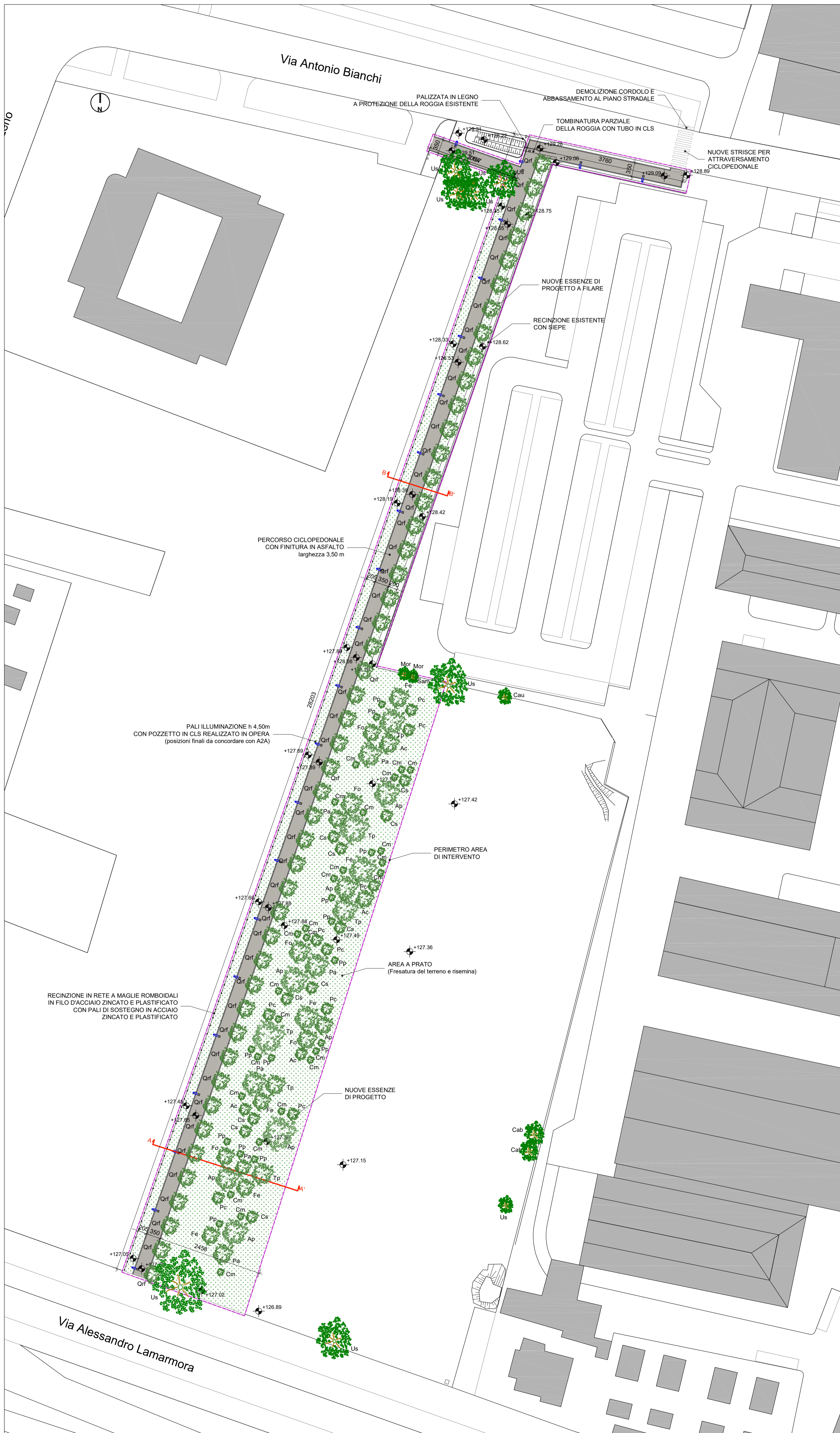
Planimetria - Scala 1:500