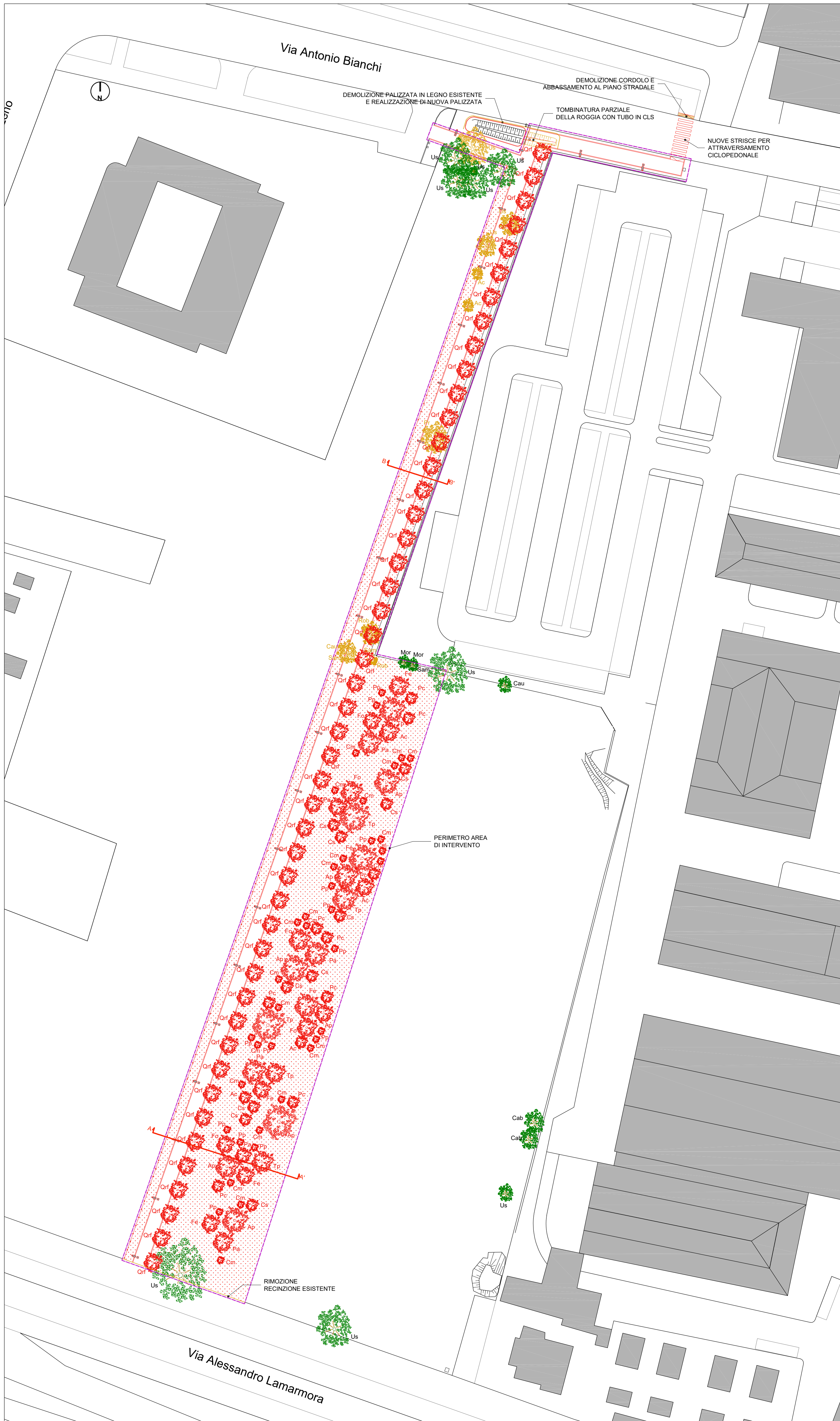
Planimetria - Scala 1:500