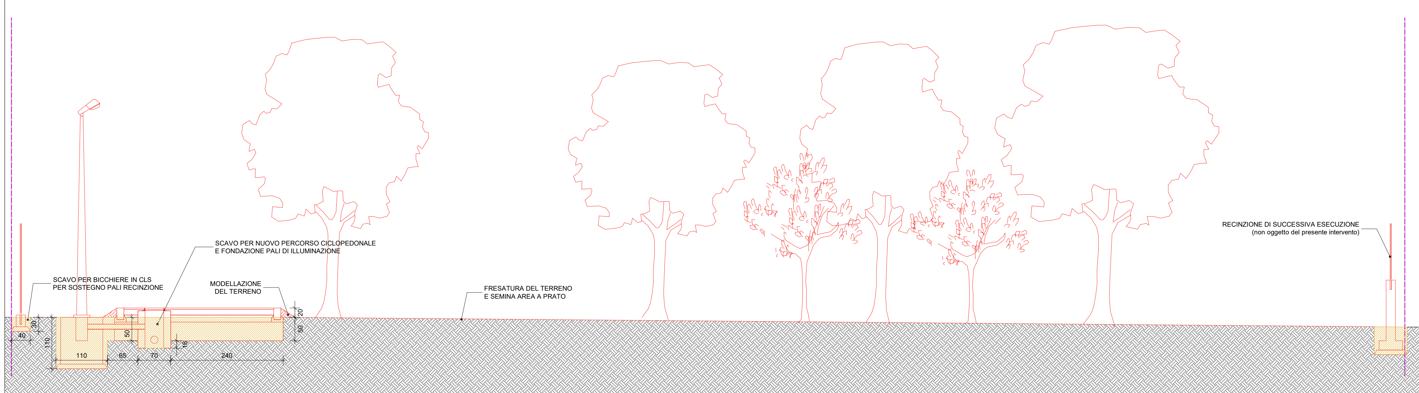
Sezione A-A' - Scala 1:50