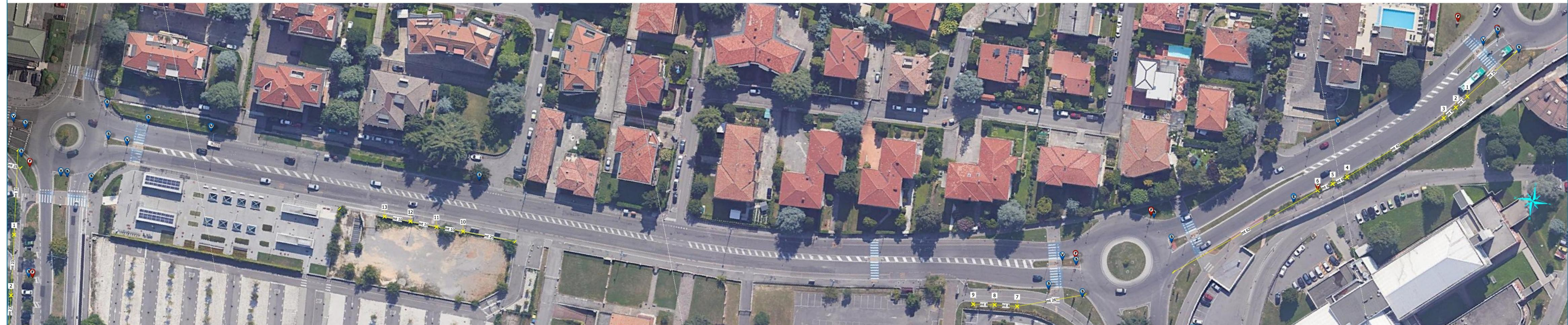
Viale Europa - Tav.2