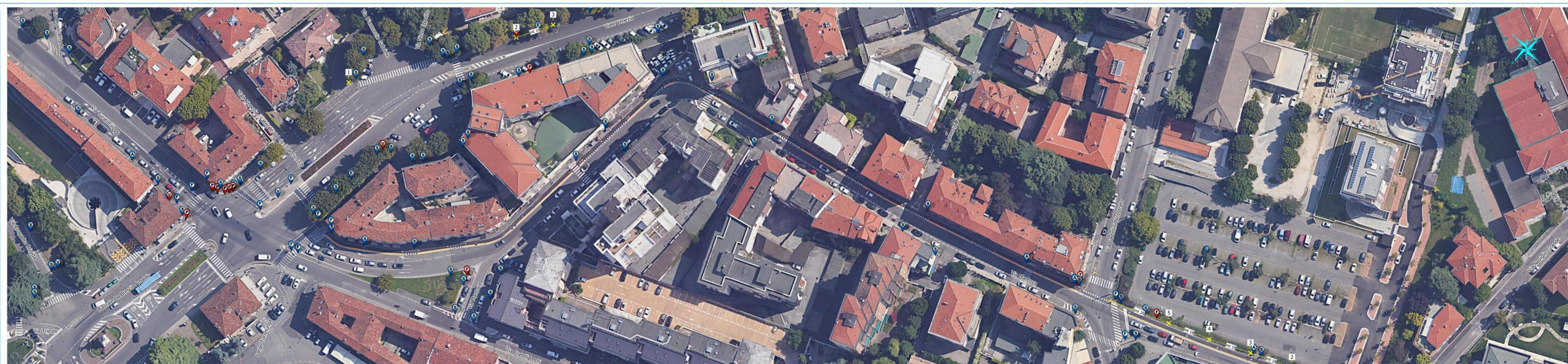
Via Mantova - Tav.1 - 1:500