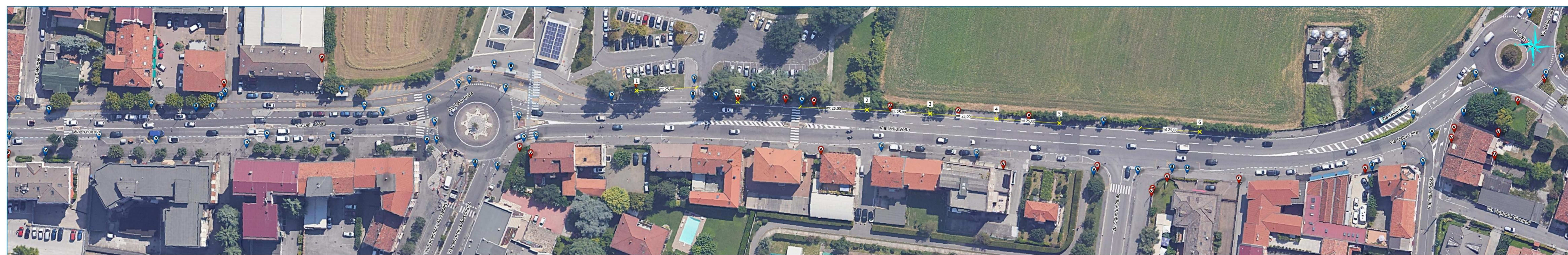
Via della Volta - tratto n.1