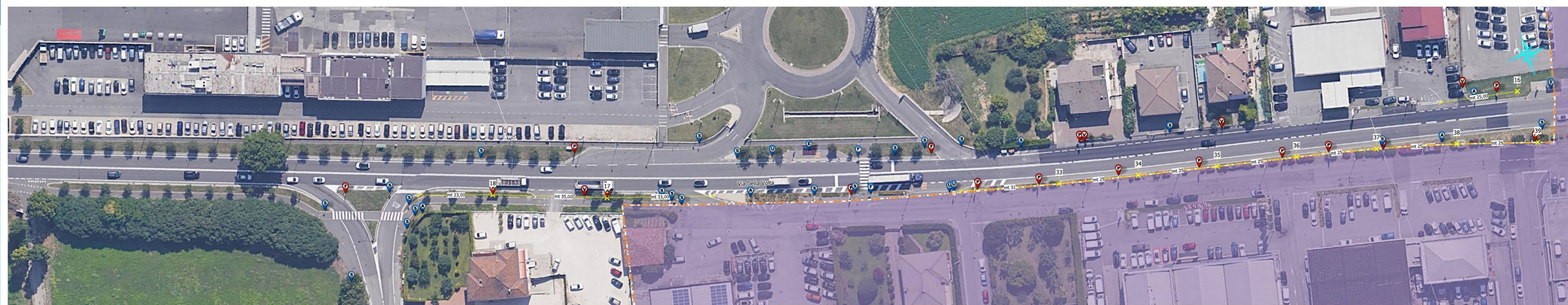
Via della Volta - tratto n.5