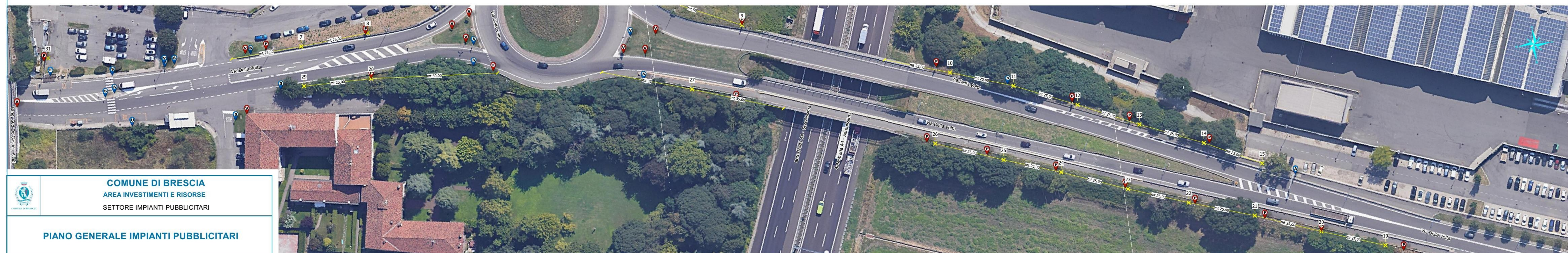
Via della Volta - tratto n.4