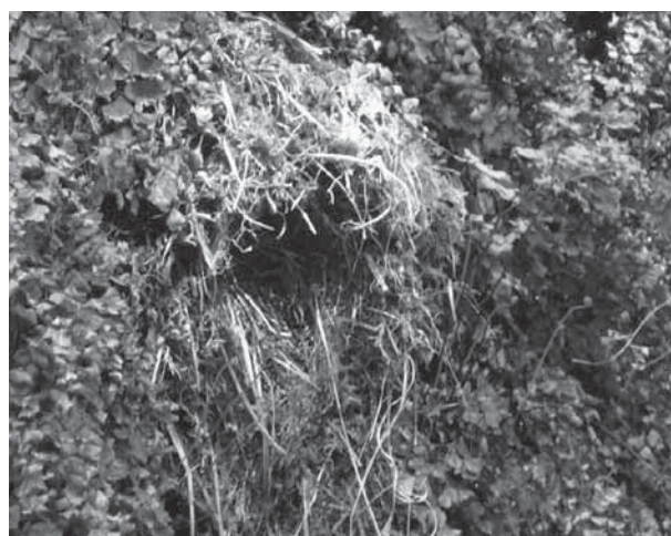
Nido di Merlo acquaiolo a 110 m s.l.m. (Fulvio Zanardini, 2009).